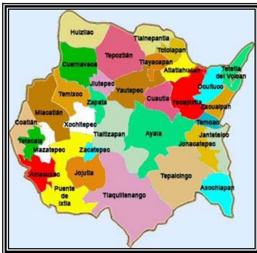
Mapa 3. División política actual del estado de Morelos