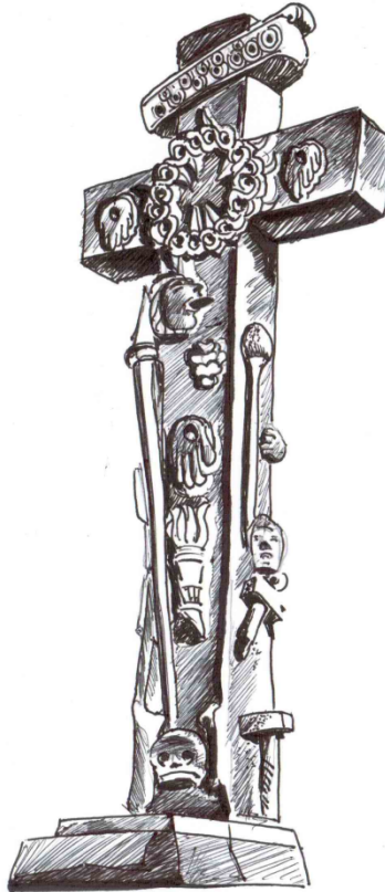
Cruz atrial adosada, siglo XVI Tepeapulco, Hidalgo

Se expone en Las Cartas de relación que la población de México-Tenochtitlan fue diezmada por guerra, hambre y enfermedad, se asegura que murieron más de cincuenta mil indígenas. La aprehensión de Cuauhtémoc por el capitán Holguín, afirma la conquista de México. Cesó la guerra el martes 13 de agosto de 1521, día de San Hipólito; en consecuencia, la cultura fue destruida con las armas de hierro y de fuego (Rojas. 1975; p.17). De todas las artes que florecieron en México a la llegada de los españoles, la escultura (...) había alcanzado un grado de mayor perfeccionamiento (Toussaint, M. 90; p.23), también fue destruida.