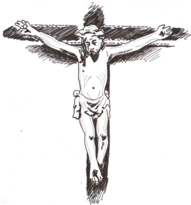
Cristo de marfil, siglo XVIII Procedente de Filipinas

Los motivos simbólicos y ornamentales nacen de la estampa impresa en los libros de oraciones y misales, llevados a la piedra con monogramas, símbolos, e iconografía religiosa: Pasión de Cristo, santos, vírgenes, apóstoles, ángeles, tallos, follaje, rosas, flores de lis, escudos, balaustres, medallones, frutos y festones ubicados en la arquitectura, escultura, muebles, cruces, pilas, fuentes.