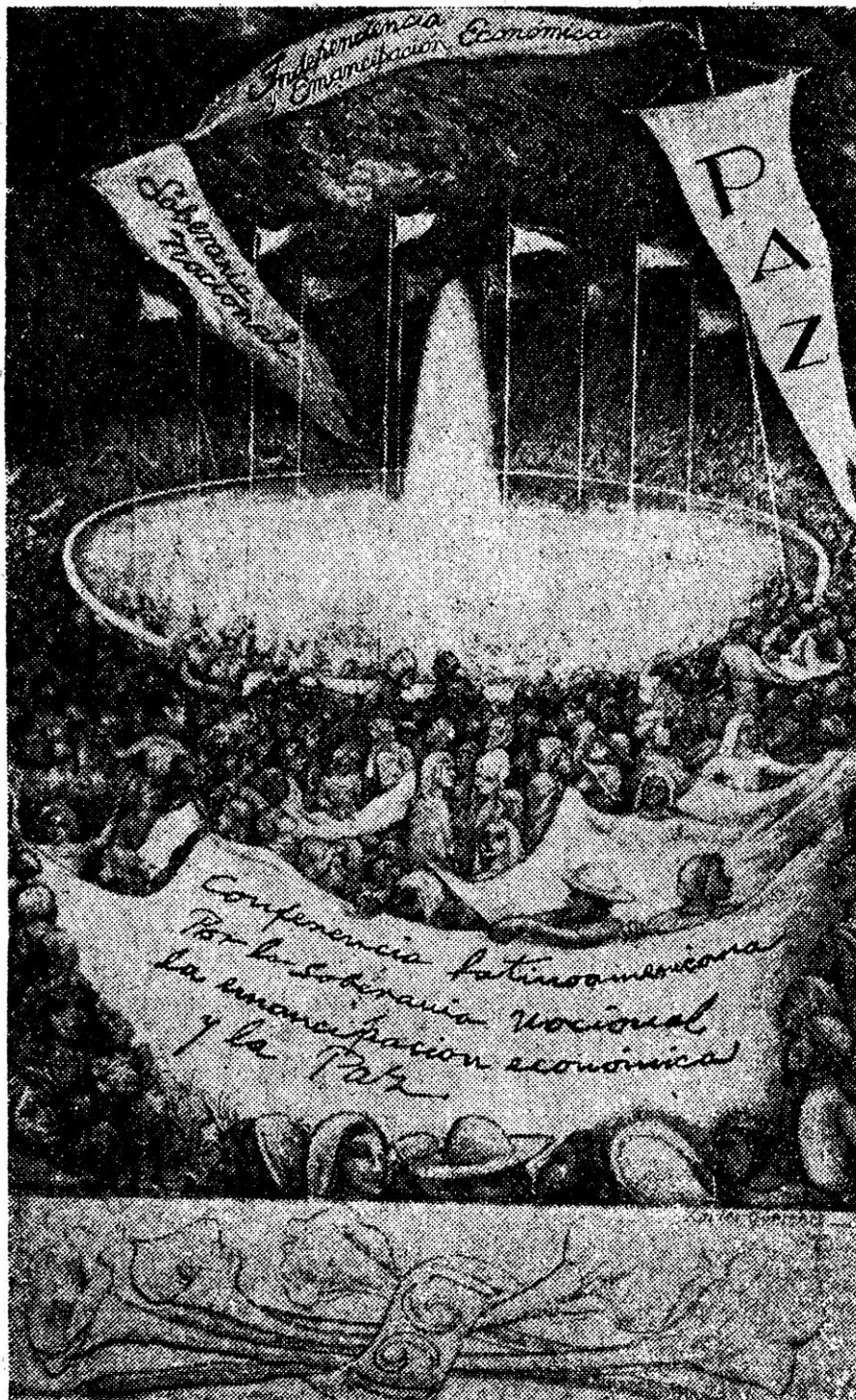
Xavier Iñiguez Conferencia Latinoamericana por la Soberanía Nacional, la Emancipación Económica y la Paz Dibujo, 1961, 17.5 x 23.5 cm.