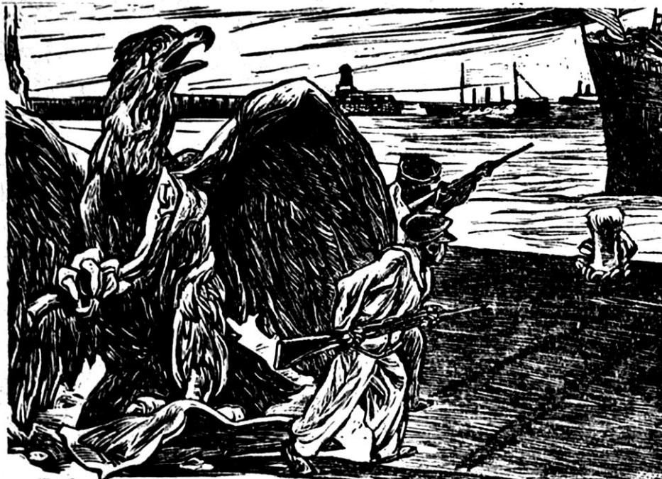
Pablo O'Higgins, s/f "Intervención en Veracruz" , 1961. Volante, Grabado en linóleo. 17.5 x 23.5 cm