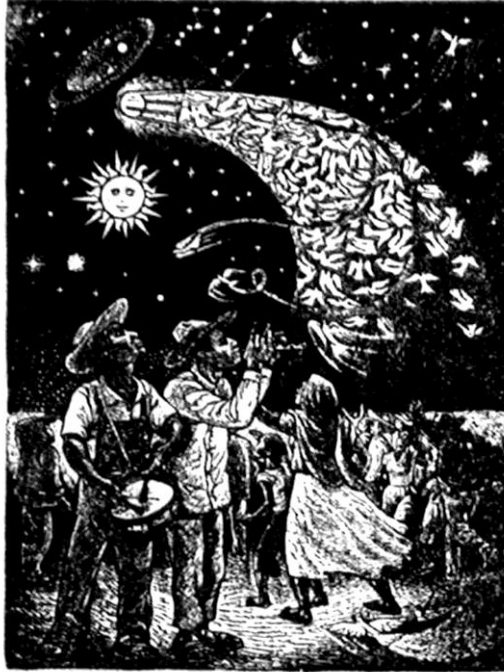
Xavier Iñiguez, s/f "Fiesta popular" , 1961. Volante, Litografía. 17.5 x 23.5 cm