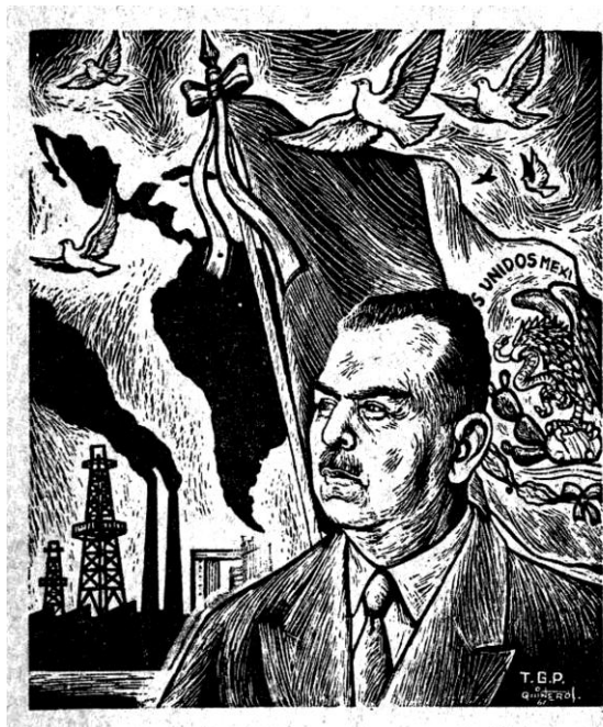
Adolfo Quinteros, s/f "Cárdenas por la paz", 1961. Volante, Grabado en linóleo. 17.5 x 23.5 cm