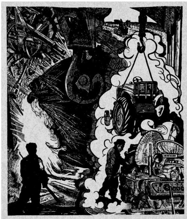
Alberto Beltrán. s/f "Industria pesada" , 1961. Volante, Grabado en linóleo. 17.5 x 23.5 cm