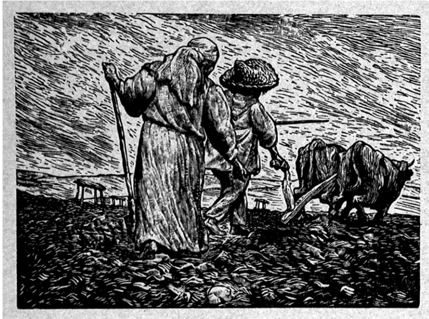
Leopoldo Méndez, s/f "La siembra" , 1961. Volante, Grabado en linóleo. 17.5 x 23.5 cm