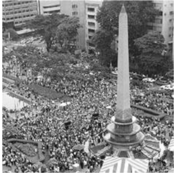
Concentración de militares en desobediencia y simpatizantes, en la Plaza de Altamira.

A la gente que falleció le hicieron homenajes y todo eso, a veces eran en la universidad o en otros lugares, la cuestión era que estaban en desacuerdo porque a muchas personas las estaban matando como animales.