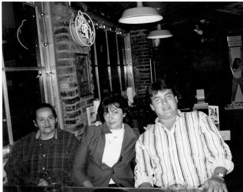
Aquí, con su mamá, quien actualmente vive en Tijuana, y Angel.