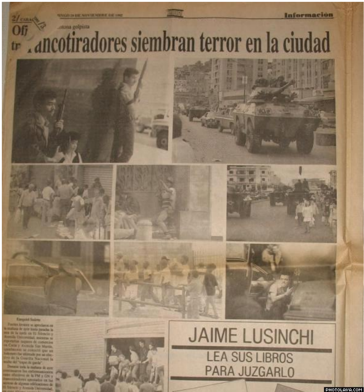
Página de un periódico de Caracas, un día después de la segunda intentona de noviembre de 1992.

aviación, y se fueron a esa plaza como una manera de protesta. Ahí estaban permanentemente y ahí iba la gente a oír lo que decían, que no estaban de acuerdo con Chávez.