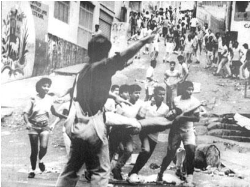
Imagen del “Caracazo”

Yo veía cómo se juntaba el gentío y se ponían como locos con lo que tuvieran y