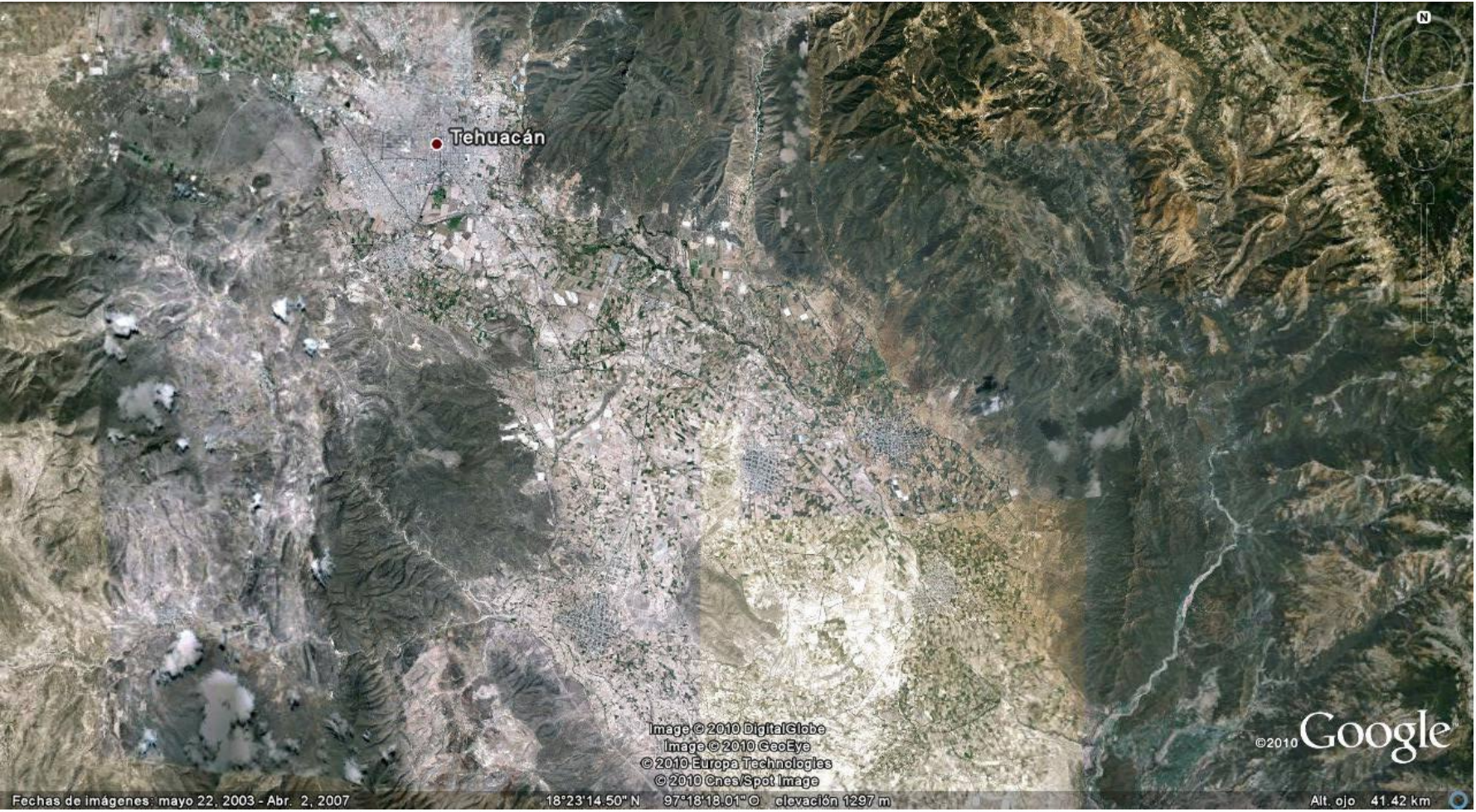
Figura 1.- Zona de estudio.