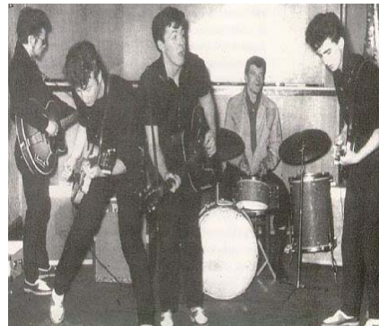
El grupo Quarrymen en audición para Parmes.

El único inconveniente era que sólo algunos cuantos serían elegidos; para tener referencia se les sacaba fotografías a los muchachos en las audiciones y servía para que Parmes dictaminara su decisión. Los Beatles fueron seleccionados aunque les dijeron que debían cambiar su nombre porque el que tenían no era muy bueno. Entonces pasaron a llamarse Long John and the Silver Beetles .