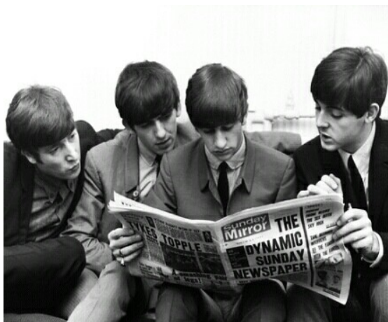
Los Beatles miran el periódico.

En Chicago el 11 de agosto de 1966, John Lennon dio una declaración acerca del tema: “Si hubiera dicho que la televisión era más popular que Jesucristo no habría pasado nada, pero utilicé la palabra Beatles como algo remoto y abstracto, como la gente nos ve. Dije que la influencia que teníamos sobre los