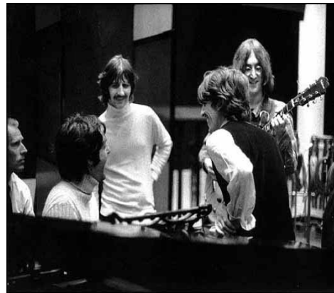
Los Beatles con George Martin.

El intento por Paul de volver a reunir el interés de sus compañeros en la banda hizo que les propusiera volver a los inicios del grupo y que grabaran un álbum directo con los cuatro juntos, como en los viejos tiempos y fue así como dio inicio su quinta película Let It Be , que no sólo mostró a los cuatro haciendo música sino también el desmoronamiento de la banda más exitosa de la década.