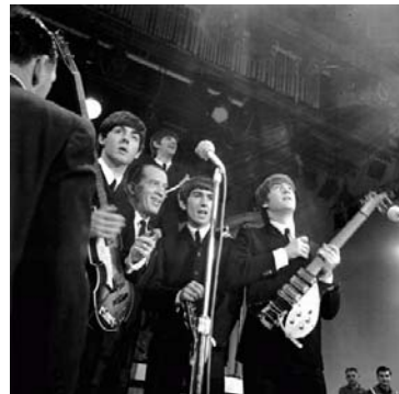
Los Beatles con Ed Sullivan. http://george-harrison.info/beatles/beatles_122.jpg

En su primera visita a los Estados Unidos no conocieron a Elvis Presley, pero la segunda vez que regresaron tuvieron una corta sesión la cual no fue grabada, pero los testigos dicen que el grupo y el Rey tocaron juntos por una hora aproximadamente. Las revistas Time , Life y Newsweek les dedicaron sus portadas.