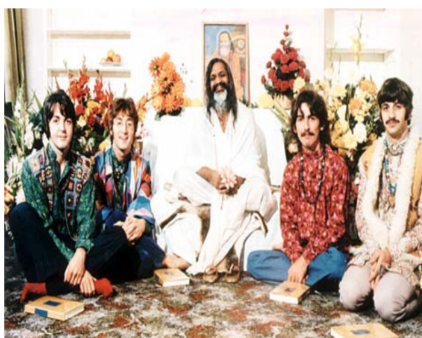
Los Beatles con el Maharishi Mahesh Yogui. http://img.dailymail.co.uk/i/pix/2008/02_01/YogiBeatlesBOOK0502_468x290.jpg

Los Beatles pasaron una temporada en Bangor en febrero de 1968, con varios artistas entre ellos Mia Farrow, actriz famosa en ese momento. El Maharishi Mahesh Yogui les enseñó a encontrar la paz interna, ese viaje les inspiró para componer nuevas melodías con temas profundos,