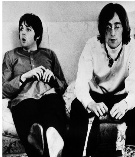
JohnLennon y Paul McCartney

Los cuatro de Liverpool no podían seguir unidos; en realidad todo había sido demasiado rápido, en menos de 10 años, ellos se habían hecho famosos, habían dado origen a los conciertos multitudinarios y el espectáculo así como la música de rock habían llegado a una cumbre en brazos de Los Beatles, habían experimentado etapas creativas, su evolución estuvo presente, ya que evitaron repetirse a sí mismos. “La muerte legal del grupo se dio un año después, en abril de 1971. Paul encabezó la visita a los tribunales ingleses. La lápida había sido puesta.” 65