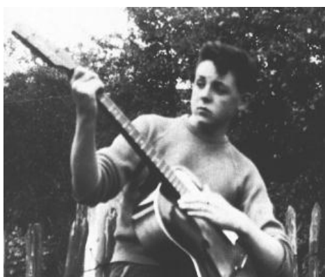
Paul McCartney

Cuando se encontraron frente a frente Paul tocó para John la canción Twenty Flight Rock de Eddie Cochran, otro exponente de la corriente musical del rock and roll, a lo que John también asombrado supo que a pesar de que Paul era menor, no podía dejarle ir sin pedirle se uniera a su banda; Paul aceptó al día siguiente.