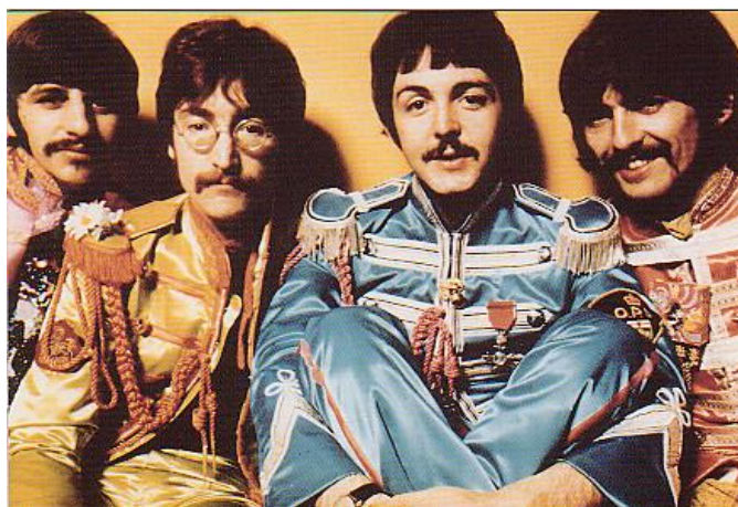
La imagen de Los Beatles en Sargento Pimienta. http://www.192.cl/blog/wp-content/uploads/2007/05/beatles1.jpg

Antes que el álbum saliera, los medios de comunicación, sobre todo los impresos, habían escrito en sus hojas el porqué Los Beatles habían desaparecido del escenario, de nuevo inferían que el final de la banda se daba,