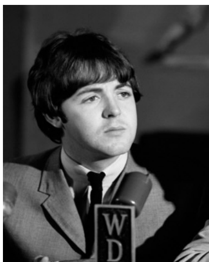
Paul McCartney. http://imageache.allposters.com/images/pic/FSTPOD/PM3-FB-Paul-McCartney-of-the-Beatles-Posters.jpg

La relación entre el grupo y la droga se hizo más grande después de que Paul, declarara en una entrevista, que algunas veces había consumido LSD. Sus compañeros John y George se sorprendieron ante las palabras de Paul, mientras que Ringo dijo que le había dado un motivo a la prensa para que los acribillaran, pues había aprendido que si alguno de ellos cometía un error el resto pagaba las consecuencias.