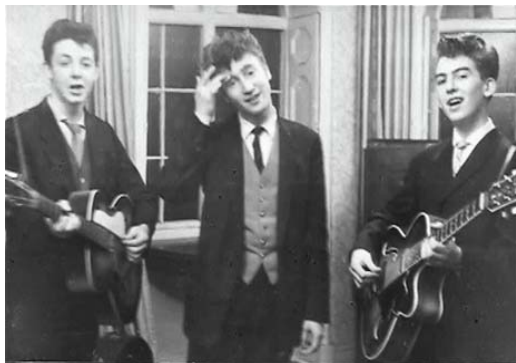
De izquierda a derecha; Paul, John y George.

Sus conocidos les decían con frecuencia que hacía falta una batería pues a pesar de que las tres guitarras que tocaban sonaban bien, si querían tener un