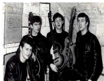
Los Beatles con Pete Best como baterista.

Esto era algo nuevo para mí, me asombré, el ambiente oscuro, húmedo, lleno de humo con la música beat sonando. Los Beatles eran cuatro muchachos en un escenario mal iluminado, con aspecto un tanto desaliñado. En mi opinión la puesta en escena dejaba mucho que desear, llevaba mucho tiempo interesado en el teatro y la actuación; pero encima de todo eso había algo especial. Su música me cautivó de inmediato; su ritmo y sentido del humor en el escenario. Cuando los conocí personalmente