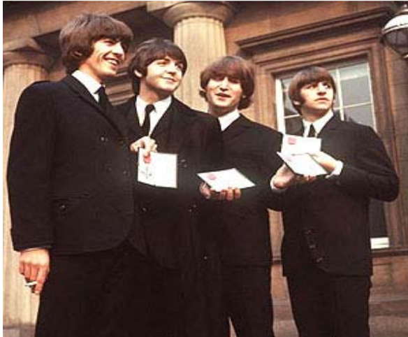
Los Beatles muestran sus medallas M. B. E.

su deseo de abandonar las giras y Lennon parecía haber subido de peso por lo que se dijo pasaba por una depresión. “Me dan estas depresiones cada ciertos años. Cuando estaba con Los Beatles no se notaba tanto, funcionábamos en grupo. Cuando salió Help! , estaba pasando por una depresión, pero no se notaba, para empezar estaba pidiendo socorro en la canción, pero estaba envuelto y protegido por la imagen y el poder de Los Beatles. John Lennon.” 54