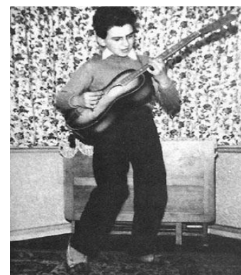
George Harrison.