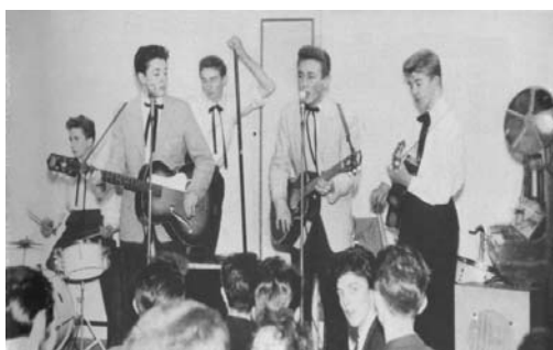
John Lennon, Paul McCartney y el grupo Quarrymen.

autobús de la mañana. Cuando llegó la Época del skiffle y ambos tuvieron guitarras, su amistad se estrechó. 23