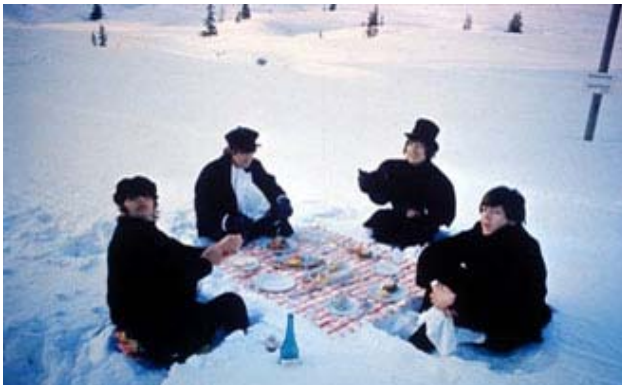
Los Beatles en el rodaje del filme Help! . http://www.thebeatles.com/core/films/

John Lennon había estado experimentando con sonidos nuevos para la composición musical de la banda, fue entonces que al golpear una cuerda de su guitarra Gibson mientras que se acercaba al amplificador provocó que se produjese un timbre extraño, nunca antes utilizado; posteriormente se añadió a la introducción de la canción I Feel Fine . El feedback acababa de ser descubierto a través de un accidente.