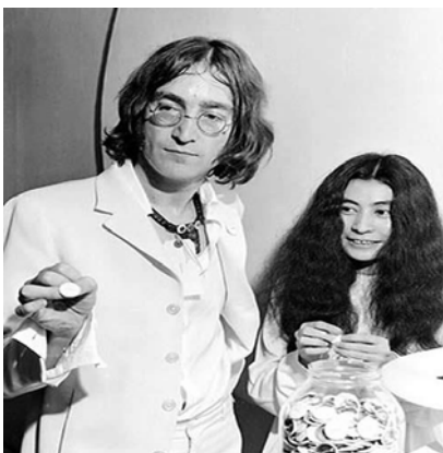
Yoko Ono y John Lennon.

En marzo dos bodas se dieron y así Paul, el único beatle que quedaba soltero, contrajo matrimonio con una estadounidense llamada Linda Eastman. Por su parte, John, se casó con Yoko Ono, una semana después de la boda de los McCartney. En mayo lanzaron al mercado el material Let It Be , el cual vendió más de dos millones de copias en 15 días; sin embargo el final estaba próximo a llegar.