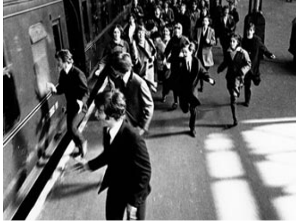
Escena de A Hard Day's Night . http://www.thebeatles.com/core/films/

Muñecos, ropa, artículos de uso cotidiano eran el fiel reflejo de la agrupación; entre discos y presentaciones el fenómeno aumentó a tal grado que para el 6 de julio de 1964, fue el estreno de su primera película, dirigida por Richard Lester; A Hard Day's Night , les abrió las puertas al séptimo arte.