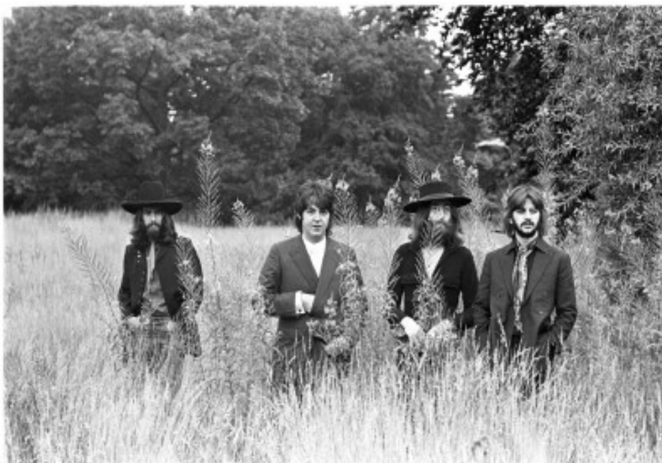
Los Beatles. http://espaciomusica.com/wp-content/uploads/beatles3.jpg

El fenómeno había crecido de una manera fugaz que cuando llegó el fin, personas de todo el mundo lloraron por la separación del grupo. En un principio Lennon, declaró que no había por qué estar tristes sino se había muerto nada importante; sin embargo la depresión en la vida de los integrantes apareció, tiempo después cada uno inició su carrera como solista, para dejar en un recuerdo su etapa como Beatles. “Me alegro de que muchas de las canciones trataran de amor, de paz, de entendimiento. Casi ninguna incita a los jóvenes a mandar a la mierda a sus padres. Todo era, lo que necesitas es amor o darle una oportunidad a la paz, había una gran voluntad detrás de todo eso. Paul McCartney.” 68