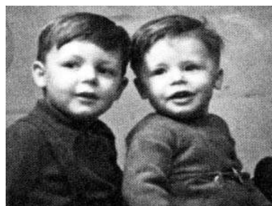
Paul y Michel McCartney.

Los padres de Paul a diferencia de los de sus dos compañeros mayores, no se separaron por motivos de inconformidad dentro del matrimonio, sino a causa del cáncer de seno que su madre padecía y que la llevó a la tumba cuando Paul