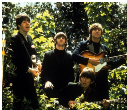
Los Beatles en sus primeras apariciones de promocionales. http://www.thebeatles.com/core/beatles/intro/

Una serie de acontecimientos vinieron en seguida y les hicieron ver a Los Beatles que ya no era divertido viajar por el mundo como ritmo laboral. Su viaje a Filipinas les causó problemas pues se habían ganado el repudio de la gente de ese lugar, porque supuestamente debían haber ido a un desayuno que la primera familia les había ofrecido; nadie avisó a los muchachos de esto por lo que nunca llegaron a la cita; al final Epstein tuvo que regresar el dinero del concierto para que los pudieran dejar salir de ahí.