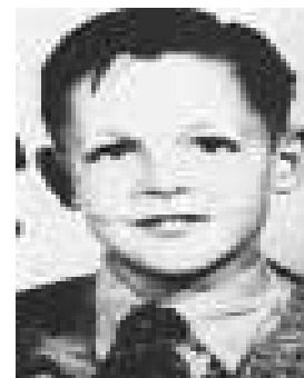
Paul McCartney.

McCartney y Harrison se conocieron porque eran compañeros en el Instituto de Educación de Liverpool. Sus casas quedaban muy cerca y cuando Paul subía al autobús de la escuela, en la siguiente parada lo hacía George, fue entonces que intercambiaron algunas palabras y comenzó una amistad. “Paul y yo, solíamos tocar juntos, éramos un par de niños. Estábamos muy interesados en el rock, veíamos cada película que ponían y escuchábamos los discos que llegaban desde Estados Unidos. George Harrison” 13