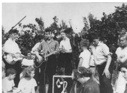
John Lennon y Los Quarrymen el 6 de julio de 1957. http://www.beatlesource.com/savage/1950s/57.07.06%20foto/1.jpg