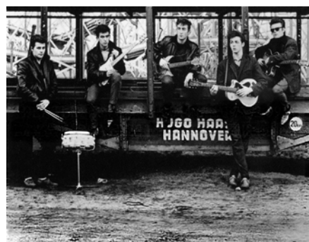
Los Beatles en su primer gira por Hamburgo. http://www.morethings.com/music/beatles/images/1960-beatles-hamburg_germany.jpg

A pesar de su prematuro regreso, los muchachos comenzaron a tener bastante trabajo en Liverpool, pues los anunciaban como si fueran alemanes y su imagen de chicos duros como los del grupo musical que se encontraba en boga The Shadows, les ayudó para promocionarse y adquirir seguidores.