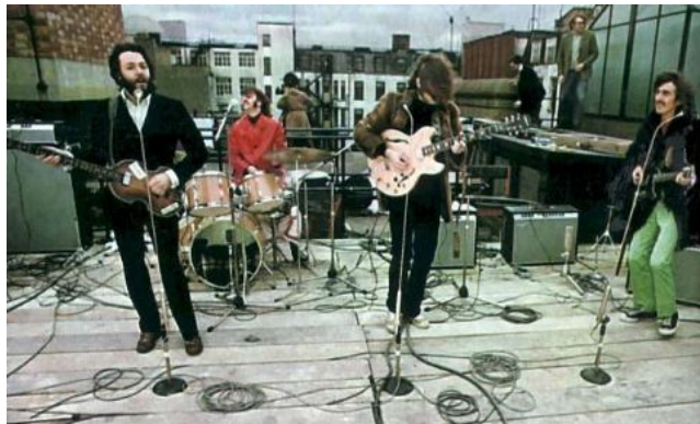
Los Beatles el 30 de enero de 1969. http://espaciomusica.com/wp-content/uploads/beatles2.jpg

El final que le dieron a la cinta fue el presentarse en la azotea del edificio de Apple en Abbey Road el 30 de enero de 1969. En cuanto sonaron los primeros acordes desde lo alto de aquel edificio, la gente comenzó a pararse en las banquetas para mirar hacia arriba. Sería la última vez que la banda tocaría unida.