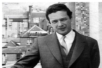
Brian Epstein, representante de Los Beatles. http://www.beatlesagain.com/images/brian1.jpg

Brian Epstein abrió una oficina y durante seis meses mando numerosos comunicados de prensa haciendo publicidad pero todos fueron ignorados. La prensa musical reseñó sus discos en cuanto aparecieron, que salió a la venta el 12 de enero. Alcanzó el número uno el 16 de febrero y escribieron muy bien de él, pero los periódicos nacionales siguieron ignorándolos. A pesar de que las publicaciones pop habían sacado algunas cosas de ellos, ningún periodista de los medios de difusión nacional se había interesado hasta ese momento –señala Tony Barrow-. Todo el asunto inició en octubre de 1963. 41