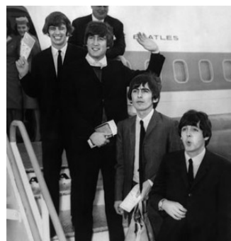
Los Beatles.