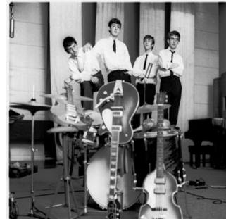
Los Beatles en el estudio de grabación.

Se encontraban en Francia cuando Brian Epstein les llamó por teléfono y les dio la noticia de que ya podían viajar a Estados Unidos, pues una de sus canciones ocupaba el número uno en las listas de popularidad. Así que para el 7 de febrero de 1964 Los Beatles se encontraban en medio de un huracán cuando aterrizaron en el Aeropuerto John F. Kennedy de Nueva York, con ello conseguían que ahora la beatlemania se reconociera a nivel mundial.