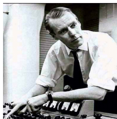
George Martin, productor discográfico de Los Beatles.

Brian les dio una nueva imagen, dejaron atrás la ropa de cuero y el aspecto de niños rudos. Las corbatas y los botines se hicieron presentes en su personalidad grupal.