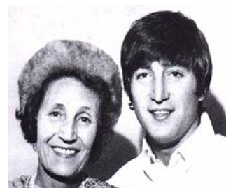
John Lennon y su tía Mimi.

Para entonces John, quien vivía con su tía Mimi, asistía a la escuela Quarry Bank en donde Mimi tenía la esperanza de que su loco sobrino encontrara la cordura y fuera por el buen camino de la vida, sin embargo Lennon apoyado por su joven