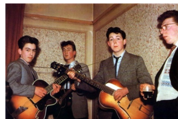
De izquierda a derecha: George Harrison, John Lennon y Paul McCartney.