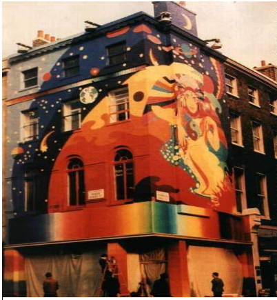
La tienda Apple. http://www.beatweb.com/fotos/album6/imagenes/20.jpg

muchacha del grupo, se dice que fue de Farrow, así que decepcionados dejaron el lugar y regresaron de lleno al estudio de grabación.