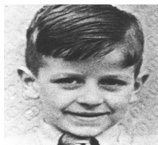
Ringo Starr.

Cuando Ringo se encontraba en sus primeros años de vida, el matrimonio Starkey se terminó. “Poco después de cumplir Ritchie los tres años, sus padres se separaron. No ha vuelto a ver a su padre excepto en tres ocasiones desde entonces. Parece que el asunto se acordó serenamente.” 2