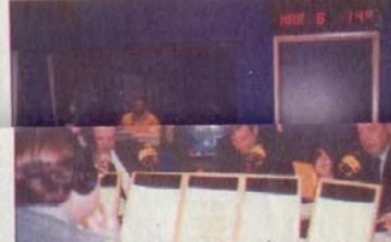
EN EL 2000 • Debate en MONITOR de José Gutiérrez Vivó y entonces aspirantes a la jefatura de Gobierno del Distrito Federal.