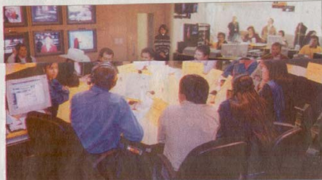
AL AIRE • Mesa Especial de Grupos Indígenas de México, por la que MONITOR ganó el Premio Nacional de Periodismo 2001.