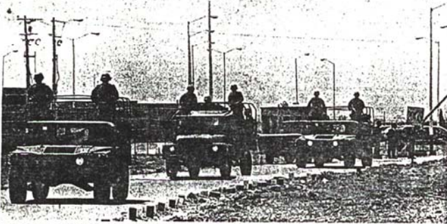
Vigilancia militar en el penal de Almoloya.