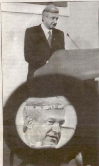
El jefe de Gobierno del Distrito Federal, Andrés Manuel López Obrador, dijo en conferencia de prensa que en su mandato decir "caiga quien caiga no es un estribillo"

■ "En el embate también están Salinas y la derecha"