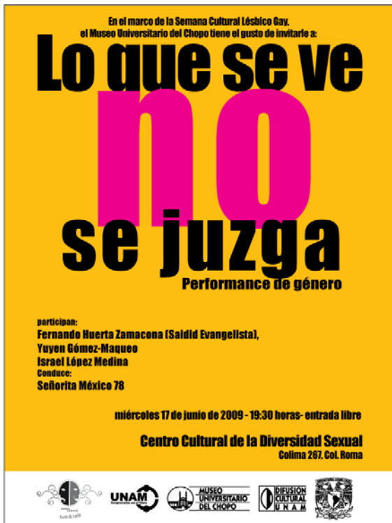
Afiche de la Semana Lésbica Gay 2009