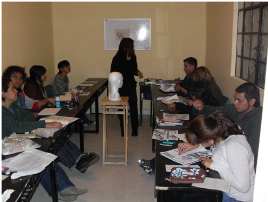
De los Talleres Libres del Chopo