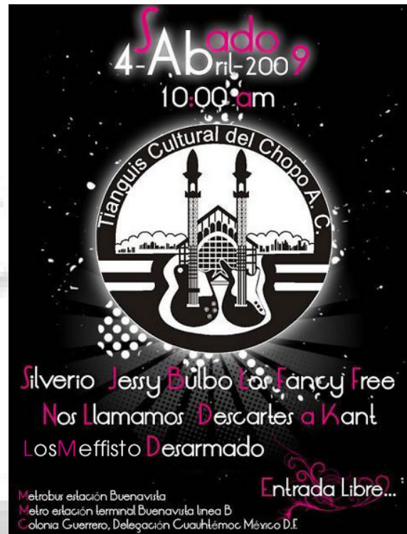
Afiche Concierto en el Tianguis 2009