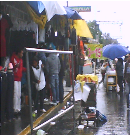
Fotografía actual del mercado de Tepito.

los comerciantes a guardar sus pertenencias en caso de que la policía entre a catear las casas.