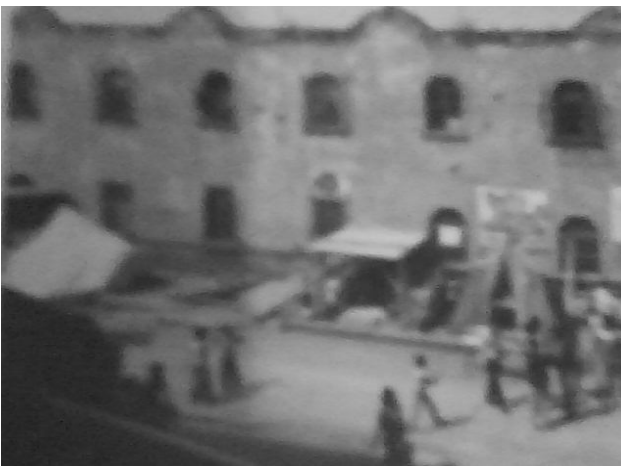
Tepito en el año de 1980.

En 1970 Tepito ya era considerado como un barrio popular por la compra-venta de artículos de contrabando. En este mercado se puede encontrar toda clase de objetos desde zapatos, ropa, celulares, droga hasta películas pornográficas. Todos los puestos se ubican desde las afueras del metro Tepito hasta llegar a la Lagunilla.