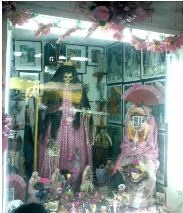
La Santa Muerte, en la capilla de Tepito.