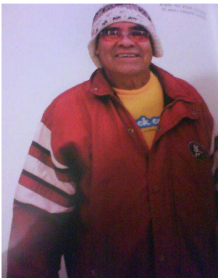
Rubén Olivares “El Púas”, ex campeón mundial.

Tepito también es conocido por los boxeadores que han emergido en ese barrio, los más famosos son: Raúl “El Ratón Macías”, el Kid Azteca y Rubén Olivares “El Púas”. En este lugar se preparan desde niños hasta adolescentes que quieran trabajar en este oficio. También cuenta con grandes equipos de fútbol como: Los Toltecas, Aztecas, Granada, Casa Blanca y el Antirrábico.