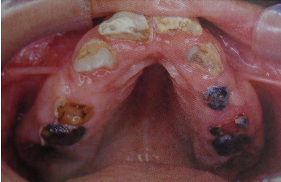
Figura 14. Hiperplasia gingival provocada por anticonvulsivantes. 60

Los principales factores en la enfermedad gingival modificada por malnutrición, es la respuesta inmune inadecuada en el huésped, aunado a la carencia grave de vitamina C. 59