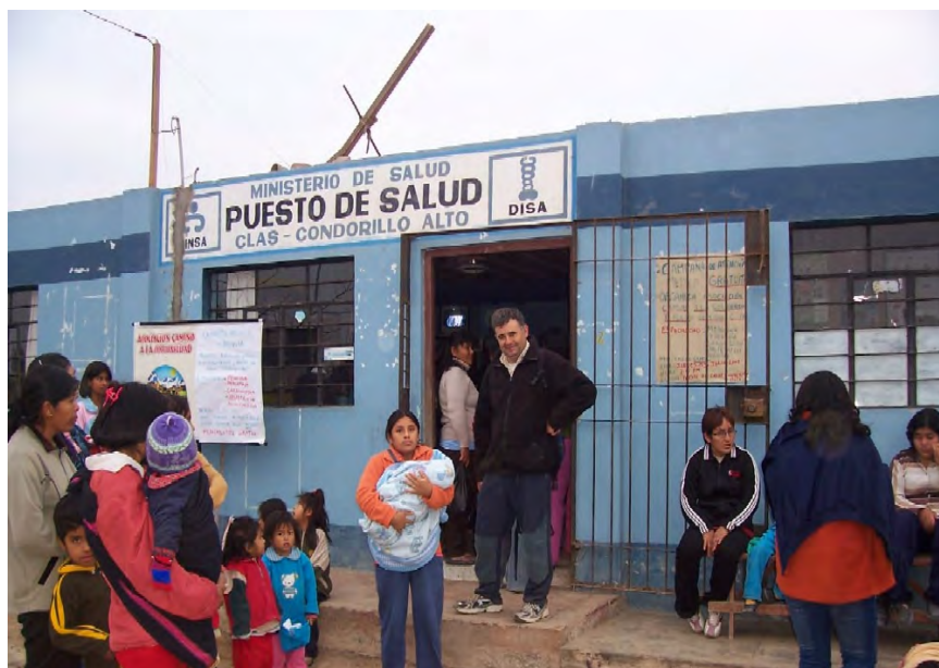
Figura 1. Servicios de salud en comunidades con baja condición socioeconómica. 11