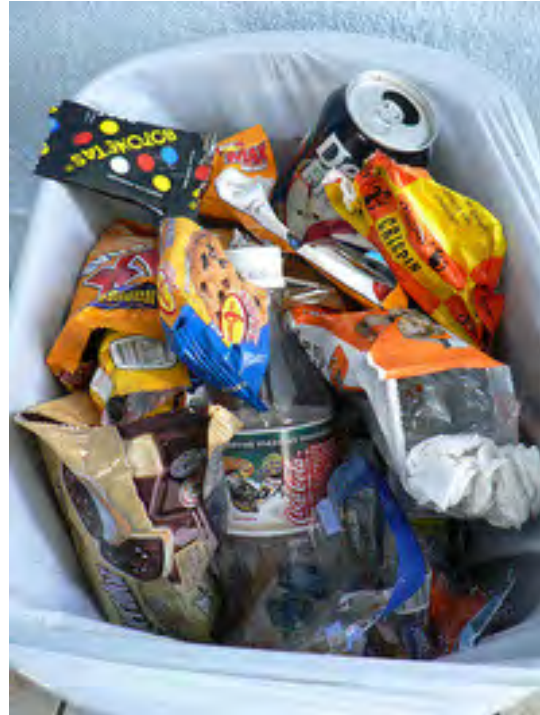
Figura 4. Alimentos con alto contenido de carbohidratos. 24

contenidos de sacarosa, productos con edulcorantes o sustitutos de azúcar, alimentos ricos en almidones combinados con sacarosa y envasados. 23 (Figura 4)