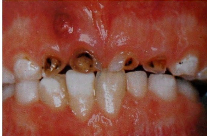
Figura 10. Caries de cuarto grado. 44