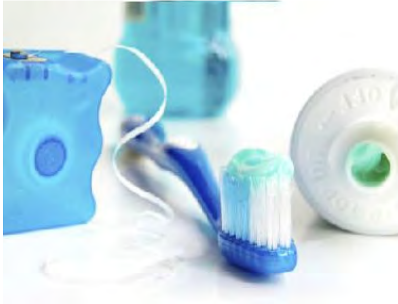
Figura 3. Diferentes instrumentos para una adecuada higiene bucal. 22