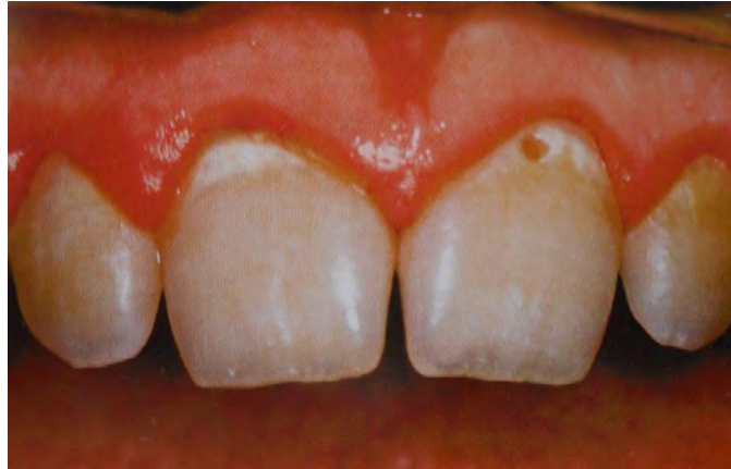
Figura 7. Caries de primer grado. 38

siendo cada vez de mayor tamaño, hasta convertirse en una lesión cavitaria en esmalte. 36 37 (Figura 7)