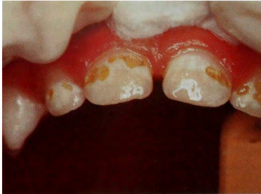
Figura 8. Caries de segundo grado. 40

La dentina y pulpa son tejidos vitales íntimamente interconectados, y constituyen una unidad biológica capaz de reaccionar frente a una agresión, de tal manera, que responde al ataque de caries antes de que se produzca una cavitación en el esmalte, por medio de reacciones de defensa que consisten en el depósito mineral sobre la luz de los túbulos dentinarios (dentina intratubular e intertubular) y a través de la formación de una capa de dentina reparadora o terciaria en la interface entre la dentina y la pulpa, la cual está limitada al área subyacente de la lesión de caries. 41 (Figura 9)