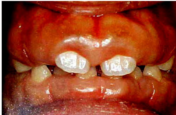
Figura 17. Fibromatosis gingival hereditaria. 65

Las lesiones traumáticas se ocasionan por daños químicos cuando la mucosa está en contacto con determinadas sustancias, provocando la aparición de una película blanquecina alternando con zonas eritematosas, que llegan a ocasionar gran sintomatología, en niños estas quemaduras se producen por la ingestión de cáusticos de forma accidental, por fármacos como el ácido acetilsalicílico que al colocarse en la mucosa produce necrosis, materiales de uso dental como dentífricos y colutorios que llegan a causar estomatitis alérgica. 64