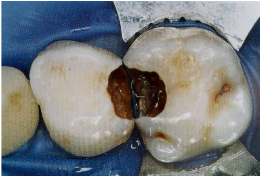
Figura 9. Formación de dentina esclerótica. 42

Si fallan estos mecanismos de defensa se produce la inflamación del tejido pulpar (pulpitis aguda), por la invasión masiva de microorganismos, lo que se considera un tercer grado de caries, finalmente llega a un cuarto grado, donde se presenta necrosis del tejido pulpar. 43 (Figura 10)