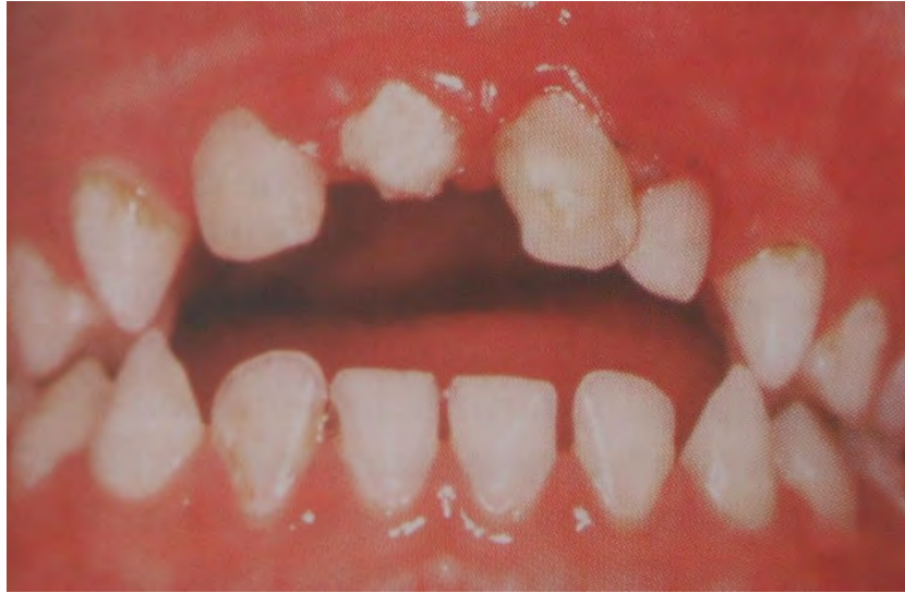
Figura 13. Gingivitis asociada a la respiración bucal. 57

La enfermedad gingival modificada por medicamentos se asocia a la ingesta terapéutica de antiepilépticos (fenitoína, hidantoína), inmunosupresores (ciclosporina A) y antagonistas del calcio (nifedipino, valproato sódico), siendo los anticonvulsivantes los que con más frecuencia pueden causar esta alteración en niños, el agrandamiento gingival suele comenzar después de 3 meses de medicación, y alcanza su intensidad máxima entre los 12-18 meses de tratamiento, se localiza inicialmente en papilas de la región anterior extendiéndose al margen gingival, aunque los patrones de hiperplasia varían en un mismo individuo y entre distintos pacientes. 58 (Figura 14)