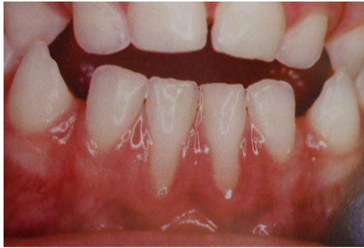
Figura 22. Retracción gingival provocada por el posicionamiento incorrecto del chupón. 76