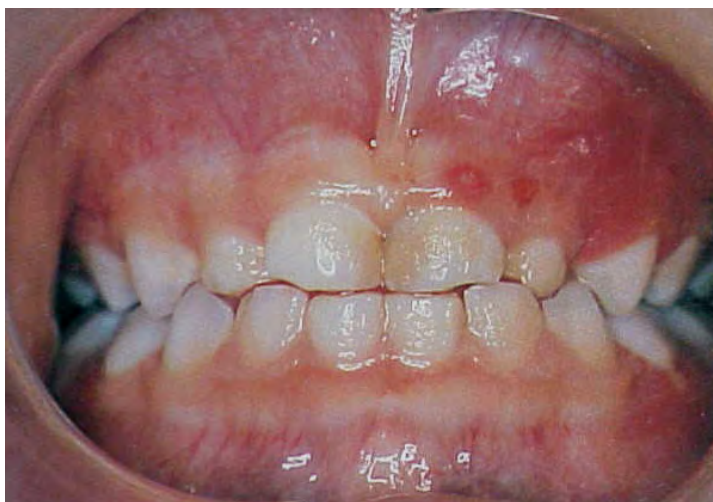
Figura 15. Lesiones gingivales producidas por Varicela Zoster 62