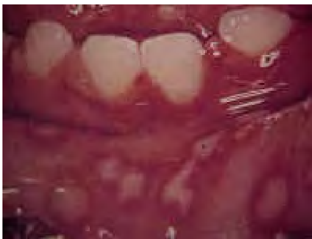
Figura 16. Estomatitis herpética. 63