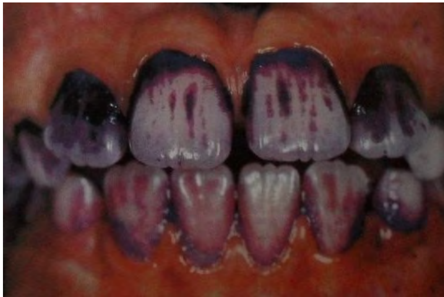
Figura 11. Tinción de placa dentobacteriana. 53

La Academia Americana de Periodoncia en 1999 realizó la clasificación actual de la enfermedad periodontal, que la divide en: enfermedades gingivales (afecciones localizadas en la encía, inducidas por placa dentobacteriana o inicialmente no asociadas a la misma) (Figura 11), periodontitis crónica, periodontitis agresiva, periodontitis como manifestaciones de enfermedad sistémica, enfermedad periodontal necrotizante, absceso periodontal, periodontitis asociada a lesiones endodónticas y condiciones o deformidades del desarrollo adquiridas de los tejidos periodontales, en las que además existe pérdida de la inserción y hueso alveolar. 52