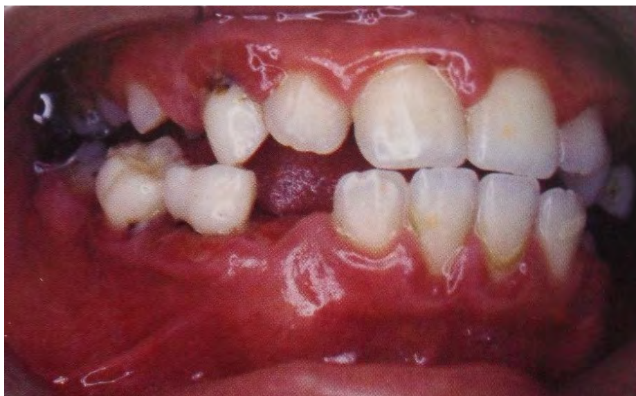
Figura 21. Enfermedad periodontal necrotizante. 74

Las deformaciones mucogingivales del desarrollo o adquiridas en el paciente infantil, con mayor frecuencia son las recesiones o migraciones apicales del margen gingival, su localización a menudo es en la cara vestibular de incisivos inferiores provocadas por factores como: anatomía dental, aparatos y restauraciones mal ajustadas, trauma oclusal, técnicas de higiene oral inadecuadas, acumulación de la placa dentobacteriana o inserción alta de frenillos. 75 (Figura 22)