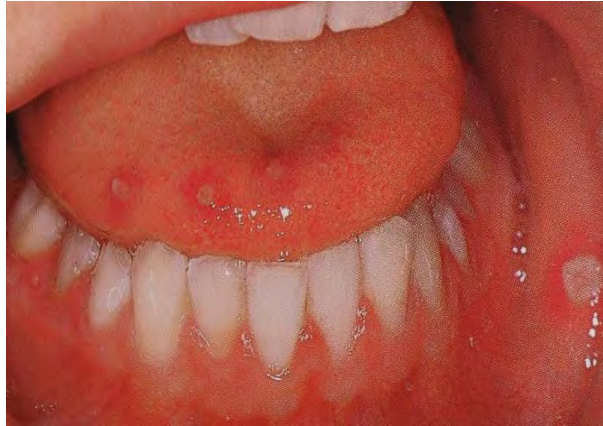
Figura 18. Estomatitis aftosa. 66

Las lesiones térmicas, se producen por la ingesta de alimentos o bebidas a demasiada temperatura, provocando quemaduras leves que presentan ligero eritema o graves con desprendimiento del epitelio, dejando al descubierto una zona eritematosa e hipersensible, además pueden producirse quemaduras eléctricas sobre todo en niños, cuando llevan a la boca un cable con carga eléctrica, lo que produce la destrucción y necrosis de los tejidos, observándose un tejido carbonizado pardo-negruzco con úlceras de profundidad variable. 67