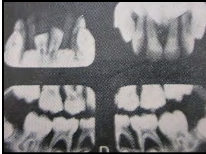
Figura 20. Radiografías de paciente con periodontitis por neutropenia. 72

En la enfermedad periodontal necrotizante, el factor fundamental que predispone a los niños es la inmunosupresión por estrés emocional y ansiedad, malnutrición y/o infecciones virales, asociada a higiene bucal deficiente, se caracteriza por la presencia de necrosis gingival, papilas decapitadas, sangrado, ulceración pseudomembranosa asociada a dolor gingival agudo y frecuentemente halitosis; se divide en gingivitis úlcernecrotizante (GUN), que se limita al tejido gingival y periodontitis úlcernecrotizante (PUN), cuando se presenta necrosis de la encía, ligamento periodontal y hueso alveolar. 73 (Figura 21)