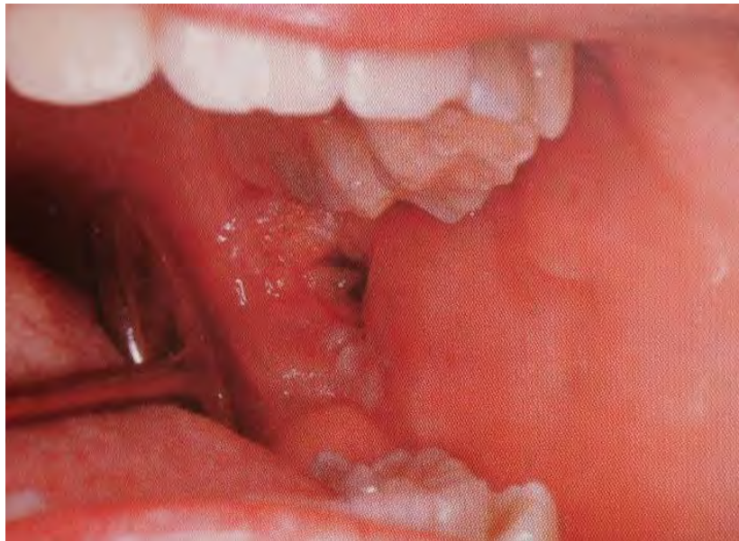
Figura 19. Lesión por mordedura. 69

Los daños físicos o mecánicos se producen principalmente por mordeduras accidentales o como consecuencia de un hábito, roce de aparatos, algún diente fracturado, uso inadecuado del cepillo o al succionar como ocurre en el caso de la úlcera de Riga-Fede, originándose en la mucosa de la cavidad bucal úlceras traumáticas, las cuáles presentan bordes eritematosos y son muy dolorosas. 68 (Figura 19)