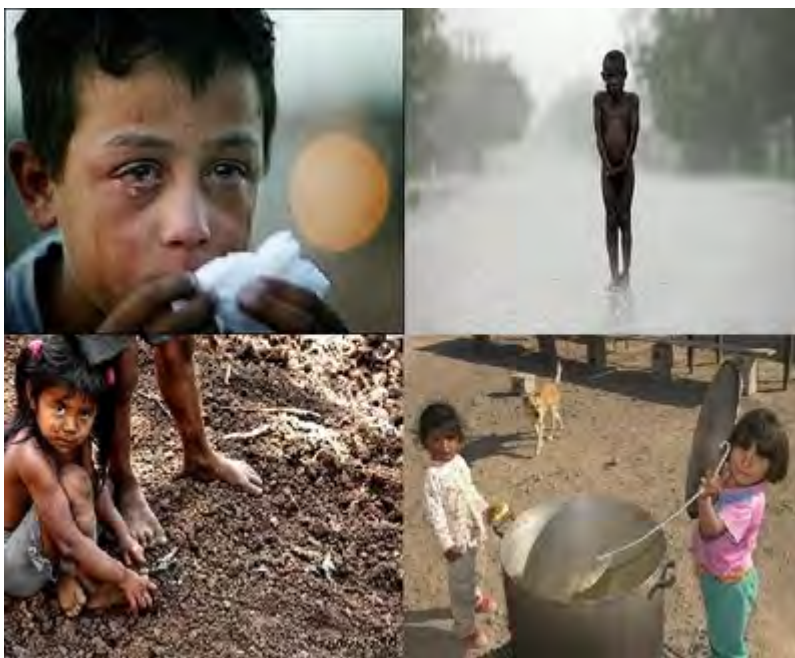
Figura 5. Malnutrición infantil 25

La malnutrición coincide con un aumento en la incidencia de caries dental en etapas tempranas del niño, por el consumo de alimentos altamente cariogénicos, en casos graves se asocia a disturbios permanentes en la función de las glándulas salivales y estructura dentaria, además de un desarrollo dental retardado. 26