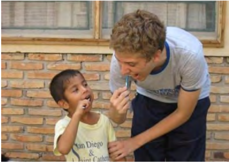
Figura 2. Transmisión de conductas y hábitos de higiene. 19

En países en vías desarrollo, el cepillo y la pasta dental son componentes normales de las prácticas de higiene en todos los niveles socioeconómicos, sin embargo, el estatus bajo de las familias favorece condiciones de higiene bucal deficientes, debido a las limitaciones y el uso infrecuente de los instrumentos adecuados para el cuidado dental, además los niños reciben significativamente menos instrucciones de higiene bucal por parte del dentista, por lo tanto, tienen mayores necesidades, en contraste con niños de mejor posición socioeconómica quienes no solamente utilizan servicios de salud privados, sino que también poseen mejor nivel de higiene bucal, puesto que por lo general el cepillado se realiza en los niños antes de cumplir el año. 20, 21 (Figura 3)