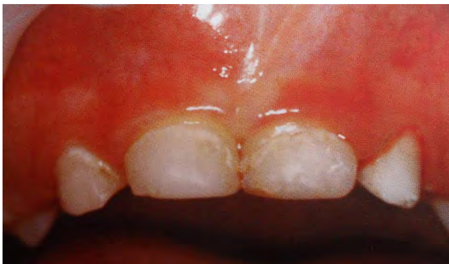
Figura 12. Gingivitis en la primera dentición. 55

Las enfermedades gingivales inducidas por placa con o sin otros factores locales asociados como: caries, malposición dental, respiración bucal, erupción y/o aparatología ortodóncica, son las más comunes en niños y se caracterizan por la presencia de inflamación sin pérdida de inserción o de hueso alveolar, en la primera dentición comienza con una inflamación del margen gingival que avanza en ocasiones hasta la encía insertada, que sino es atendida se agrava y el tejido gingival enrojece, aumenta la inflamación y la encía sangra fácilmente. 54 (Figura 12 y 13)