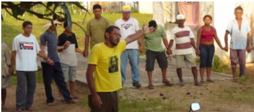
Mística. Campamento Novo Canudos. MLV