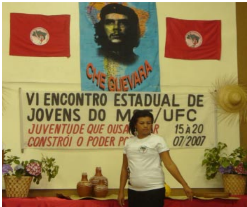
Curso de Pedagogia. MLV

Dentro del MST un factor muy importante es la educación. El MST ha logrado ser el protagonista de un nuevo proyecto educativo y está consciente que no se puede educar con la misma estructura de la escuela tradicional. Para el Movimiento la formación política está a cargo del Sector de Educación, que se ocupa desde el qué y hasta el cómo enseñar, esto es, el contenido y la forma de la educación. El Sector ha construido una pedagogía de y para el Movimiento, además, se ha desarrollado una práctica educativa en todos los niveles.