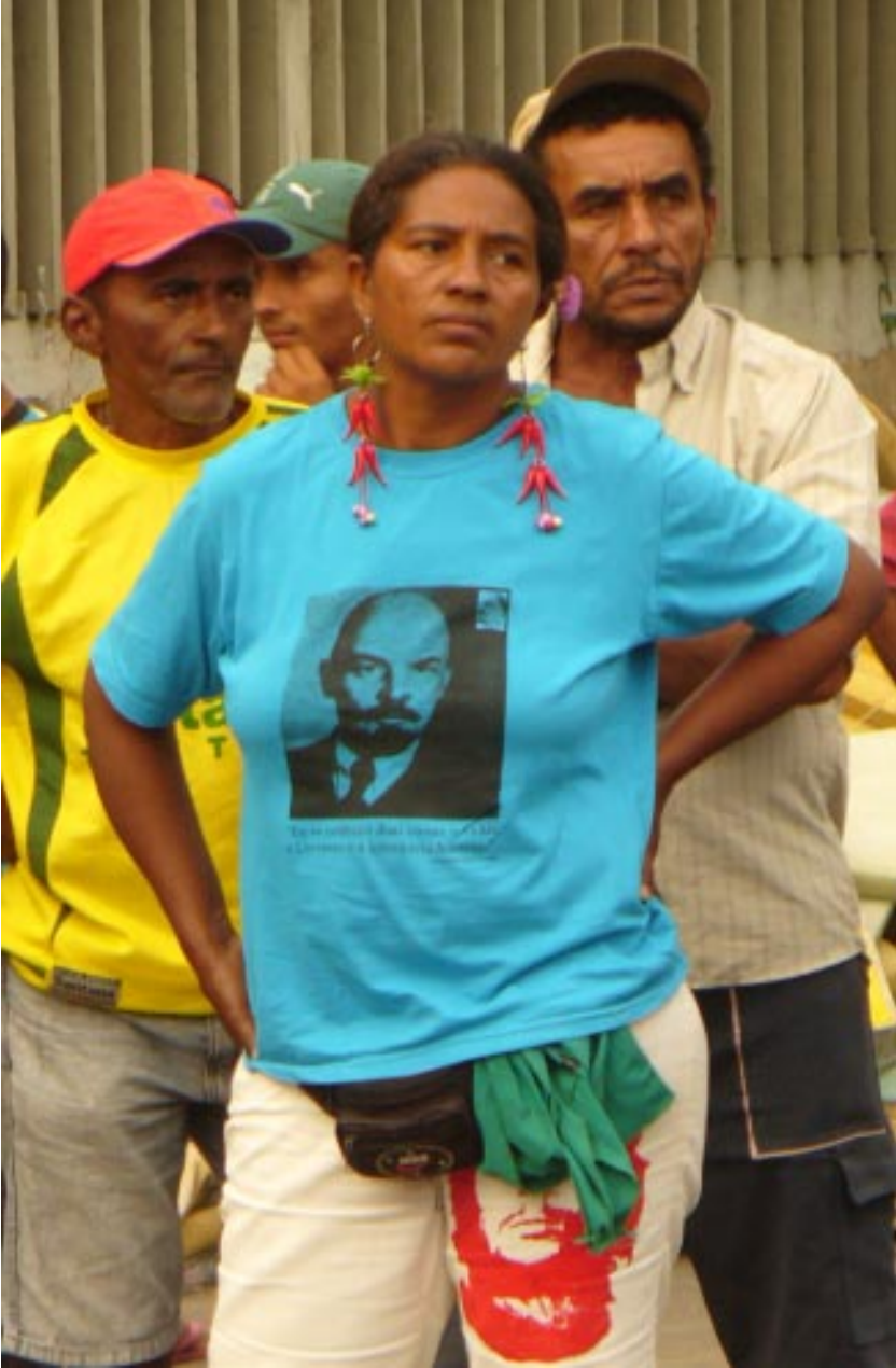
Militante del MST en la toma del INCRA MLV