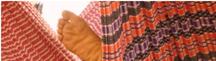
Campamento Novo Canudos

El concepto de campesinado en algunas ocasiones cuenta con una intencionalidad política que incorpora el papel del campesinado en una transformación social. Consideramos que conceptualmente se requiere un reconocimiento desapasionado del peso y funciones de este sector social para realizar una mejor investigación.