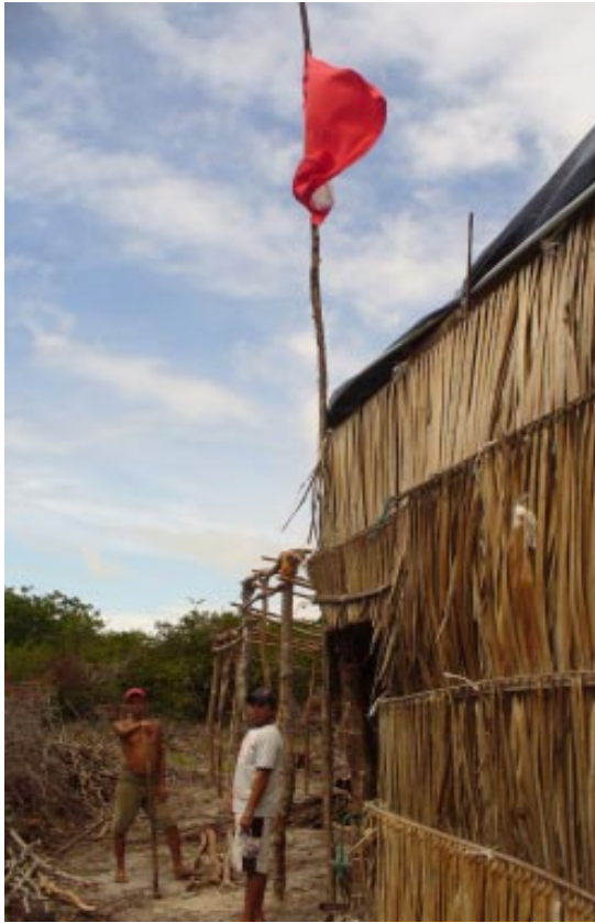
Campamento en Paracurú. MLV

La ocupación, los campamentos y los asentamientos no están exentos de dificultades. Para que éstos sobrevivan necesitan que las comisiones funcionen y que la instancia principal de discusión: la asamblea, resuelva las problemáticas para tomar las mejores decisiones para la colectividad. Sin embargo, el MST ha podido crecer e incrementar tanto las ocupaciones como los asentamientos.