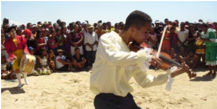
Asentamiento Maceió. MLV

La educación de los sin tierra se inscribe en el Movimiento de lucha social y de acción colectiva. Dentro de la memoria histórica, el MST incorpora la presencia de las luchas de Brasil, alentando su identidad. El proyecto político, la formación ideológica y la educación cuentan con una compañera fundamental para su reproducción: la mística.