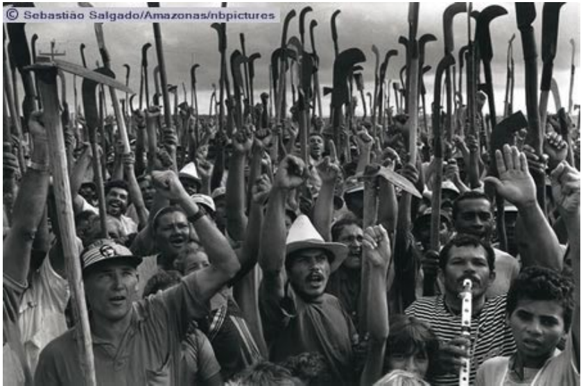
Sebastião Salgado. Lucha de los Sin Tierra

tierra lo que puede durar meses o años, posteriormente erigen la bandera del movimiento y realizan la primera asamblea. La vida de los sin tierra , implica penurias ya que muchas veces pasan hambre o escases tanto de alimentos como de insumos cotidianos y viven sin servicios. En los campamentos los sin tierra se encuentran en la incertidumbre constante de que los propietarios y los latifundistas contraten mercenarios que los obliguen a desalojar la tierra o les destruyan lo que han construido, desde las escuelas itinerantes hasta los sembradíos.