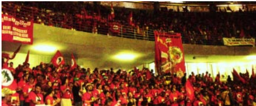
V Congreso del MST, 2007. MLV

Es necesario destacar que dentro de las políticas que más afectaron al campesinado fueron las concernientes al agronegocio.