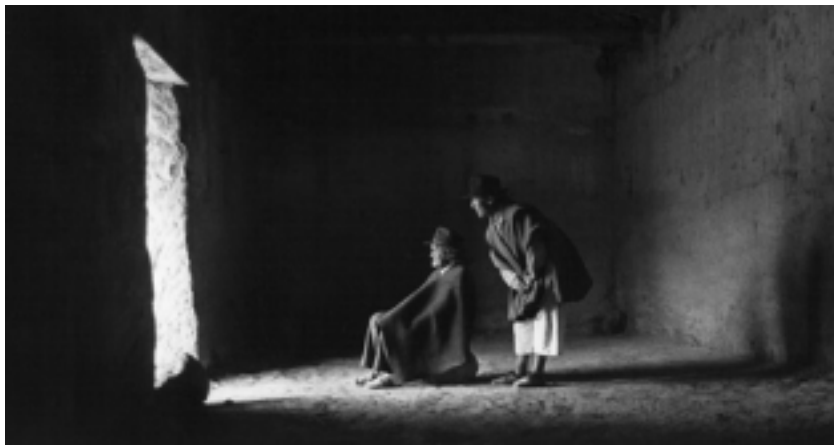
Flor Garduño. Witnesses of Time

A la izquierda, como fuerzas con su propia agenda política y cultural autónoma el gobierno enfrenta la presión de la inconformidad del Movimiento de los Trabajadores Rurales Sin Tierra (MST) y de las grandes asociaciones de base de trabajadores y políticos que pertenecen a organizaciones sociales populares independientes y participativas que critican el sistema político presidencialista y autoritario oligárquico, la manutención del capitalismo dependiente, la persistencia de un grado fuerte de subordinación nacional a las políticas de Estados Unidos de Norteamérica, la lentitud e insuficiencia de la reforma agraria legitimada por la Constitución de 1988 y la criminalización regional de los movimientos sociales. (Oliver; 2009,27)