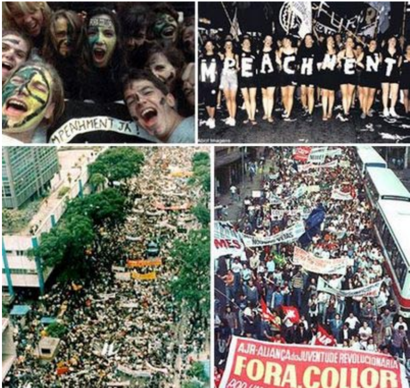
Caras pintadas fora Collor

Con el gobierno de Cardoso de 1994 a 1996 Brasil entró en una etapa marcada por la globalización financiera y productiva. Nuevas formas de acumulación de capital se vincularon a las principales empresas estatales y privadas; se desnacionalizaron los sectores estratégicos, es decir, se realizaron concesiones de servicio público a la iniciativa privada trasnacional como electricidad y carreteras. Hubo una agudización de la concentración de la propiedad de la tierra lo que constituyó un fuerte golpe para la pequeña y mediana agricultura. Por medio de la compra de acciones de empresas que actuaban en la agricultura se conformaron neo-oligopolios en los diversos ramos de la producción. Esto reforzó el llamado agronegocio moderno, esto es una alianza entre los grandes propietarios de la tierra, los hacendados capitalistas y las empresas trasnacionales. En el gobierno de Cardoso se modificó la Constitución para habilitar la reelección presidencial, por lo que se presentó a las elecciones presidenciales en 1998, las cuales ganó, realizando un segundo mandato.