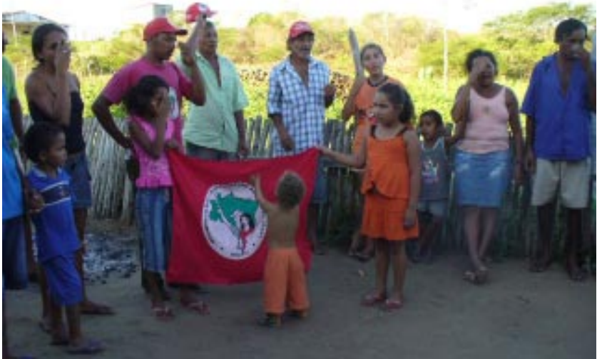
Campamento Novo Canudos 2.

El estudio en este apartado se centra en la caracterización política-ideológica del MST, además de las diferencias y similitudes con otros movimientos sociales y organizaciones políticas y culturales. Con esto, podemos tener una primera aproximación a las limitantes y los retos que tiene el Movimiento para la consecución de sus objetivos.