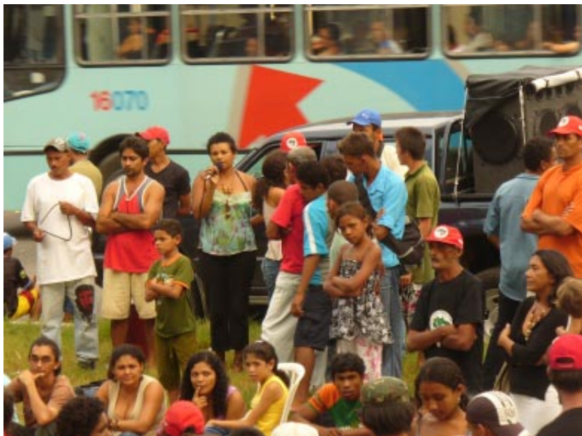
Toma del INCRA por el MST, Ceára. MLV

El Movimiento de los Trabajadores Rurales Sin Tierra ha desarrollado a lo largo del tiempo un proyecto político-ideológico, que ha impulsado de diversas formas, -ocupaciones de tierras y de organismos públicos, caminatas, foros- de acuerdo a diversos factores y coyunturas políticas.