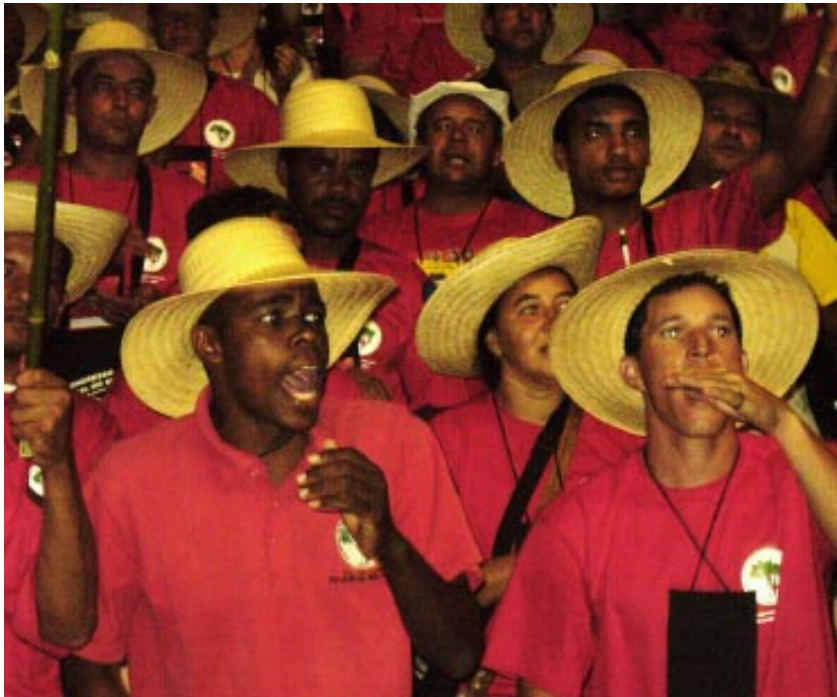
V Congreso del MST, 2007. MLV