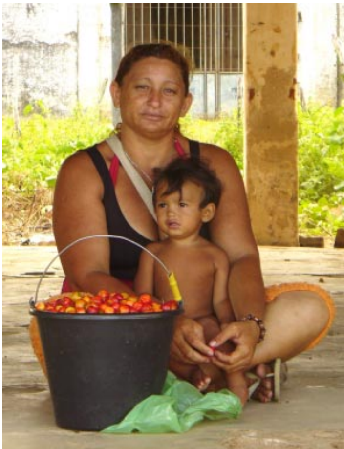
Campamento Novo Canudos. MLV

Por outro lado, deverá haver um novo nível de colaboração e complementariedade, entre os governos federal, estadual e municipal.