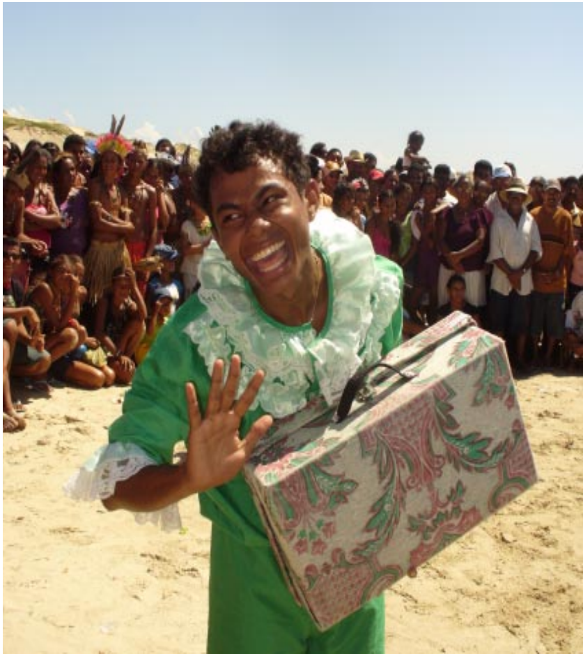
Mística. Asentamiento Maceió. MLV

Un elemento importante es el carácter cultural de la lucha del MST. En el año de 1998, se conformó el Colectivo de Cultura del Movimiento. Esto fue producto de las discusiones y debates sobre la importancia de la cultura