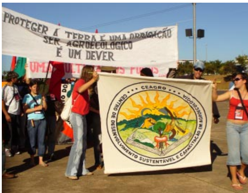
V Congreso del MST, 2007. MLV

En 2003, I año del gobierno de Luiz Inazio Lula da Silva, el agronegocio fue el responsable del mayor superávit comercial en la historia del país. Con 30 mil millones de dólares exportados, el negocio agropecuario es responsable del 42% de las exportaciones brasileñas. El llamado "complejo soja" lidera este proceso con el 25% de las exportaciones del sector; las exportaciones sojeras crecieron en un año un espectacular 35%. El alza de los precios internacionales y la tracción de mercados importantes, sobre todo China, explican en gran medida este suceso. Pero la exportación de productos agropecuarios por el agronegocio obliga a la importación de otros productos, tanto para el consumo popular como para uso industrial. Así, Brasil exporta algodón pero a su vez debe importar algodón para abastecer la industria nacional, en tanto está importando alimentos básicos como arroz, frijoles, maíz, trigo y leche. 142