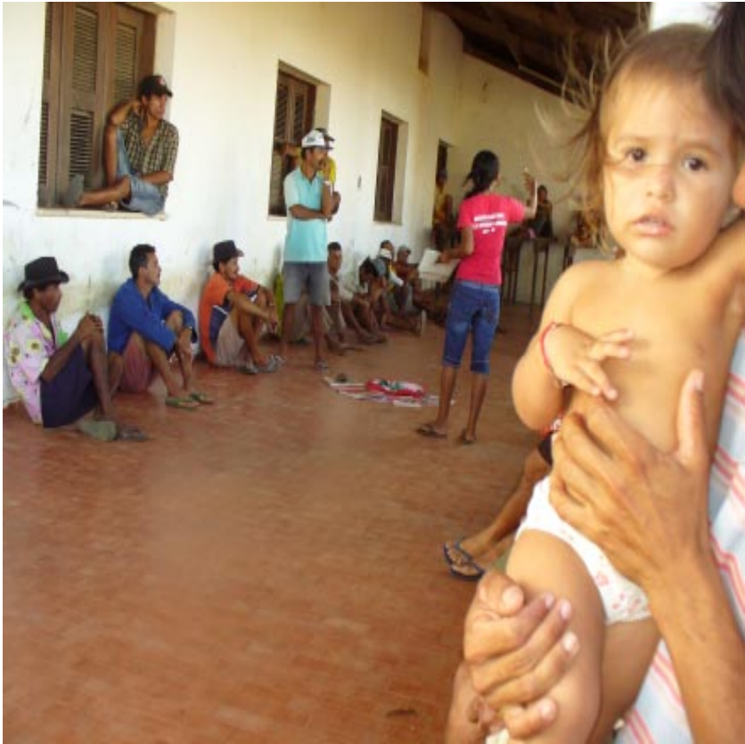
Asamblea campamento Novo Canudos. MLV