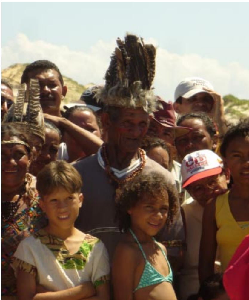
Acto político-cultural Asentamiento Maceió. MLV

♦ Desarrollar la lucha de masas ya que ella puede ir aglutinando formas orgánicas de acumulación de fuerzas en torno al proyecto (MST; 2001 a : 26) 189