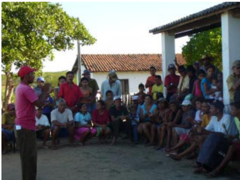
Campamento Novo Canudos 2.

El Movimiento ha constituido y ha impulsado un Proyecto Popular para Brasil (PPB), y además, ha promovido una voluntad-nacional para el avance del mismo. Entre sus propuestas, que van mucho más allá del acceso a la tierra, el MST plantea la consolidación de: "Un proyecto popular para la agricultura brasileña".