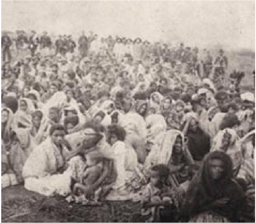
Fotografía de Canudos