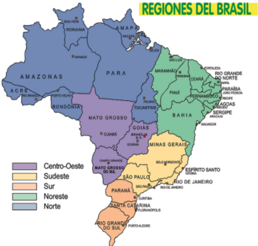
Mapa con las regiones de Brasil

Sin embargo, consideramos que la investigación realizada posibilitó un primer acercamiento al estudio de la hegemonía y el Estado ampliado, que, a nuestro juicio, brinda herramientas certeras para entender y transformar a Nuestra América.