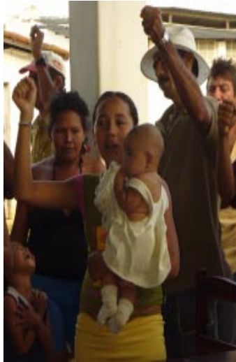
Campamento Novo Canudos. MLV

Es importante ubicar al MST dentro de las fuerzas políticas existentes con el fin de observar sus particularidades políticas culturales, su desarrollo, sus estructuras y sus prácticas cotidianas. Esto nos ayudará a valorar si el MST cuenta con posibilidades de conformar una fuerza alternativa, que pueda contrarrestar la hegemonía existente. El próximo capítulo, se centrará en analizar la práctica política cotidiana del Movimiento.