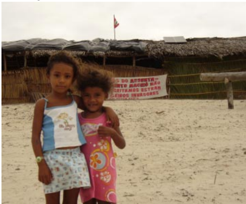
Asentamiento Maceió. MLV

te el Sector de Educación, de Producción, de Finanzas, de Proyectos, de Comunicación, de Relaciones Internacionales, de Género, de Derechos Humanos, etc. para organizar las tareas y las acciones en cada estado, respetando las orientaciones nacionales además de las particularidades de cada región y para desempeñar el trabajo que el Movimiento considera necesario. El "Frente de Masas" se puede considerar como la columna vertebral del Movimiento, él es responsable del conjunto de acciones necesarias para la ocupación. Realiza labores de logística, información y organización de base para aglutinar a familias que estén interesadas en luchar por la tierra, hasta las manifestaciones, ocupaciones y negociaciones con el gobierno.