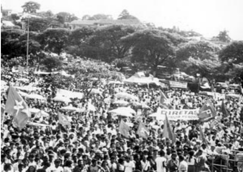
Ato pelas diretas Já, no Pacaembu SP

las organizaciones político-populares existentes en el periodo de transición democrática eran el Partido Democrático Social, el Partido do Movimento Democrático Brasileiro 26 (PMDB), el Partido do Povo 27 (PP) el Partido dos Trabalhadores 28 (PT) y el Partido Democrático Trabalhista 29 (PDT). El final de la dictadura representaba la posibilidad de una re-incorporación política de las organizaciones y sectores políticos que anteriormente fueron reprimidos, aniquilados, perseguidos, cesados e ilegalizados. Otras organizaciones fueron desmembradas y sus integrantes fueron perseguidos y torturados.