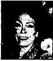
Quisiera poner las críticas sobre la primera dama atizapense