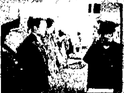
Ha promovido el reconciliatorio a los buenos del municipio de San Juan.