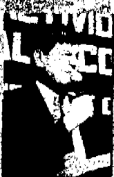
El Diputado Municipal, Francisco Barrios, en un momento de su informe.