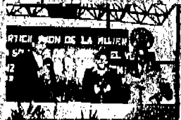
El Diputado marcó una etapa a las mujeres.