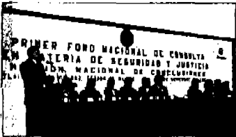
Se comprometieron a impulsar reformas los gobernadores de los Foros de Seguridad Pública que se llevaron a cabo en Toluca y cuyos resultados se verán pronto en el periódico.

◆ Estado de México, Sonora y Jalisco dictan Conclusiones del Foro Nacional en Materia de Seguridad y Justicia