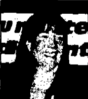
Se aprovecha del juego mediático para beneficio propio

la Colorada, regresó al PRI y se puso a disposición del candidato Enrique Peña y en el mismo lugar que destacó el panista Rubén Méndez Ayala, ahora para el beno maner con el abanderado del tricolor, que le promete trabajar para llevarlo al triunfo y recuperar el municipio, vaya, qué desfachatez, grif loco ..... La incompetencia de la candidata del Partido de la Revolución Democrática el gobierno del Estado de México, Yelidckol Polevnsky, que en su momento pareció una verdadera tragedia, la hoy no juda, ni tampoco Yeidckol, quiere vender su caso a los electores con lástima , para que voten por ella. Sabemos que en política todo se vale, pero es verdaderamente vergonzoso que ahora la candidata externa del PRD quiera vender su tragedia y en todos los foros que se pare cuense y ropia su amarga historia infantil y familiar. Ya que estamos hablando del PRD, en el Estado de México por fin se conformó el Comité Ciudadano en apoyo de Andrés Manuel López Obrador, por lo que un ejército de seguidores del solonquillo , se podrán a vender su Muro titulado "Un Proyecto de Nación" para obtener recursos para su campaña contra el desahucio.