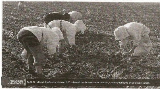
POBLACIÓN VULNERABLE En 2007 del total de niños trabajadores, 1.05 millones lo hacían en el sector primario, fundamentalmente en labores del campo.