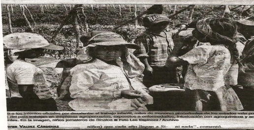
Los niños jornaleros que desentran el trabajo infantil, niños de migración, productores de los estados más pobres, que están en situación de explotación, explotación con explotaciones y explotación. En la imagen, niños jornaleros de Sinaloa en foto Leo Sigmund / Arehivo. Foto: Javier Cabezas. Niños que cada año llegan a 20 mil cada día, comentó.