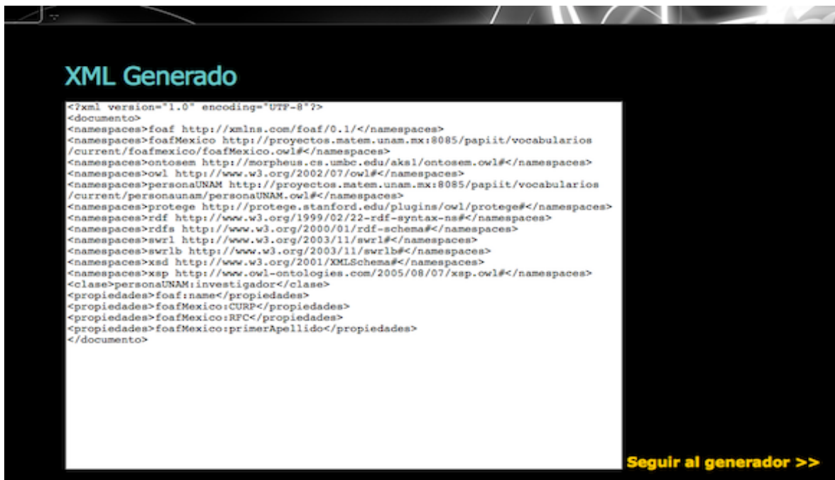
Figura 3.5: Vemos el XML generado y confirmamos que esté correcto

Después de confirmar se escribe el XML en un archivo temporal y pasamos a generador.jsp . Éste lee el archivo y primero mete los espacios de nombre y el nombre de la clase en campos escondidos de una nueva forma. Después se generan campos de entrada de acuerdo al nombre de la propiedad que se quiera insertar (figura 3.6). Esa forma manda sus datos al archivo genera.jsp el cual usa un objeto de la clase GeneradorRDFPro el cual paso a paso lee la forma y va generando su etiqueta en RDF/XML, por cada espacio de nombre, clase y propiedad. Al final escribe el RDF generado en un area de texto (figura 3.7).