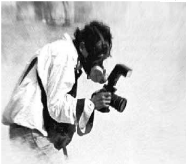
Free lance laborando en un conflicto

De todas las especialidades en el periodismo se descubrió que los profesionistas más agredidos son los reporteros, en particular aquellos que abordan temas policíacos. En el mismo trabajo se mostró a los actores que actúan más contra los informadores y son las autoridades: funcionarios de gobierno, policías, políticos y organismo policiales. Todos ellos acumulan un 60 por ciento de toda la violencia.