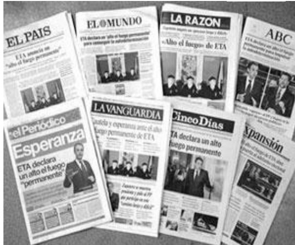
Los mejores sueldos en el periodismo son pagados en medios extranjeros

Una de ellas son los salarios. El sindicato actualmente negocia sueldos entre los 8 mil y 35 mil pesos. Lo más bajos se refieren a medios de comunicación mexicanos. “...son empresas que no tienen consideración sobre lo que es el proceso comunicativo; no, ellos creen que generar una nota es una información una noticia es lo mismo que hacer papitas.”