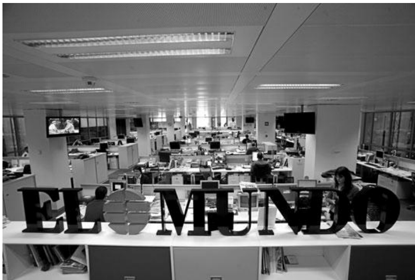
Las redacciones son un lugar que frecuentan bastante los free lance

Las redacciones actualmente están llenas de personas con preparación teórica, es decir, cursaron la carrera de periodismo. Aquellos comunicadores empíricos que aprendían en las calles han quedado en el pasado.