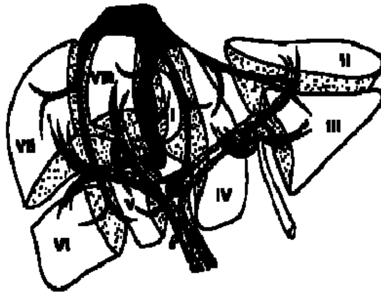
División funcional del hígado y los segmentos de acuerdo a la nomenclatura de Couinaud (Reproducción de Bismuth H. Surgical Anatomy and Anatomical Surgery of the Liver. World J. Surg. 6: 6, 1982)