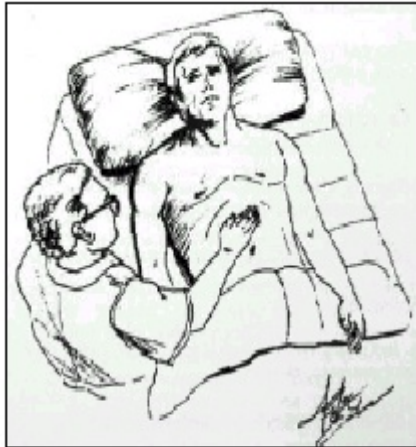
Fig. 4 Maniobra para investigar la contractura inflamatoria de la pared del hipocondrio derecho por acción de la vesícula biliar en la colecistitis aguda.

2. Masa Dolorosa Palpable: De localización subcostal en la línea medio clavicular. Corresponde al fondo de la vesícula biliar inflamada. Es dolorosa a la palpación. Se presenta del 20 al 33%. Fig. No. 4