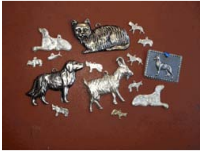
Figura 1. Los exvotos se pueden representar de diversas formas: figuras de ceras y metal.