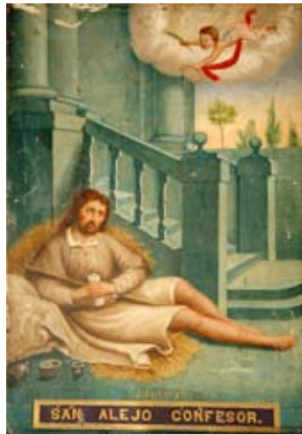
Figura 5. Hermenegildo Bustos. Uno de los retableros mas importantes y más conocido (1832-1907), originario de Purísima del Rincón, Guanajuato; su obra: "San Alejo Confesor"