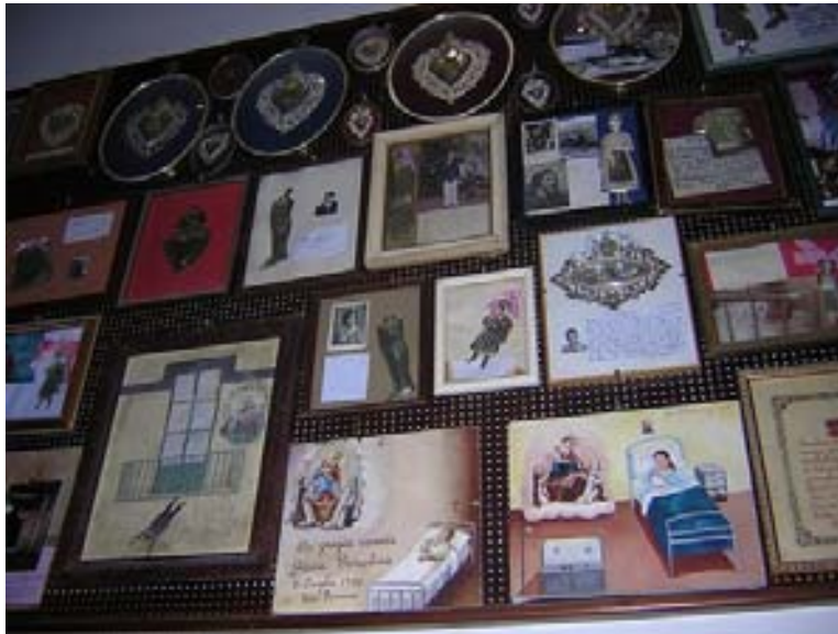
Figura 2. Los muros de los templos aparecen cubiertos de exvotos y se convierten en medio de difusión de ciertas costumbres cristianas.