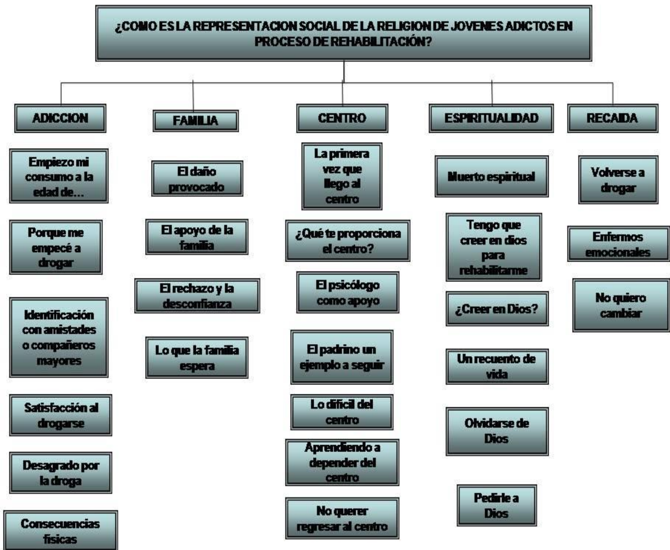
Diagrama 1. Representación de categorías y sus correspondientes elementos.

Una vez realizada la interpretación de la información mediante el análisis de contenido latente se obtuvieron cinco categorías generales de las cuales se desprenden 25 subcategorías (Ver diagrama 1), que nos permiten observar como ha sido la vida de los sujetos con relación a la familia, cómo se da la adicción, conocer su proceso de rehabilitación, la vida en el centro, su representación con respecto a la Religión (espiritualidad), y los motivos que llevan a este grupo de jóvenes a recaer en las adicciones.