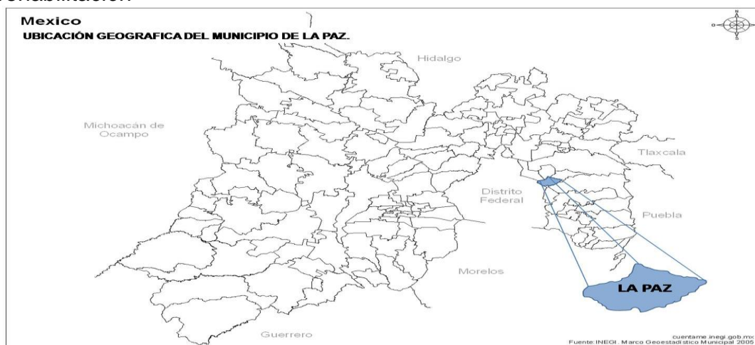
MAPA 1: Ubicación Territorial del Municipio de la Paz, Estado de México.

En el siguiente croquis tomado del INEGI (2005, Disponible: http://www.inegi.gob.mx ) se puede observar la ubicación territorial del municipio de la Paz en el estado de México, lugar en el que se encuentra ubicado el centro de rehabilitación