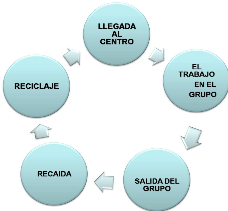
Diagrama 2: Ciclo recurrente en el proceso de rehabilitación manejado en el centro.

"...estando en la agrupación es una paz interna desde que tú estás... de la puerta hacia adentro sientes como el cambio de la desesperación, porque yo muchas veces llegué desesperado de allá afuera, y apenas estaba aquí adentro y la tranquilidad, estoy en algo seguro, aquí no va a pasar nada, aquí si le digo a la madrina que me quiero drogar no me deja salir tres días ¡y salte!, ¿como no?, y no me voy a drogar, pero si estoy allá afuera y quiero pasar ese problema a lo mejor si puedo, pero muchas veces no es mi tiempo y eso me cuesta mucho trabajo a mí, el decirme tengo que agarrarme de un poder superior o de la agrupación por eso se vienen las mini recaídas o muchas recaídas todos los que estamos aquí somos recaídos".