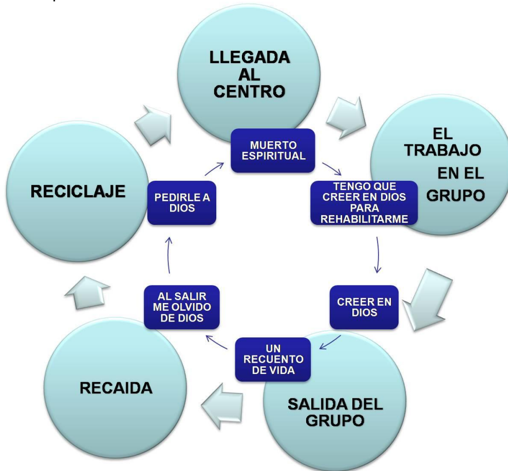
Diagrama 3: Proceso recurrente en el que se ve inmerso el aspecto religioso o espiritual.

mismo por voluntad propia o por decisión de su familia que comparte la idea de que deben depender del centro.