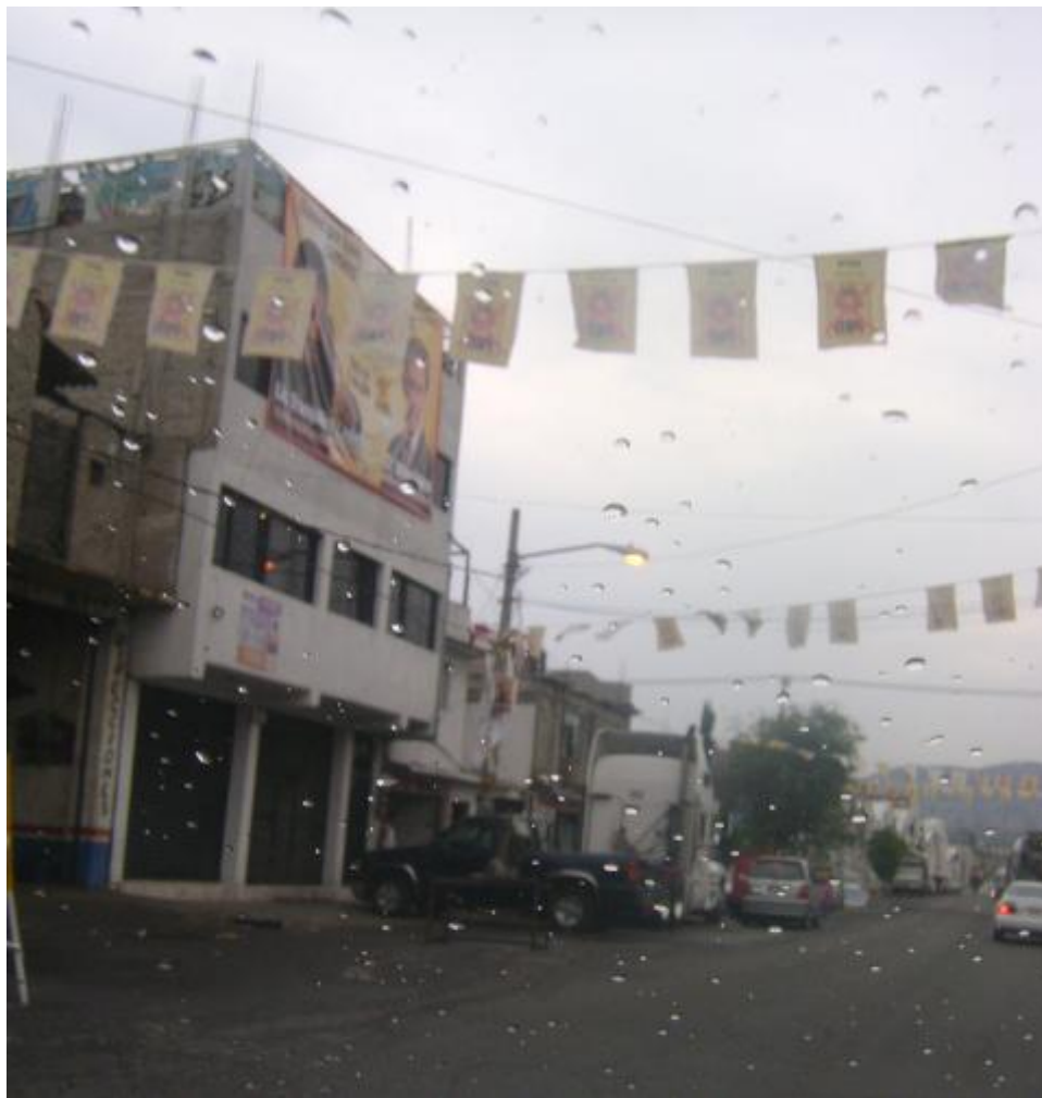
FOTOGRAFÍA 1: Centro de Rehabilitación, Colonia Floresta, Municipio de la Paz, Estado de México.

En la siguiente foto se puede observar la fachada del Centro de Rehabilitación que se encuentra ubicado en Av. Floresta Mz.6 Lt. 6 en la colonia Unidad Habitacional La Floresta, en Los Reyes La Paz