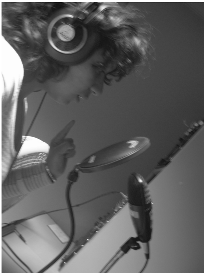
“Medusa del silencio” Autora: Zuleika Villalba.

“El que busca la verdad corre el riesgo de encontrarla”