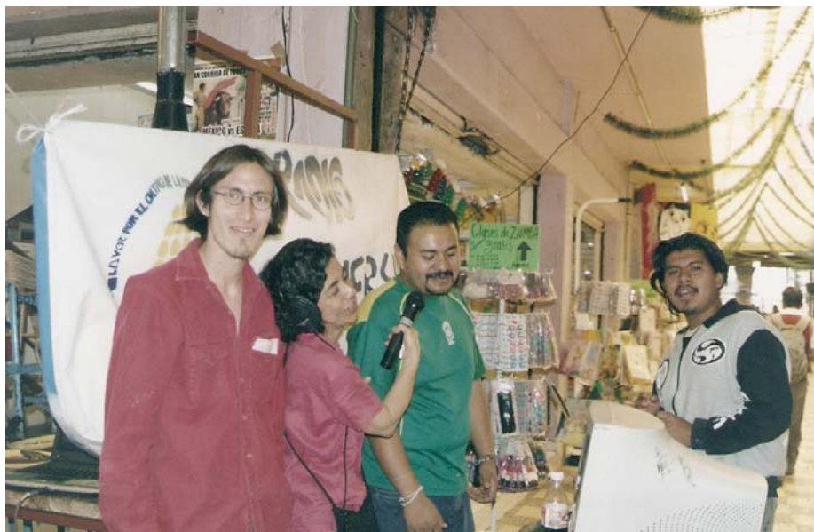
Control Remoto de Radio Chapingo desde el mercado San Antonio Texcoco, Estado de México.