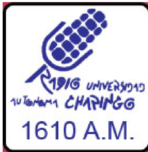
Logotipo de Radio Universidad Autónoma Chapingo

“Una radio universitaria y una radio cultural no van por el rating , el rating es la consecuencia de lo que hacemos bien. Las radios comerciales sí se van a pelear por el rating . Nosotros nos podemos dar el lujo de probar, de transmitir una programación que si bien no convoque a las masas sí convoque a un público interesado en la cultura, en el pensamiento, en la crítica, en la opinión.”