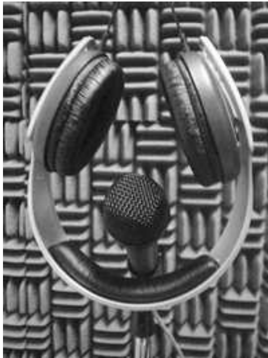
Cabina de Radio Universidad de Guadalajara. Autor: Cecilia Duran.

“La meta primordial (de las estaciones de radio universitarias) es dejar de ser un medio de universidad para convertirse en un medio Universal hacia la sociedad.”