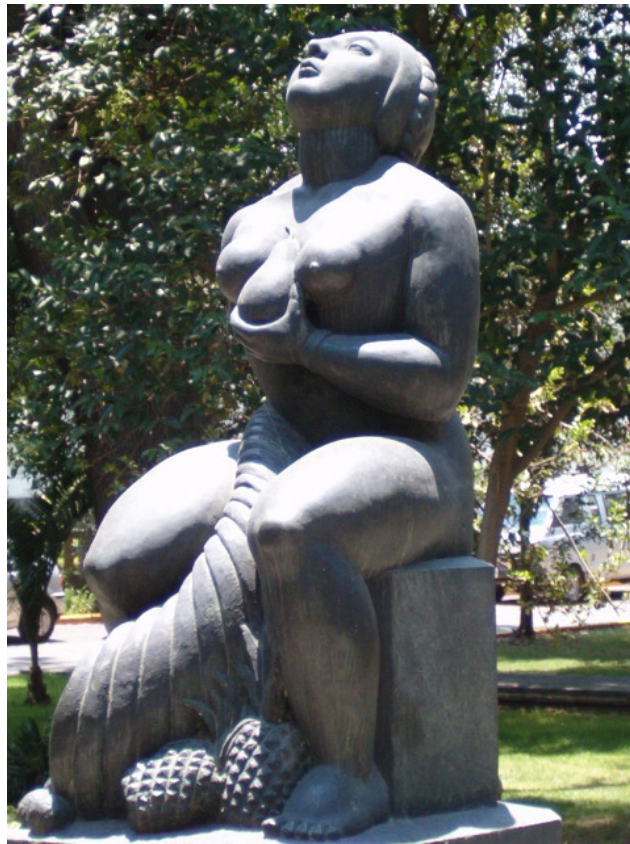
Diosa de la Abundancia, en la Universidad Autónoma Chapingo. Autor: Iván González.

“El trabajo del pensamiento se parece a la perforación de un pozo: el agua es turbia al principio, más luego se clarifica”.