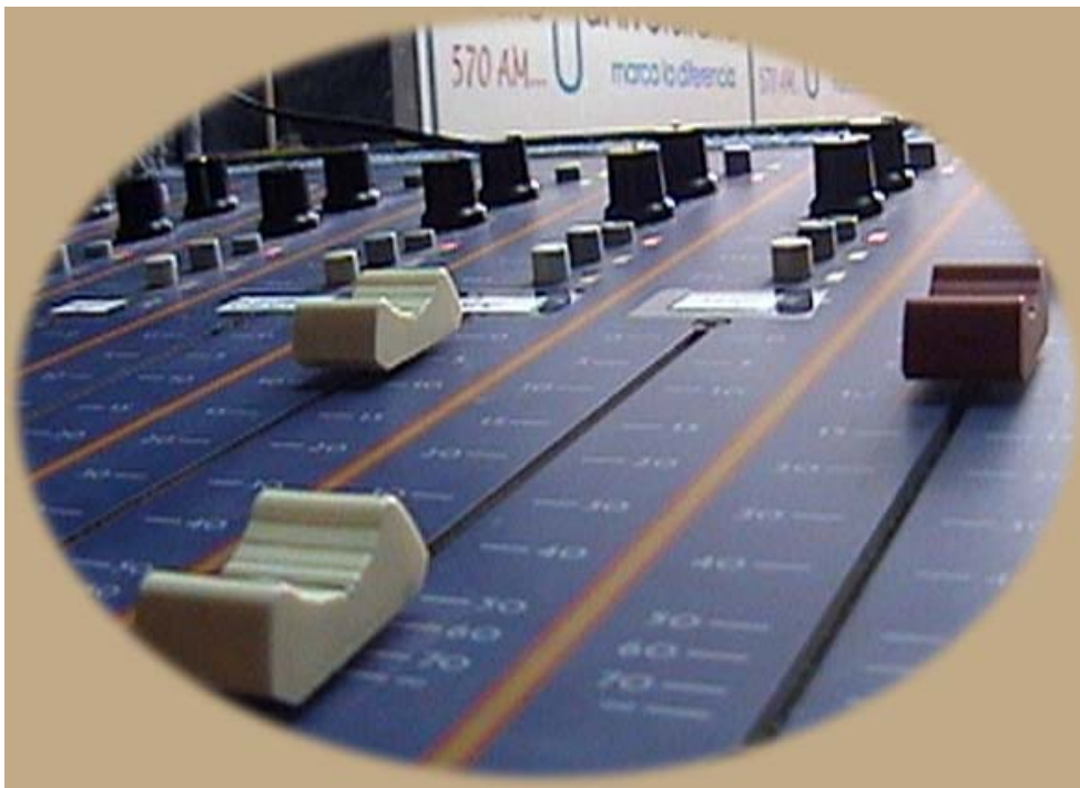
Consola de Radio Universidad Nacional, Pedro Ruiz Gallo de Perú. Autor: Rayme Giancarlo Paredes Garboza.

“La radio universitaria tiene una gran responsabilidad, es una 'incubadora' de talentos, de gente que tiene valor y son intrépidos, lo cual es característico en la juventud. Deben aprovechar la audacia, el valor y la intrepidez de la radio”