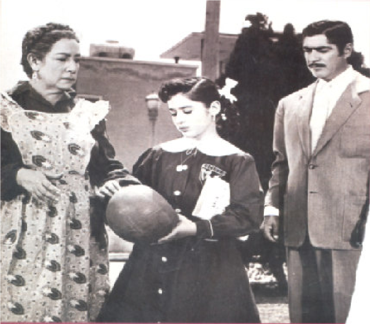
“Besos prohibidos” (1956) Dirección Rafael Baledón. Des izquierda a derecha: Emma Roldán, María Rojo y Luis Aguilar.