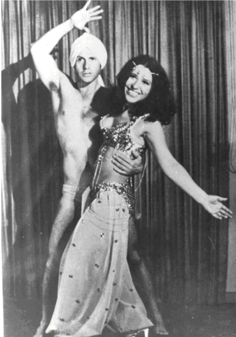
“María de mi corazón” (1979) México Dirección: Jaime Humberto Hermosillo Héctor Bonilla es Héctor Roldán; María Rojo es María Torres López.