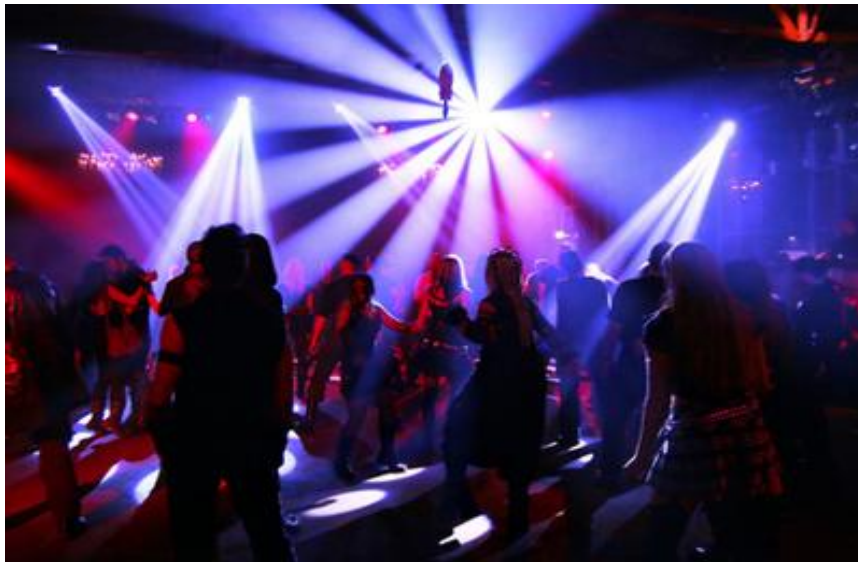
Los amigos bailando en la pista del Love.

Todos estábamos muy contentos, tanto que no nos importó que las canciones que estaban tocando eran de música duranguense y nos fuimos a bailar en bola a la pista. Nunca escuchábamos ese tipo de música pero el momento lo ameritaba, se trataba de echar relajo y ahí estábamos. En la pista había una pareja que bailaba muy bien, así que la misión era imitarlos para aprender a bailar ese estilo de música.