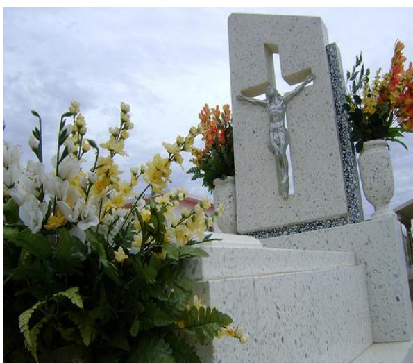
Sepulcro en donde descansan los restos de Daniela.

La situación que habían vivido Karla y sus amigos se debía solamente a la irresponsabilidad de conducir un automóvil después de que habían consumido alcohol y es que aunque muchas veces habían oído que era una conducta que no se debía hacer pensaban que a ellos nada les pasaría, sin embargo la experiencia que habían tenido les mostraba la cruda realidad a la que se exponían cada fin de semana y la cual a partir de ese momento tenían que modificar.