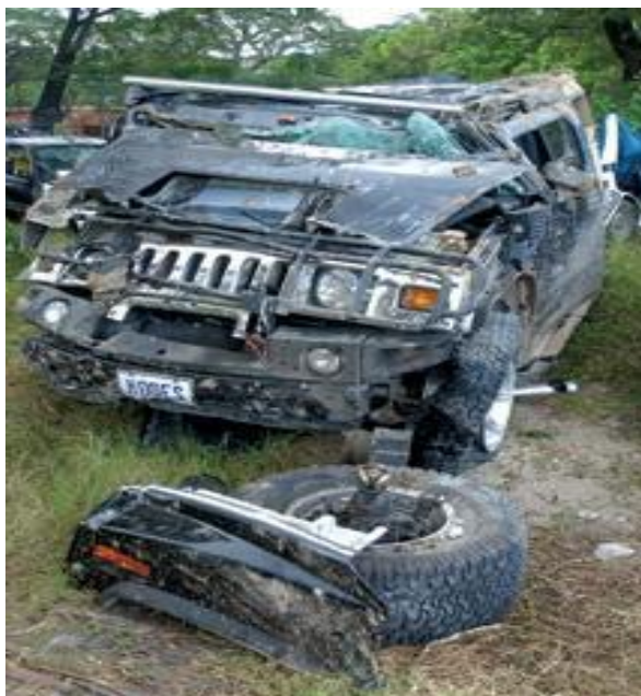
El final de la Hummer.

El choque fue de frente y se considera que las consecuencias de un impacto así son fatales, ya que si el auto se detiene de pronto, la inercia no es inmediata.