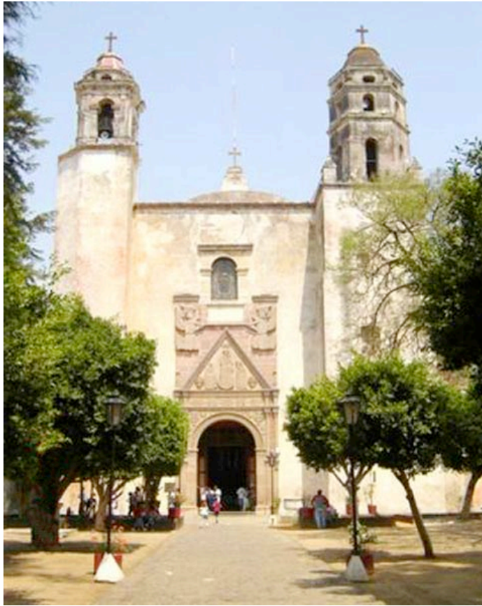
Iglesia de Santa Maria de la Natividad