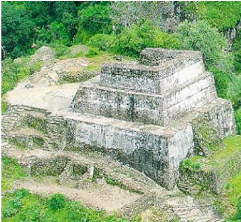
Pirámide de Tepozteco