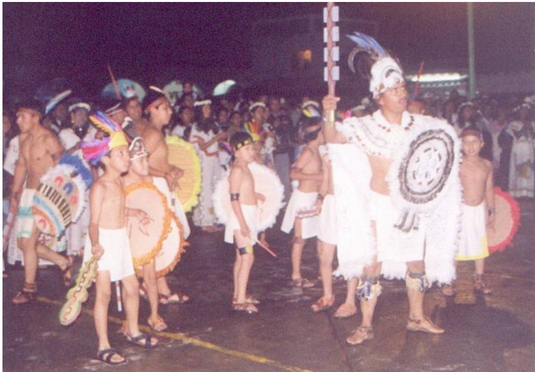
Representación del Reto del Tepozteco, fiesta del 8 de septiembre

grandes movilizaciones poblacionales con el fin de disgregarla y evitar insurrecciones indígenas.