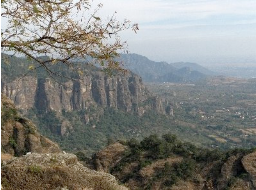
Sierra de Tepoztlán