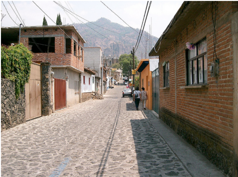
Calles de Tepoztlán