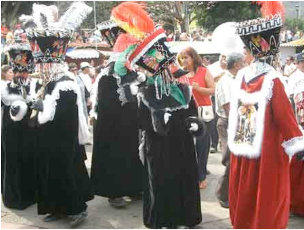
Chinelos de Tepoztlán