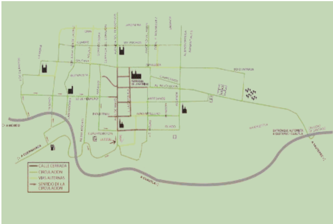
Pueblo de Tepoztlán, Morelos.