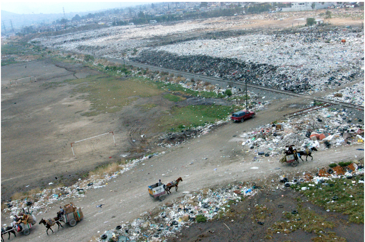
El tiradero Neza III se cerró al igual que Neza I y sólo permanece Neza II donde se deposita provisionalmente en su parte trasera los desperdicios del municipio y de algunas colonias aledañas a éste.

La Planta de Desechos Sólidos aún está en construcción, los costos y los desacuerdos entre ayuntamiento, gobierno e inmobiliaria han ocasionado modificaciones en su ubicación y su capacidad. En febrero de 2007 se puso la primera piedra, pero fue simbólico ya que los cambios continúan porque hay que adaptarse a un presupuesto, informa el Consejo Consultivo del proyecto.