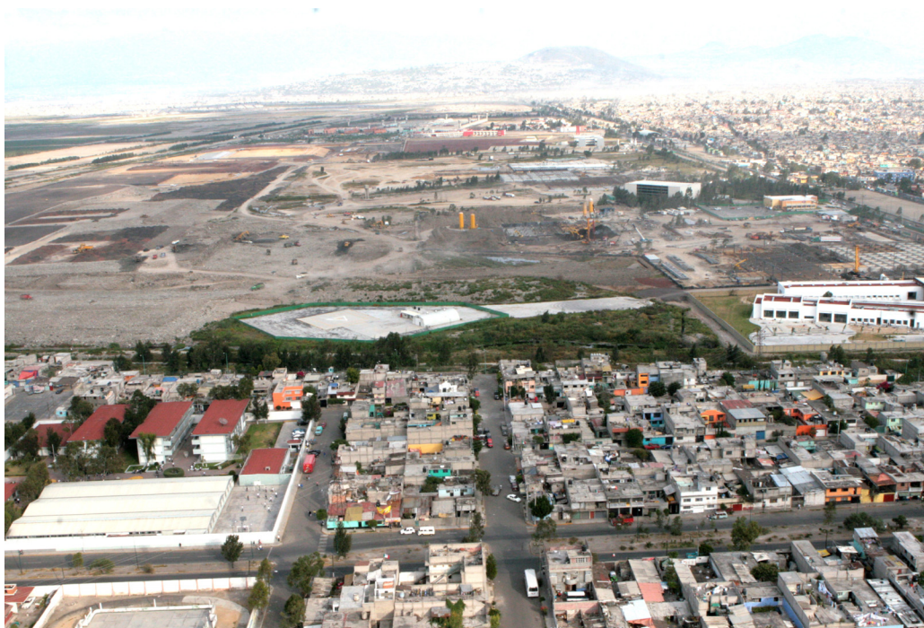
Parte de la colonia El Sol cercana a Ciudad Jardín. Helipuerto al centro, a la derecha el CRIT Nezahualcóyotl, al fondo la zona educativa y construcción de la zona deportiva.