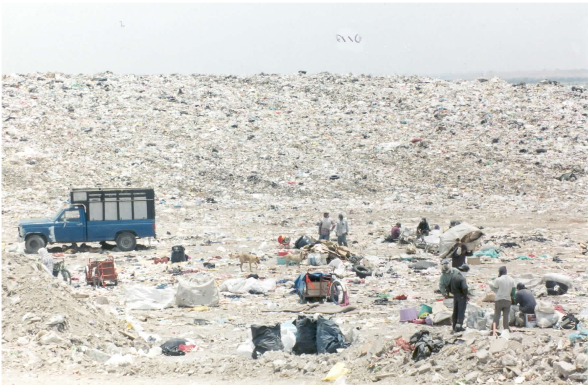
Sobrevivir entre basura.

Los basureros del Bordo de Xochiaca son para muchos la vergüenza del municipio, la mala imagen y el centro de enfermedades. Sin embargo para cientos de familias ha sido la solución a sus problemas de empleo, casa, vestido y alimento. Un lugar de juegos para los niños y la oportunidad que tuvieron para obtener un ingreso.