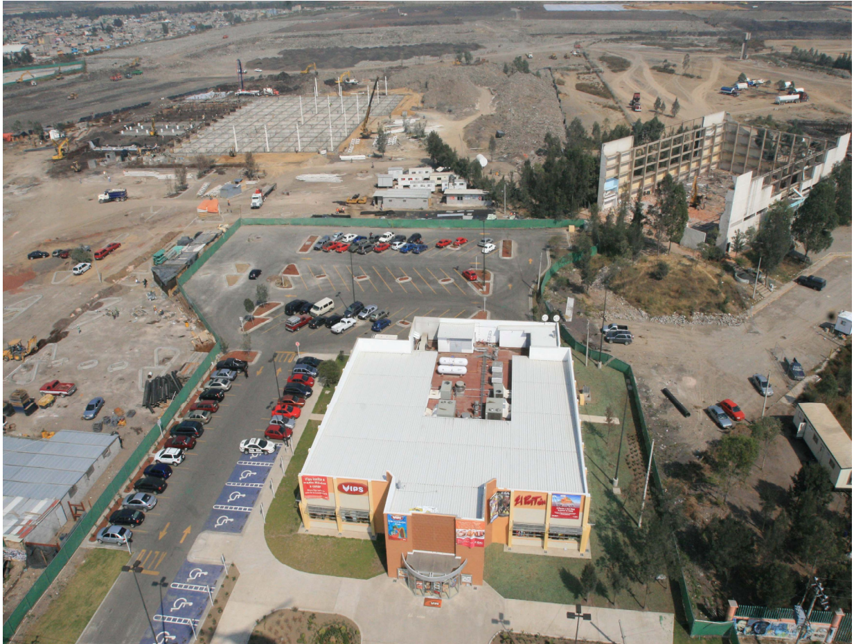
Vips y El Portón, el primer paso de WalMart México en el Bordo de Xochiaca.

Otra de las empresas ancla, según la revista Crain's , podría ser Sport City, empresa deportiva que mostró algunas posibilidades al diversificar su negocio para la clase media.