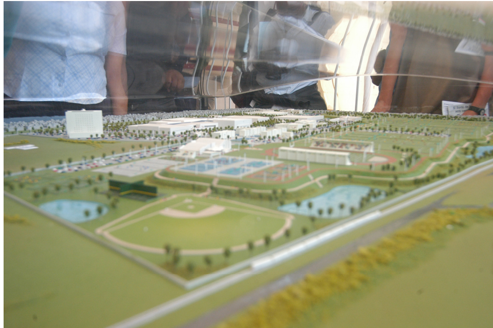
Presentación del proyecto Ciudad Jardín en Nezahualcóyotl, 2004.

Así, la Impulsora del Desarrollo y el Empleo en América Latina (IDEAL) de la familia Slim junto con la Corporación Inmobiliaria Integral Gucahé del empresario Heberto Guzmán anunciaron para la edificación de Ciudad Jardín una inversión de 150 millones de dólares, cantidad similar al gasto presupuestado para todo el municipio de Nezahualcóyotl en el 2006, cuando la autoridad local estimaba una población aproximada de un millón 200 mil personas.