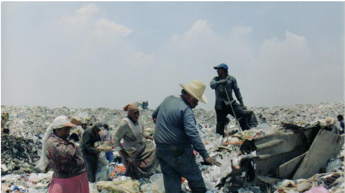
Según Servicios Públicos en Nezahualcóyotl, con cifras que datan de 2004, mil 300 personas viven de la pepena tan sólo en los tiraderos Neza II y III.

Son grupo de trabajadores importantes porque recolectan un 18 % de la basura, de todo lo que se produce. No interfieren en el proyecto, dijo el ex edil, Sánchez Jiménez, siempre y cuando se ajusten a las nuevas reglas de trabajo y participen en la recepción y promoción de la separación de la basura.