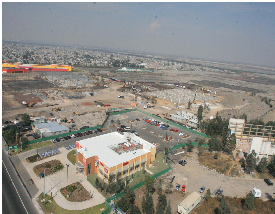
Ninguna señal queda de la basura y sus lixiviados. Avance acelerado de obras en el Bordo de Xochiaca. (noviembre 2007).

Como en la medicina, la recuperación ecológica busca la cura con el menor daño posible. No hay sanación sino estabilidad. Ciudad Jardín promete traer modernidad y desarrollo al municipio sin embargo, parece ser que las décadas de contaminación generan un gasto y un tiempo mayor a los estipulados por los intereses empresariales.