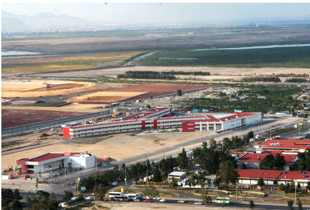
Universidad La Salle junto al penal Neza Bordo (dcha).

Las autoridades municipales enfatizaban el esfuerzo Estatal, Federal y Municipal, porque representaba un avance muy importante ya que cada administración pertenecía a un partido político distinto. “Aunque es complicado, unimos fuerzas en un proyecto donde únicamente la sociedad gana, sólo es voluntad política de hacer las cosas”, refería Sánchez Jiménez.