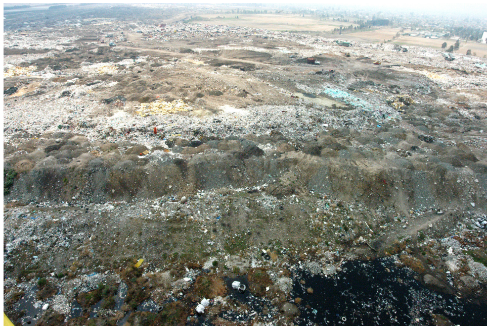
Imagen aérea de los tiraderos Neza I y II en el Bordo de Xochiaca, sedimentos de 3 décadas.