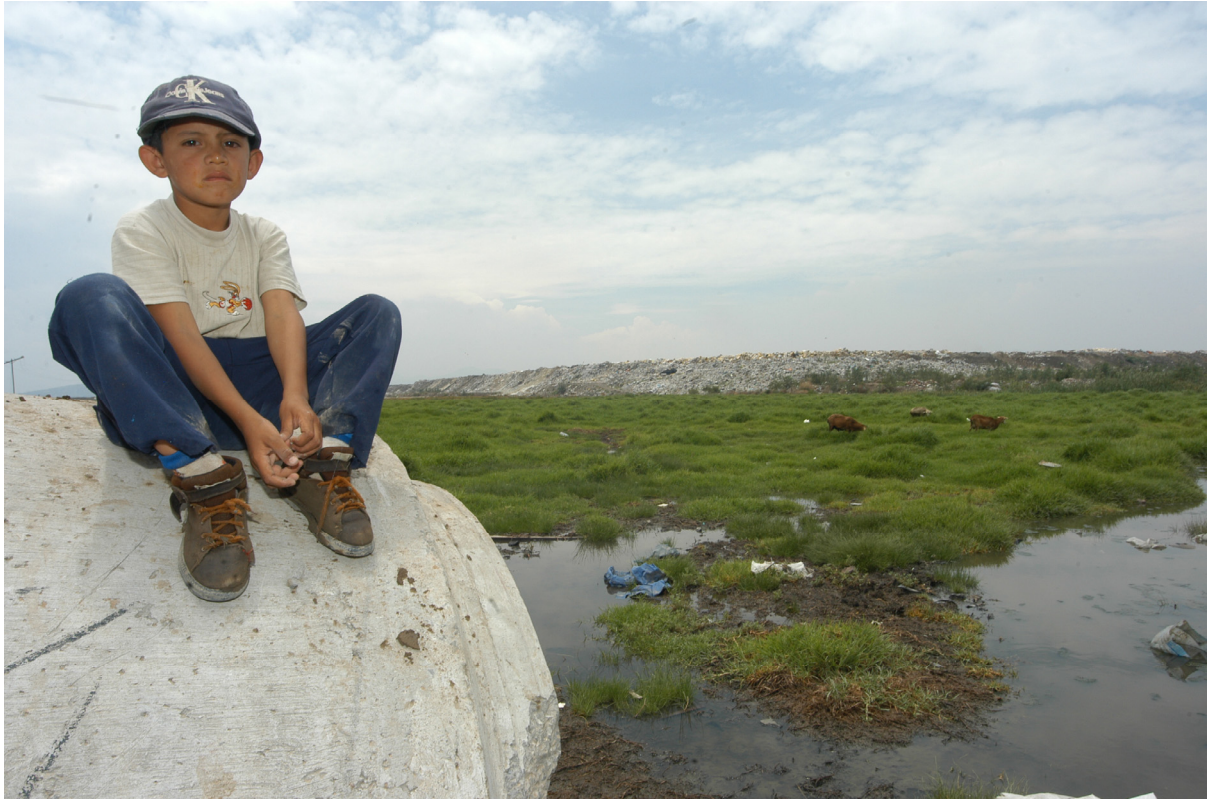
En espera del futuro.

El centro comercial contará además con salas de cine y un centro de convenciones, en una superficie de 18 mil metros cuadrados, y la empresa se compromete a construir las vialidades que sean necesarias, para lo cual se reservaron casi 30 mil metros cuadrados. También habrá un espacio para juegos infantiles rodeado de áreas verdes.