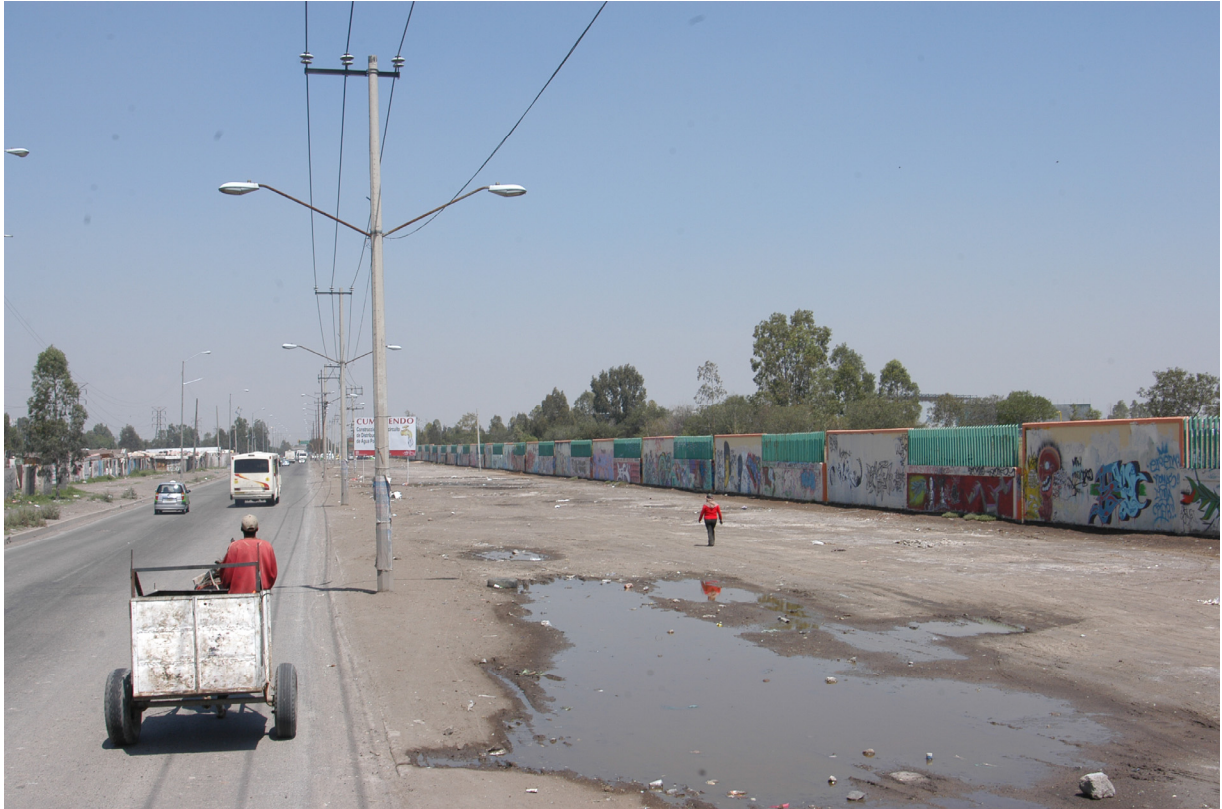
Avenida Bordo de Xochiaca. Derecha, deportivo Neza antes de iniciar obras.