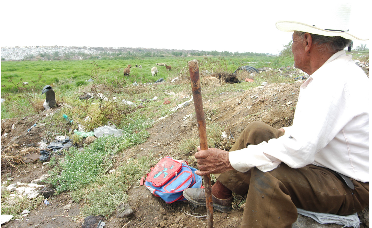
Una última mirada a los tiraderos de Xochiaca.

Ante este panorama no cabe la menor duda de que, efectivamente, el Rey Midas llegó, tocó y demostró que no todo lo que brilla es oro.