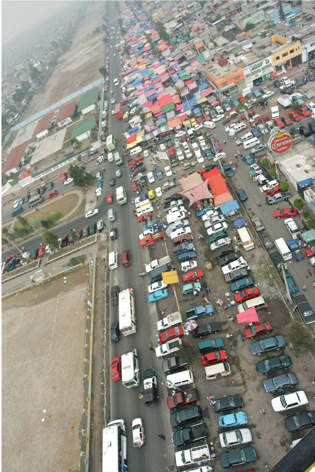
Parte de los tianguis tradicional y de autos sobre el camellón de la avenida Bordo de Xochiaca