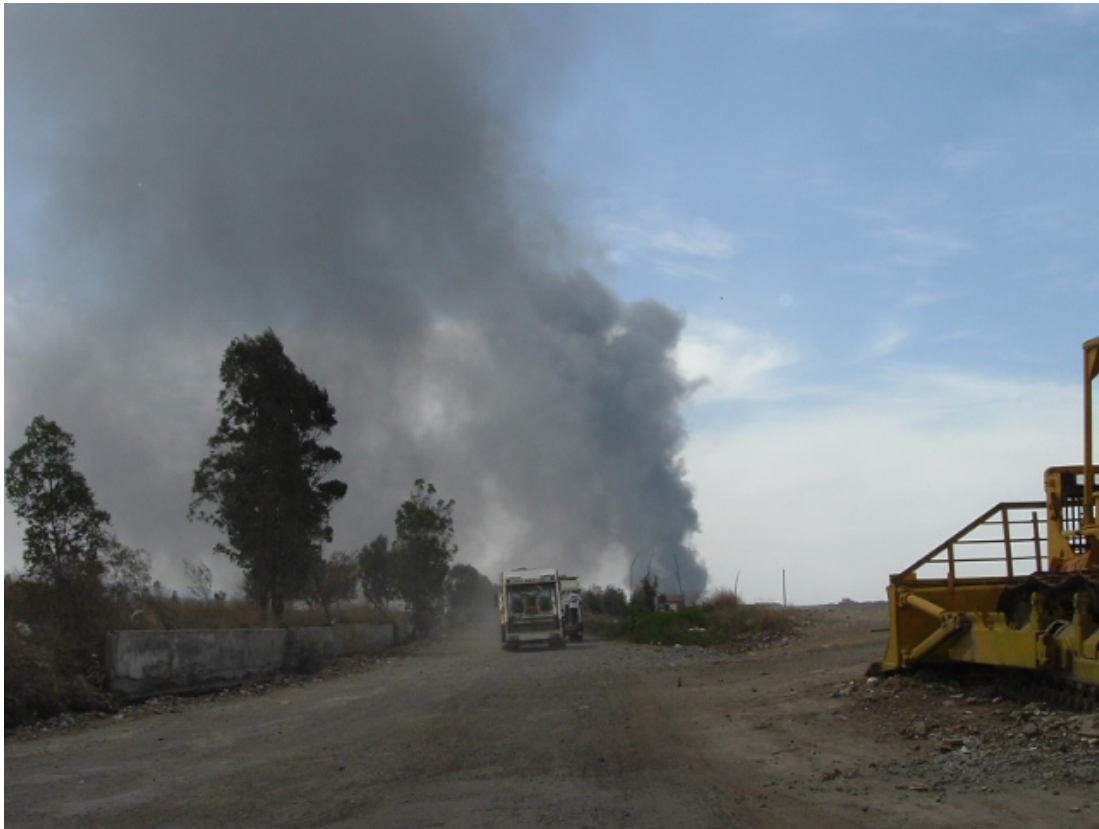
Constantes incendios en los tiraderos del Bordo de Xochiaca por las sustancias suspendidas y el gas metano

Una parte de la basura se tatará, el material que cubrirá el antiguo tiradero será impermeable a líquidos y gases para evitar la producción de más líquidos contaminantes y los canales de lixiviados recolectarán el líquido que aún se produzca por la basura enterrada en los tres tiraderos.