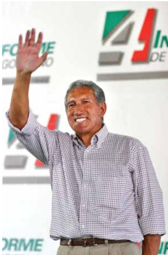
Arturo Montiel Rojas en Nezahualcóyotl, cuarto informe de gobierno. 2004 http://transparencia.edomex.gob.mx/informacion/informes/4informe/fotos/23sep002.jpg

Arturo Montiel Rojas, exgobernador del Estado de México buscaba apoyo económico para los proyectos estatales y estos terrenos le daban la oportunidad de concertar negocios importantes para la zona oriente.