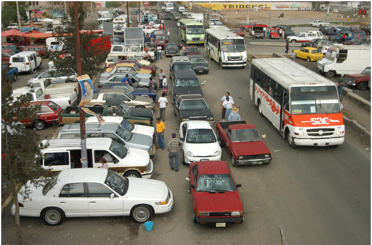
Las autoridades municipales denuncian que el tianguis de autos materialmente aísla a la colonia El Sol, tiene venta de unidades y autopartes robadas y ocasiona caos vial.

El tianguis ha traído un problema que divide opiniones, algunos vecinos están inconformes por la lenta circulación, el caos vial, la inseguridad y la falta de educación de los conductores que incrementan los niveles contaminantes. Mientras otros han visto la forma de “allegarse dinero”, de incrementar las posibilidades de venta en sus locales o “changarros”.