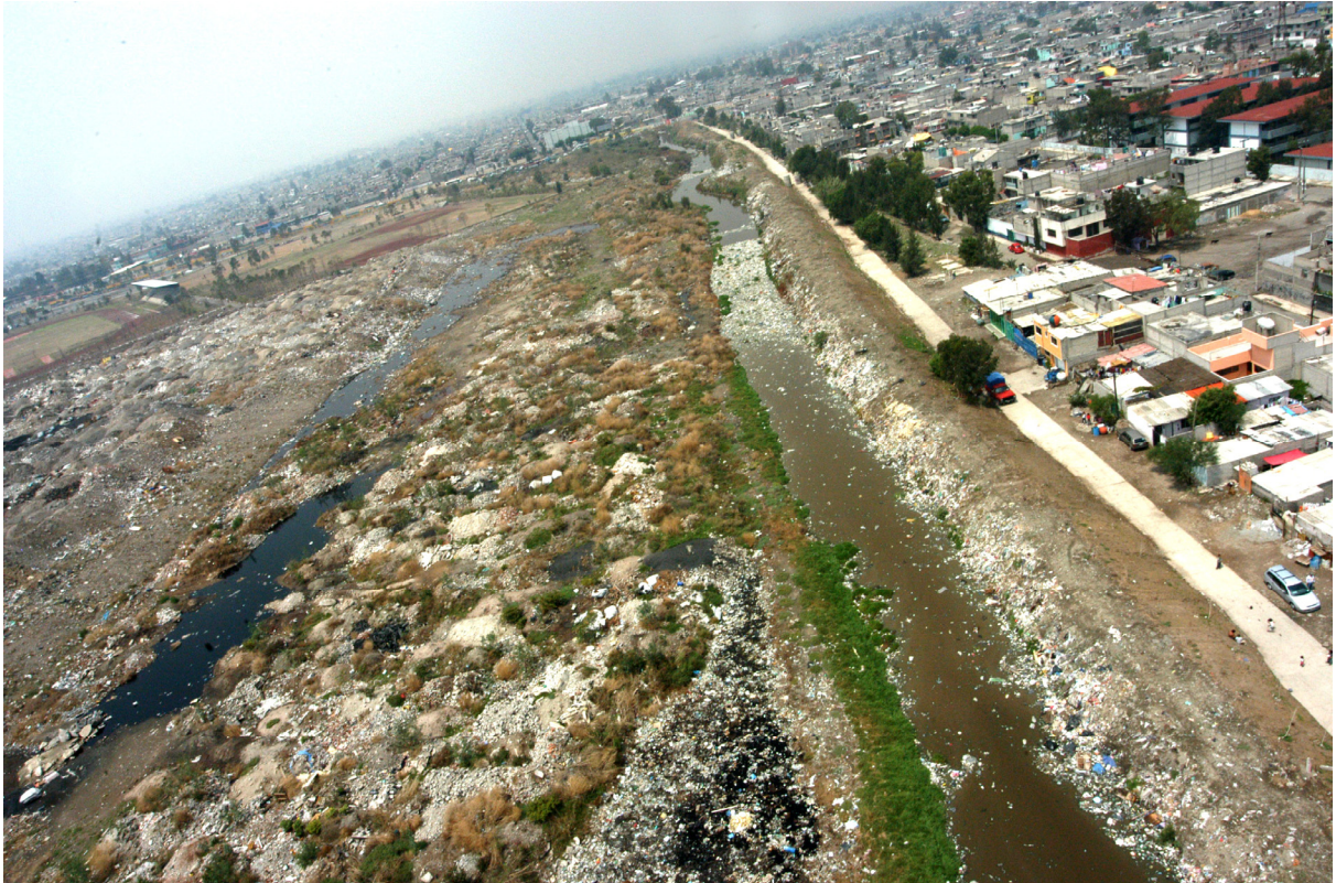
El jugo de la basura, lixiviados en el margen de Neza I.

En tono de broma, relata la revista Contralínea , en marzo de 2006, los miembros de cabildo señalaron que entonces habría que ponerle pastito para que los niños jugaran ahí. Como respuesta, y en tono alarmante, el grupo de análisis planteó que nunca dejarían jugar a un hijo suyo ahí, por las filtraciones de gases tóxicos del suelo.