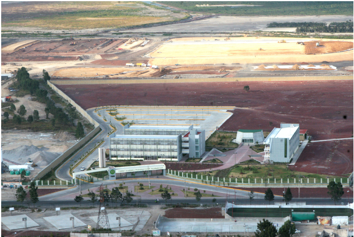
Instalaciones de la Universidad Autónoma del Estado de México inauguradas para el ciclo escolar 2007-2008 en el extradero Neza I.

Con la instalación de la UAEM en terrenos del Bordo de Xochiaca se ampliará el corredor educativo. En ese espacio se encuentran ubicados el Centro de Estudios Científicos y Tecnológicos plantel Nezahualcóyotl, Cebetys, Colegio de Bachilleres 12 y la Universidad Tecnológica de Nezahualcóyotl (UTN).