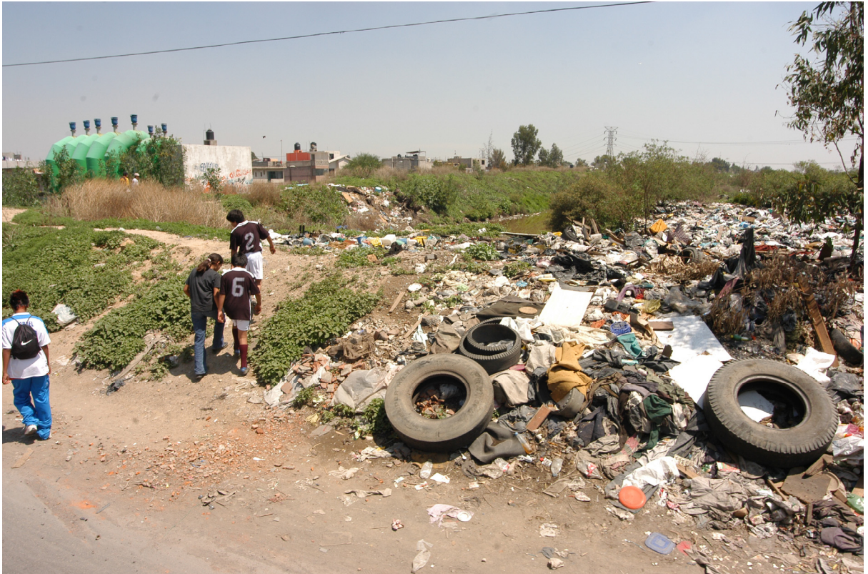
La frontera entre El Sol y la basura.