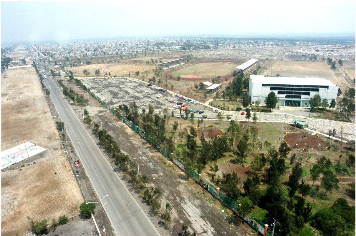
Instalaciones de la antigua Ciudad deportiva Neza, izquierda: avenida Bordo de Xochiaca.

Cruza al camellón junto a un perro que mueve la cola para agrandar o conseguir un poco de comida. Se detiene algunos minutos para ver los partidos de futbol, acomoda el resorte del short en la cintura, baja su gorra. El camellón será ahora su pista de carreras, sorteará algunos obstáculos, se detendrá en los cruces de las avenidas Riva Palacios, Nezahualcóyotl y López Mateos; quizá de otra vuelta frente a las casas de cartón y los camiones oxidados del ayuntamiento. Tendrá que esperar un año o más para disfrutar de las instalaciones prometidas en la nueva Ciudad deportiva.