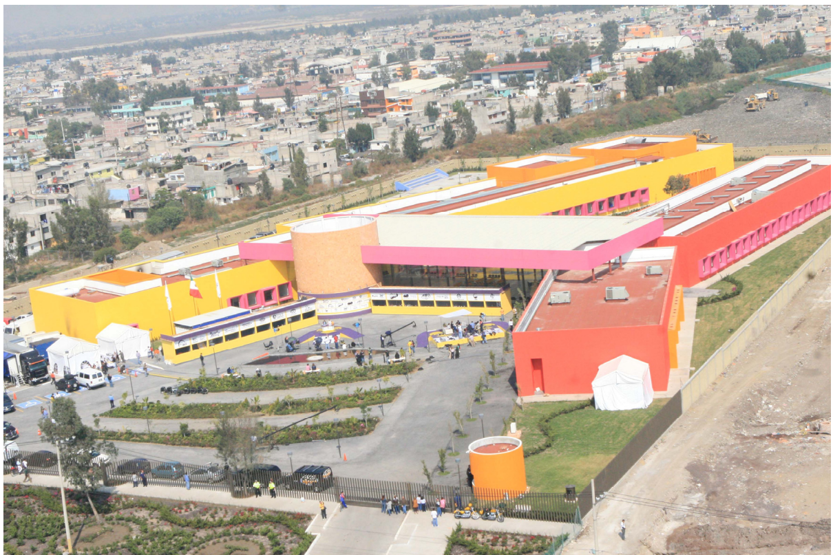
CRIT Nezahualcóyotl próximo a inaugurarse, es la cuarta obra finalizada en el extiradero Neza I.

“Estamos transformando un pasivo ecológico en un activo económico”, explica Salem, llegado al Grupo Carso en 1984 y responsable del proyecto de remodelación del Centro Histórico de la Ciudad de México. Este tipo de cambios son que los que Slim intenta sacar de su cartera en toda América Latina. Y su varita mágica se llama IDEAL.