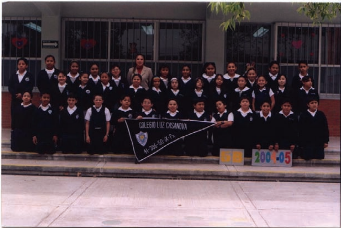
Foto de Grupo