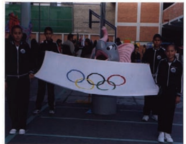
Fig. 8 Mini Olimpiada