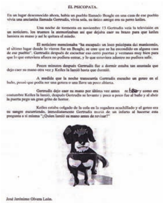
Fig. 3 Cuento 1