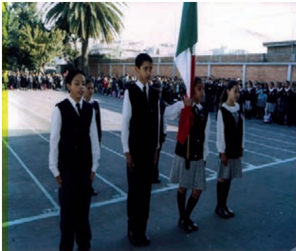
Fig. 7 Dentro de la escolta