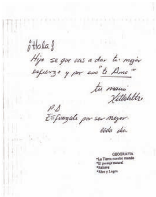
Fig. 9 Carátula de sexto