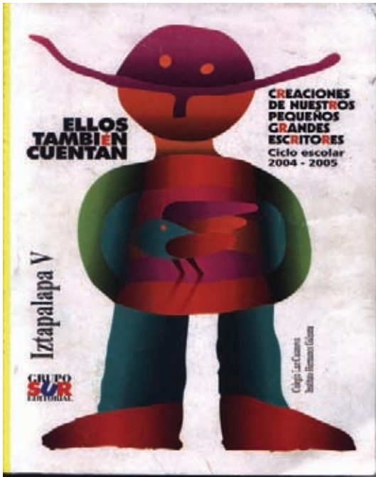
Fig. 5 Libro que publicó su cuento

EL DUENDE CHIORST por José Jerónimo Olivera León En un bosque había un duende llamado Chiorst, era muy trabajador. Él trabajaba vendiendo mangos a mitad del bosque. Él vivía en un árbol de cacao y tenía suerte, ya que el árbol vecino era de plátano y era lo que más le gustaba a Chiorst. Un día fue a trabajar y al regresar, miró al árbol y no había plátanos, de pronto miró a un gorila con los plátanos. Chiorst lo persiguió hasta alcanzarlo, de pronto el gorila le lanzó piedras a Chiorst, él se agachó, tomó una rama, golpeó la piedra y dejó inconsciente al gorila, se llevó los plátanos, muy campante, diciendo un sin fin de moralejas, y una de ellas fue: -No tomes lo que no te pertenece.