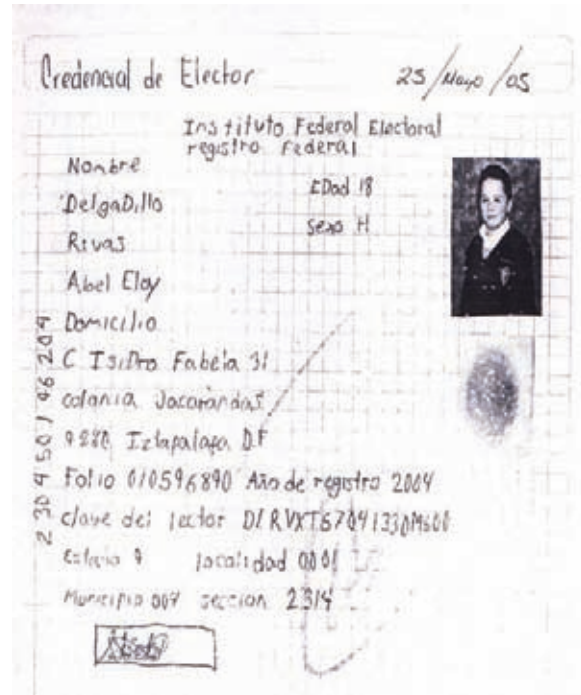
Fig. 2 Ese soy yo