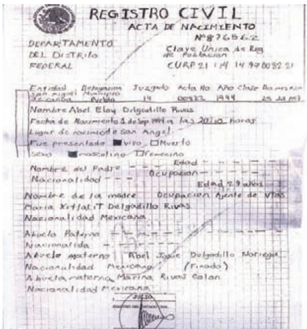
Fig. 3 Acta de Nacimiento