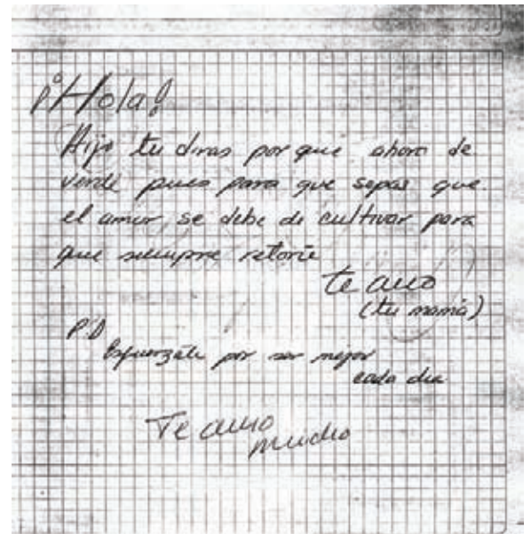
Fig. 10 Carátula de sexto