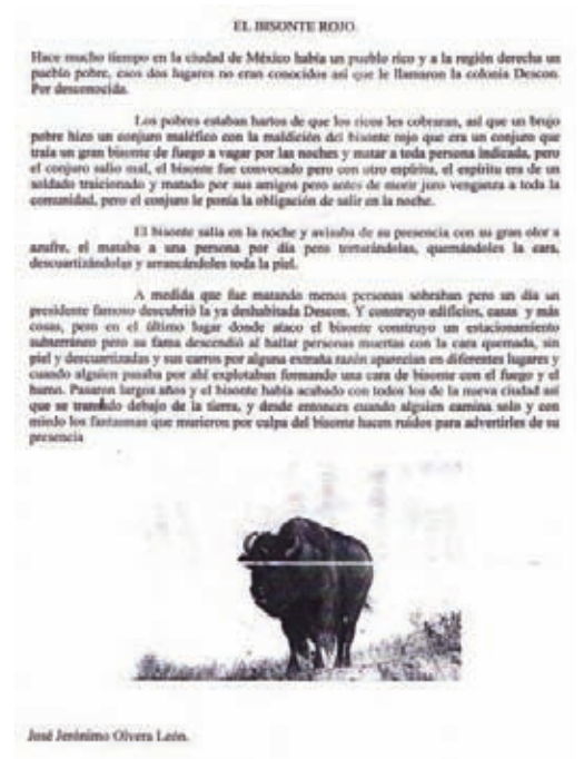
Fig. 4 Cuento 2