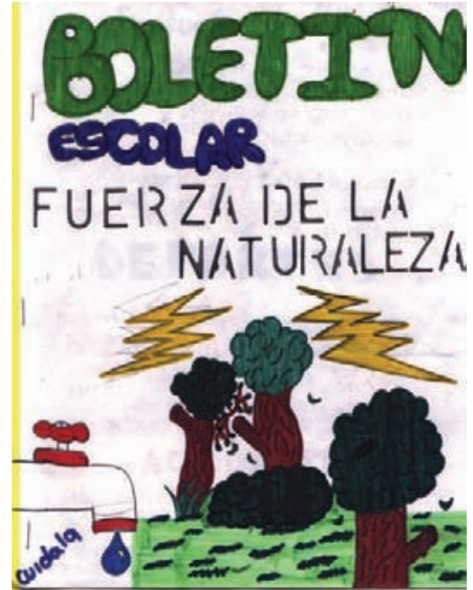
Fig. 2 Boletín Escolar