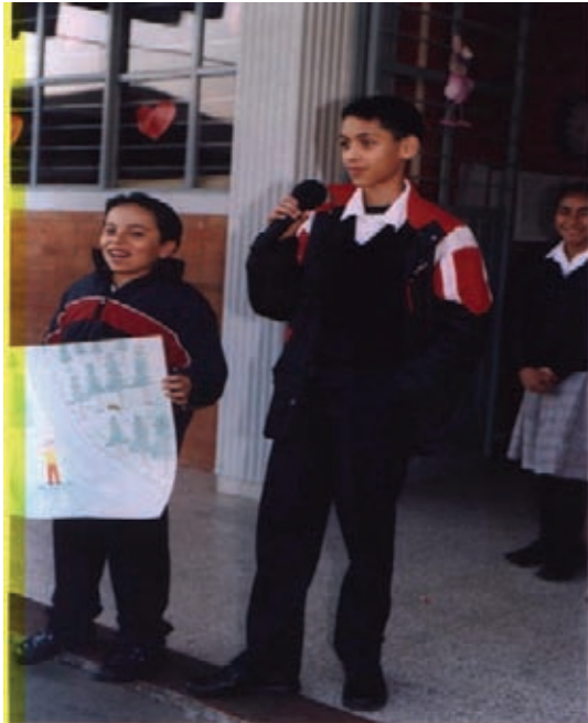
Fig. 1 Embajador Ecológico