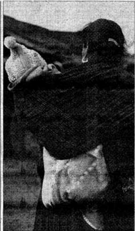
25 de mayo, manifestación nacional por la vida humana

Es mentira que los obispos sean los únicos agraviados por el crimen del cardenal. Lo somos todos los católicos y los buenos mexicanos, los que nos entristecemos cuando la Patria entra en callejones sin salida donde los poderes del dinero y del mal son los únicos poderes que tienen voz. Cuando se dice que México es el país de la impunidad nos sonrojamos, porque sabemos que es cierto, que aquí hay 15, 20 o 30 «secuclados» cada día y la mayor parte de los partidos sigue echando discursos y peleando por los dineros de PEMEX. La guerra contra el crimen—organizado o desorganizado, lo mismo da—o es de todos o la vamos a seguir perdiendo.