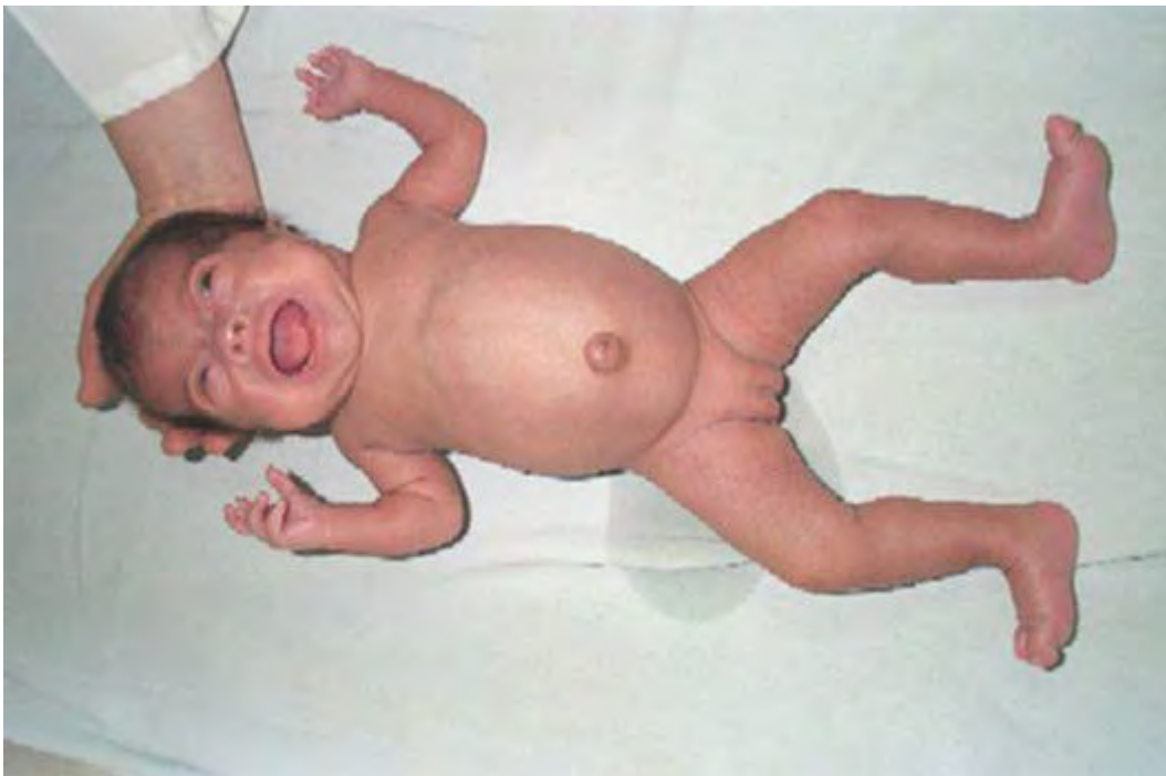
Figura 3. Paciente con hipotiroidismo congénito. Se observan los datos característicos de hernia umbilical, macroglosia, piel marmórea, hipotonía y edema palpebral, entre otros.

La acción de las hormonas tiroideas es ampliamente conocida, y tiene que ver prácticamente con todos los órganos y sistemas del ser humano. En la figura 4 se señalan algunas de esas funciones fundamentales para la vida.