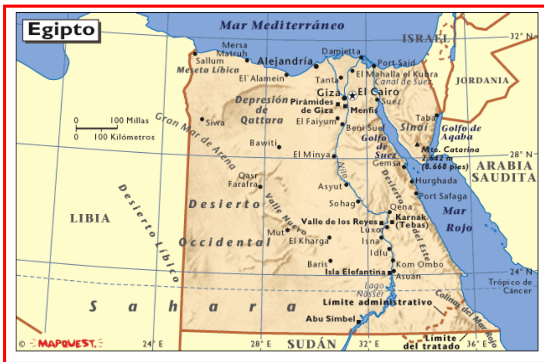
Mapa de Egipto 113

Esta milenaria costumbre tiene un origen incierto, sin embargo, se cree que nace en la Edad de Piedra de África Central para viajar al norte por el Río Nilo hasta el Antiguo Egipto. 111 Se dice además que esta ancestral practica realizada por lo menos desde hace cuatro mil años es originaria del Antiguo Egipto ya que en el hallazgo de algunas momias se muestra la evidencia de que fueron mutiladas genitualmente 112 , confirmando la creencia de la ambigüedad sexual que existía entre los antiguos Dioses y que la única manera de separar lo masculino y lo femenino era extirpando ya fuera el prepucio o el clítoris para que dejaran de ser seres andróginos.