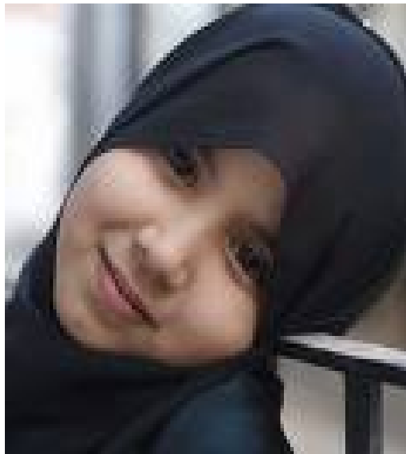
Niña Musulmana portando el velo islámico. 74

Un claro ejemplo de la importancia del uso del velo en las mujeres musulmanas lo podemos observar en la siguiente imagen. Aunque culturalmente está establecido que comenzarán a usarlo después de llegada la primer menstruación, muchas niñas son persuadidas por sus padres a portarlo aún fuera de la Mezquita, esto como símbolo de respeto.