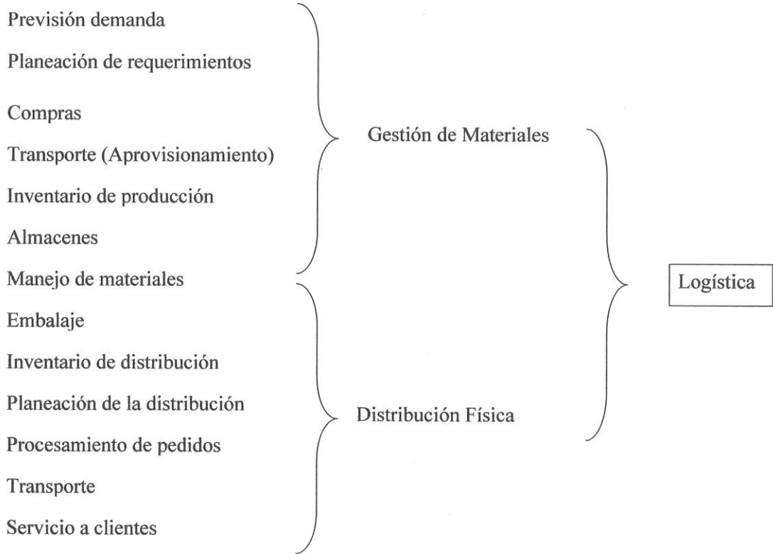
Cuadro 1. Sistema logístico