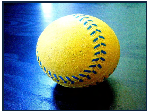
Figura 10. Pelota