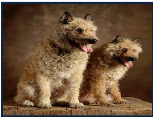
Figura 5. Pastor belga lakenois