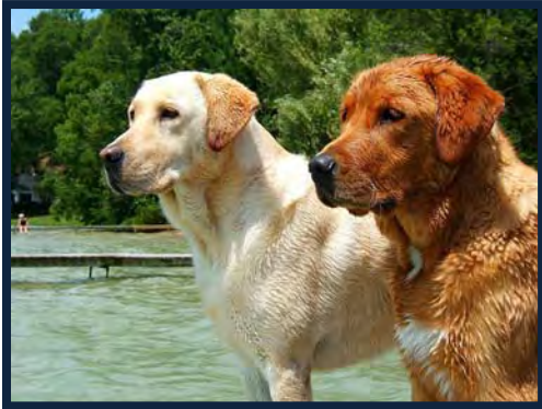
Figura 1. Cobrador de labrador