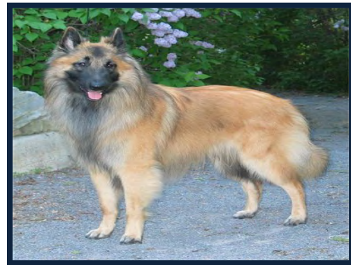
Figura 4. Pastor belga tervuren