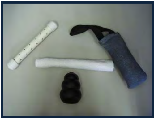
Figura 9. Toalla, dummy y Kong