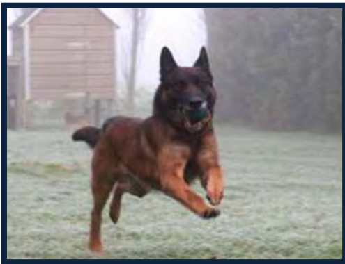
Figura 3. Pastor belga mallinois