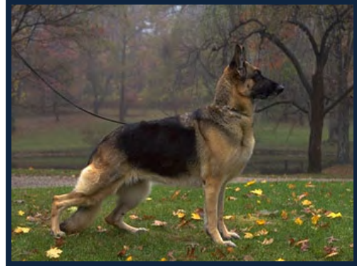
Figura 2. Pastor alemán