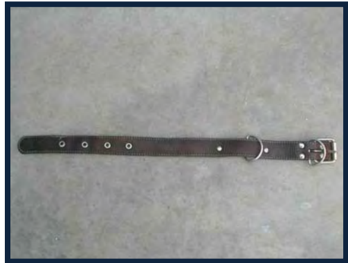
Figura 8. Collar de piel sin adornos