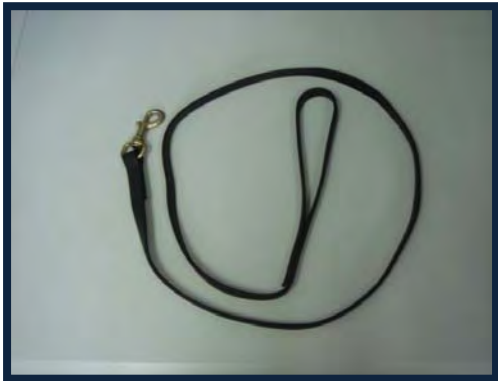
Figura 7. Correa de piel de 1.20 x 0.3 m