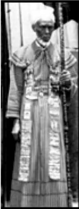
Prince Emmanuel I

El príncipe afirmaba ser un sacerdote de la orden Bíblica de Melquizedec, lo que lo llevó a ser una figura controvertida para algunas comunidades Rastafari, en especial para la orden Nyahbibghi , que era la más antigua. Al pretender formar parte de la divinidad, junto con Haile Selassie I, acabó desviando sus intereses, cobrando tintes ortodoxos al convertir a sus seguidores en predicadores de una iglesia organizada. Los Boboashanti creen en estos principios, haciendo de Rastafari una religión. La jerarquía de esta orden es la siguiente: padre de la creación, JAH Rastafari Haile Selassie I; príncipe Edward Emmanuel Charles I; profeta, Marcus Mosiah Garvey I.