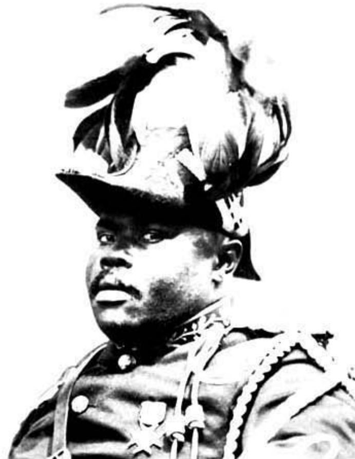
Marcus Mosiah Garvey

Garvey no sólo fue un líder influyente en su tiempo que brindó a miles de personas una conciencia política anti-colonial. Su labor dejó huella también en el Caribe y los Estados Unidos, donde su figura está al mismo nivel de la de luchadores sociales como Martin Luther King y Malcom X. Sus restos mortales fueron trasladados a Jamaica, donde fue proclamado el primer héroe nacional. Garvey no creía en la violencia y exhortaba a sus seguidores a respetar la Constitución y a no provocar altercados. Para los Rastafari Garvey es un profeta, creen que es la reencarnación de Juan el Bautista; pues en uno de sus discursos dijo: “Miren hacia África cuando un rey negro sea coronado, pues nuestra redención estará a las puertas” .