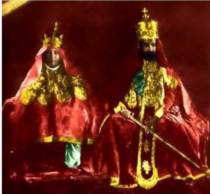
Alpha & Omega

Durante su reinado hubo bastantes avances para un pueblo que estaba dejando a penas la sociedad feudal. En 1931, Haile Selassie I dotó a su país de una nueva Constitución, con la cual pudo proseguir con su política centralista