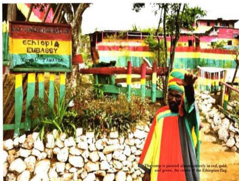
Comunidad Rastafari en Jamaica

Posteriormente analizaré la influencia del reggae en este movimiento, pues este ha sido el hilo conductor del pensamiento Rastafari, ya que es por la música como se ha difundido el mensaje que trae consigo esta forma de pensamiento.