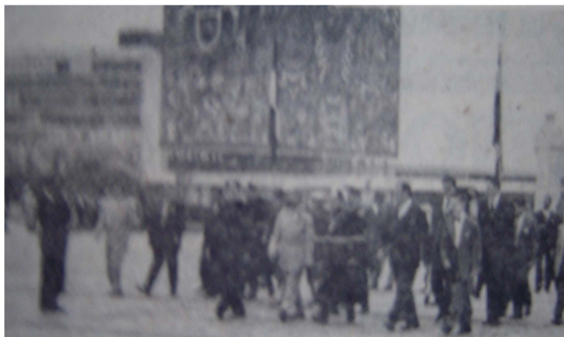
Haile Selassie I en Ciudad Universitaria.

“Nuestra máxima casa de estudios se enorgullece con la visita de un hombre tan respetable, sabio y atento; Majestad Imperial, la Universidad os brinda en este día su hospitalidad más sincera y se honra en transmitir el mensaje de amistad y simpatía de los hombres de estudio que se unen a la de los otros compatriotas mexicanos que ya lo han hecho o lo harán en estos días. A su vez, su Majestad declaró: Su gran civilización Azteca, mezclada con la española y no contenta con su glorioso pasado, ha construido esta Ciudad Universitaria para que su presente y futuro sean más gloriosos. México ha demostrado el verdadero sentido de la palabra fraternidad y los etíopes nos sentimos orgullosos de ser hermanos de los mexicanos.” 13