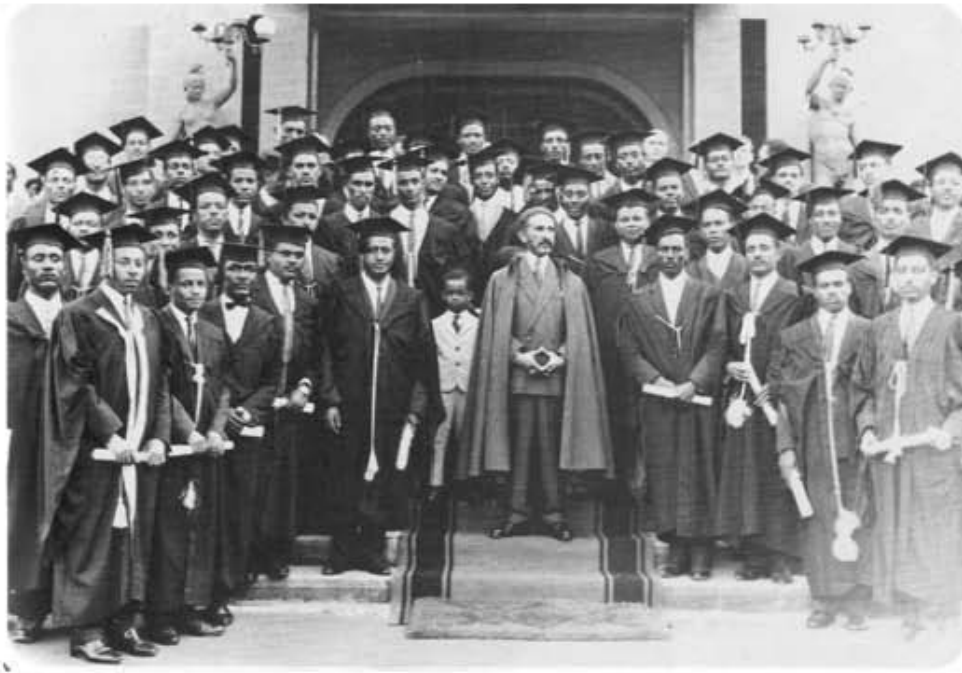
Haile Selassie I con los primeros graduados de la universidad que el fundo.

El esfuerzo realizado en este trabajo ha tenido la finalidad de contribuir a aclarar muchas de las dudas que hay respecto al movimiento Rastafari en México, teniendo muy en cuenta la neutralidad valorativa de la investigación sociológica, tratando de ser lo más objetivo en el análisis y la información aquí brindada. Espero que este trabajo le sirva a todos aquellos que buscan información sobre este tema para ayudar a que el Rastafarismo no se convierta en una moda más pasajera; espero que sirva a todo aquel que esta en el camino de la fe de Rastafari, para llevarla con respeto para así no caer en adicciones y banalidades.