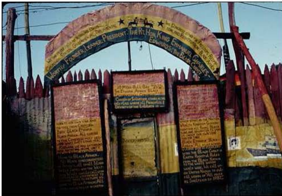
Entrada a Bobo Hill.

“La congregación ocupa siete u ocho acres de terreno, donde se encuentra un tabernáculo, una pequeña escuela para los niños de la comunidad, una palapa donde se fabrican escobas, otra donde se hacen sandalias, la casa del príncipe y otras para los demás miembros de la comunidad. El terreno esta cercado y en el único portón de entrada se encuentra un guardián.” 34