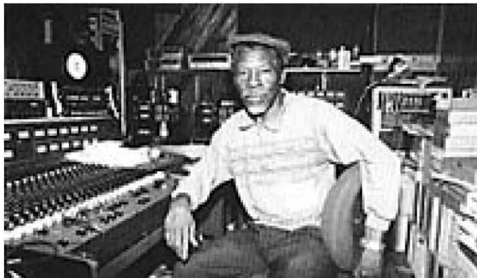
Cooxsone en el Studio One

Muchos de los riddims y de las pistas realizadas en esa época, se siguen utilizando en la actualidad, pues fueron innumerables las bandas y voces que se produjeron durante el boom del reggae y el dub . Destacan Israel Vibración , Culture , Hugh Mundell , Macka B , Mike Dread . Este último tuvo colaboraciones con los punks de The Clash , U-Roy , Mutabaruka , Jacob Miller , Abbyssinians , por citar algunos. Hasta la fecha la producción de esta música no se ha detenido, la segunda generación en el dub está representada especialmente por Mad Professor y Jah Shaka , mientras que Alpha & Omega , Disciples , Dub syndicate , Zion Train , junto con muchas bandas más que han surgido en el Reino Unido y en Jamaica, son dignas representantes de la tercera generación de músicos de dub .