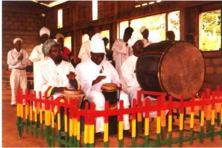
Tabernáculo de Bobo Hill.

La palabra Boboashanti se utiliza para designar a los seguidores de Príncipe Emmanuel. Su origen etimológico deriva de palabras africanas Bobo , que significa gente negra y Shanti o Ashanti que se refiere a los guerreros (basado en los guerreros Kumasi de Ghana). Boboashanti significa “guerreros negros”.