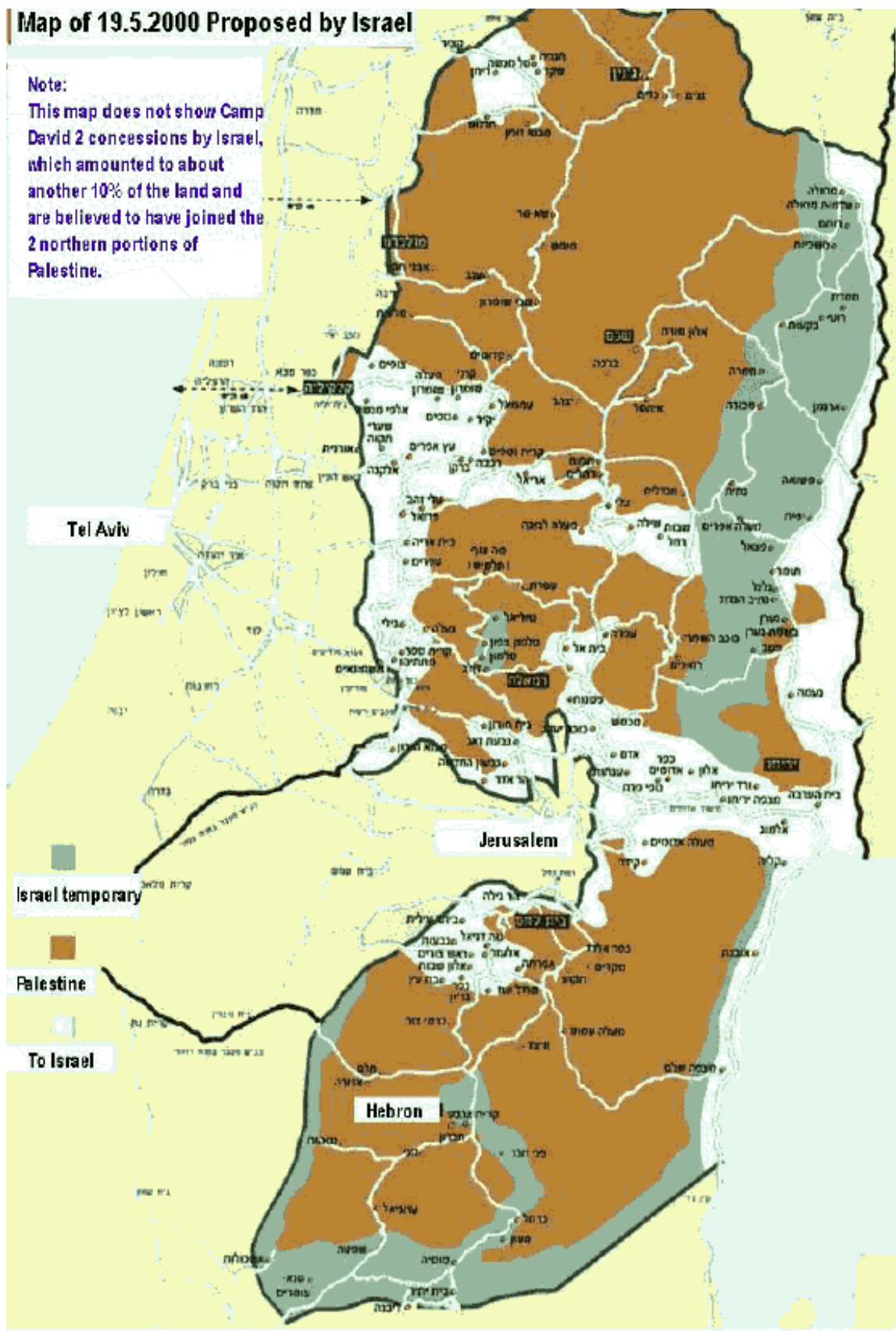
Figura 5. Propuesta de Camp David II.