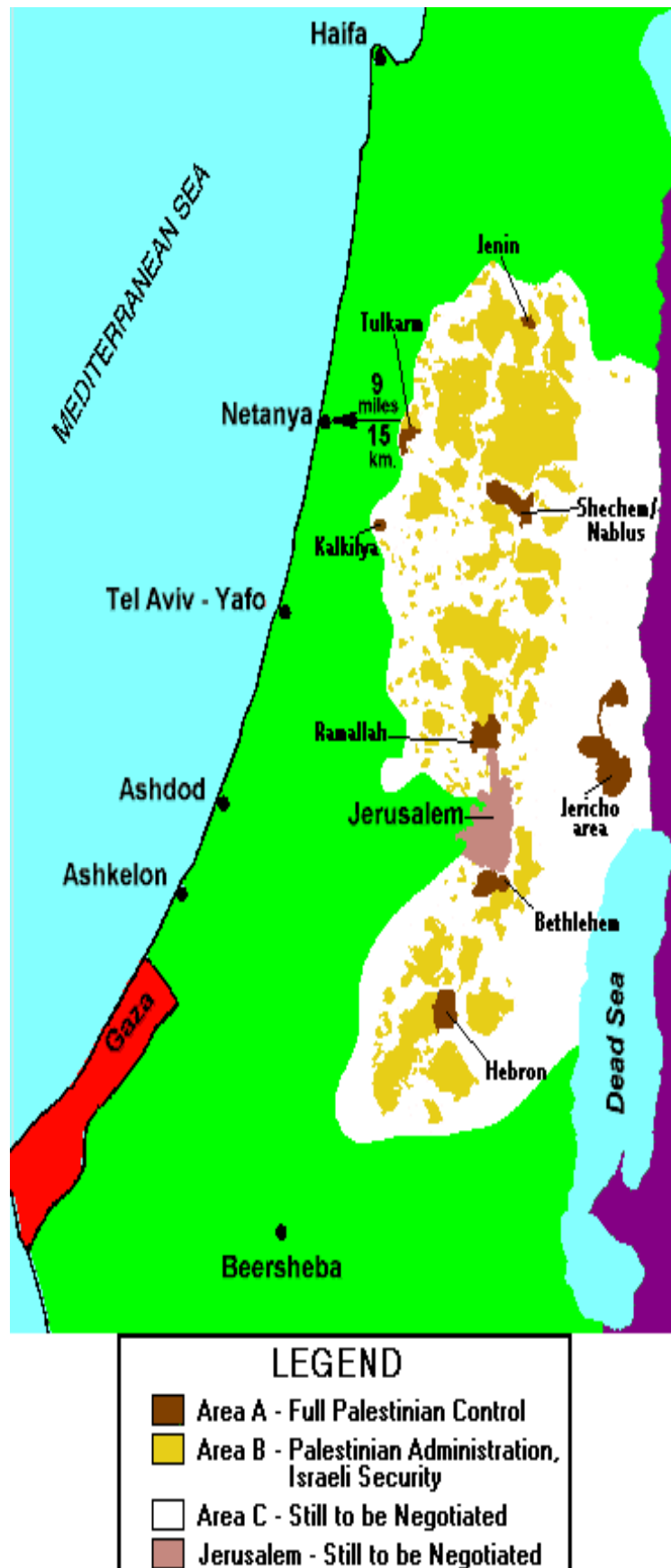
Figura 4. Áreas propuestas por Oslo II