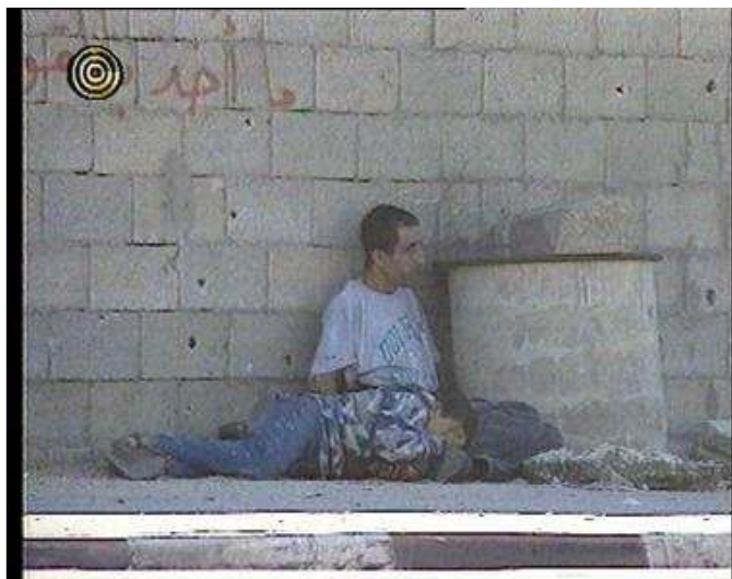
Fig. 6 Icono palestino de la segunda intifada

La versión oficial ocupante hablaba del rebote o bala perdida. Esto es chocante porque Israel estaba preparado para cualquier contingencia, pues desde 1996, y en particular desde Camp David en julio de 2000, tenía un plan que aplicar-‘Campo de Espinas’— porque se daba por seguro que algún tipo de disturbios se produciría si había acuerdo final. 107