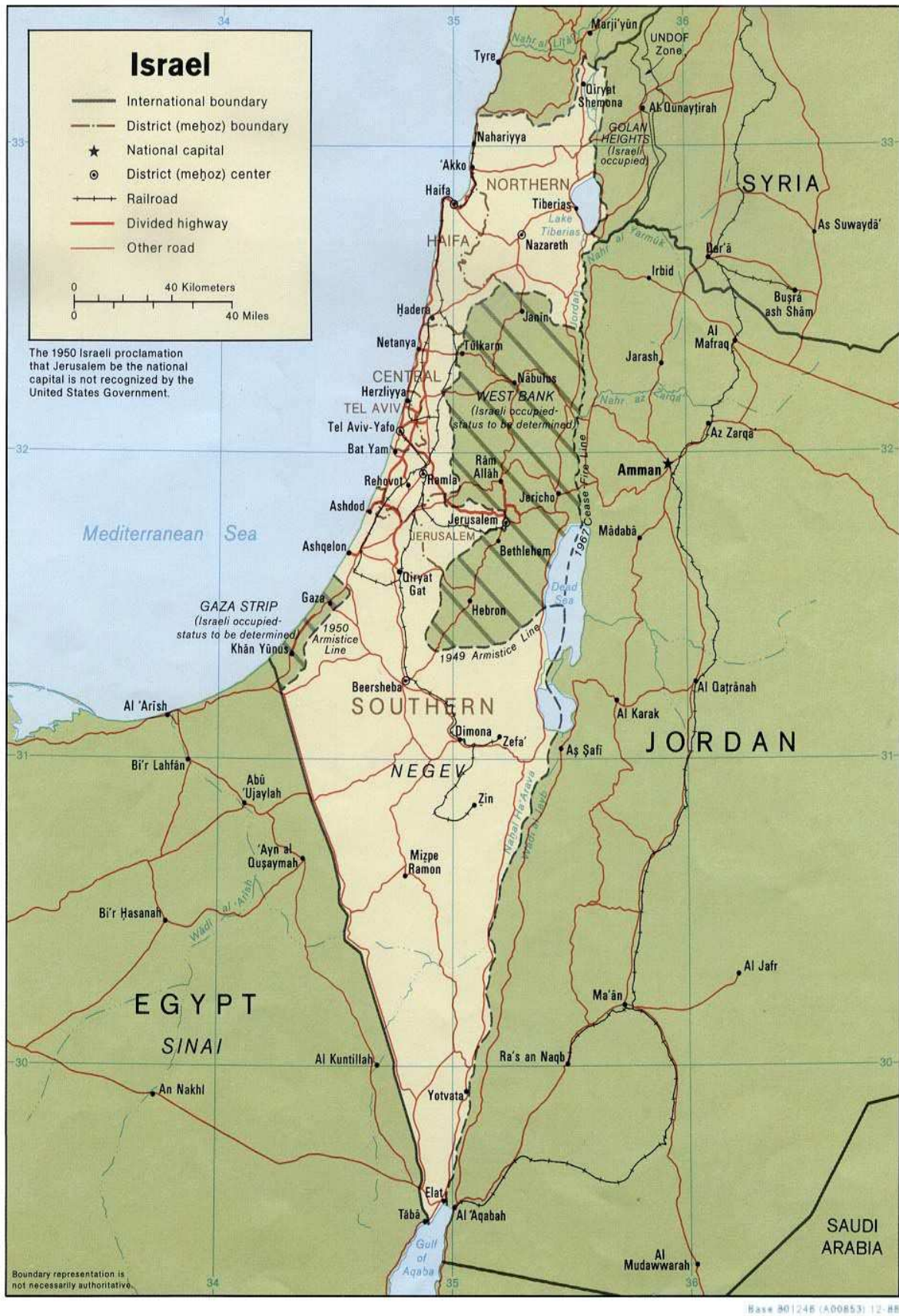
Figura.3. Los territorios ocupados.