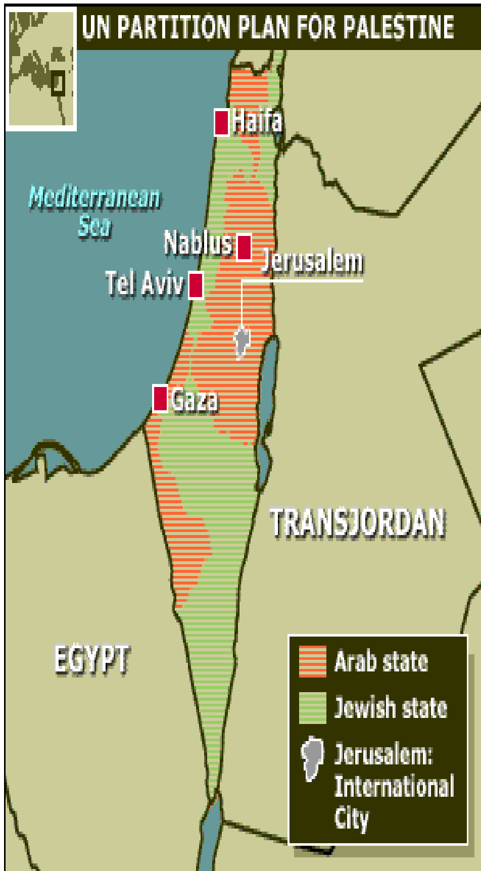
Figura 1. Plan de partici3n de Palestina