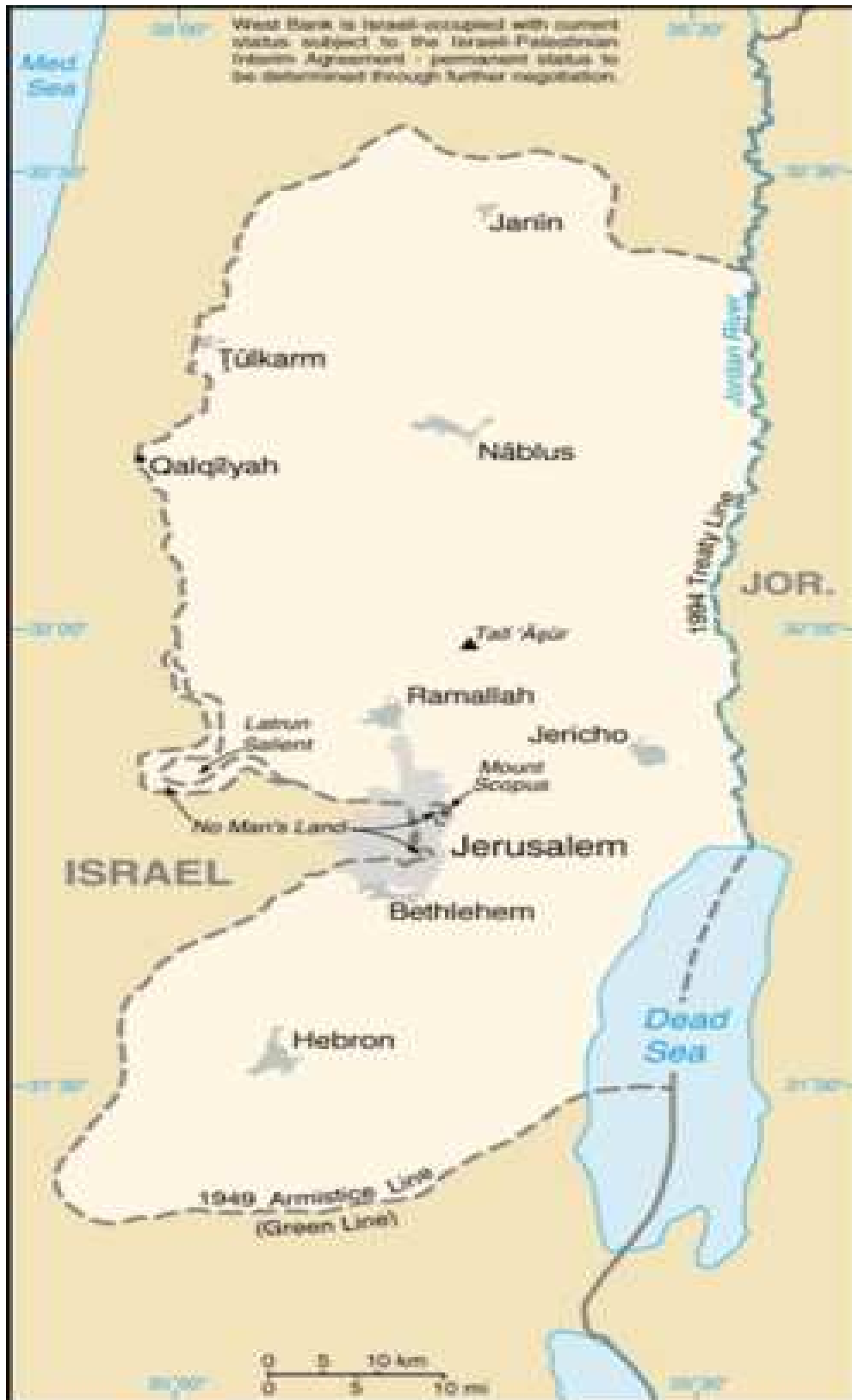
Figura 2 Ciudades de Cisjordania