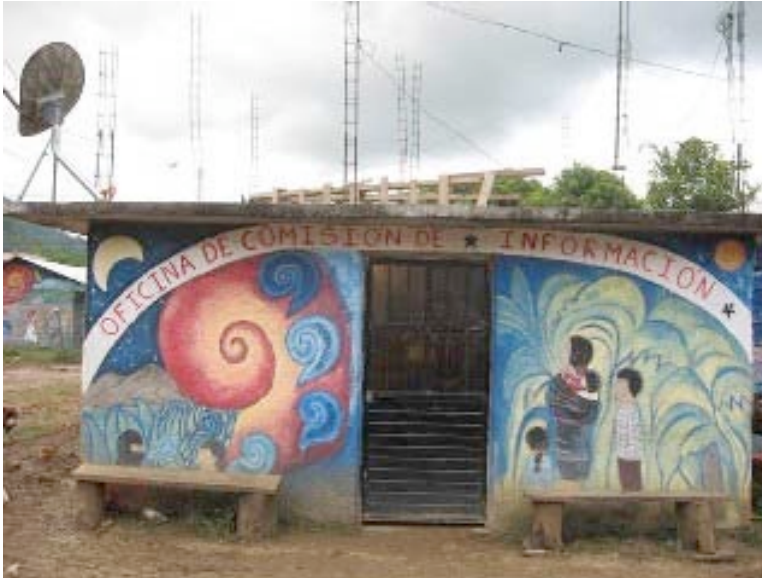
Oficina de la Comisión de Información. La Garrucha, Chiapas. Diciembre 2006

Existen grupos civiles y religiosos, así como organizaciones sociales y no gubernamentales que han ganado la confianza de las Juntas de Buen Gobierno y obtenido así la posibilidad de enviar y recibir información a través del internet.