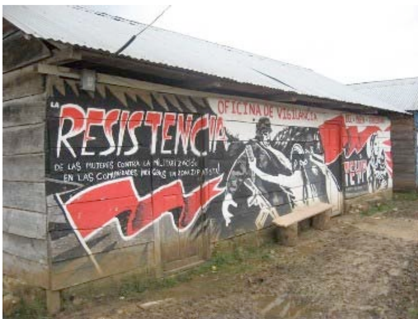
Oficina de Vigilancia del Buen Gobierno. Caracol de La Garrucha. Diciembre 2006

Al recibir nuevas propuestas, las autoridades de la Junta de Buen Gobierno establecen un plazo para deliberar sobre la conveniencia del ingreso en una u otra comunidad: se priorizan aquellas que requieren, según sea el caso, la implementación de algún proyecto en particular. Las autoridades de la Junta se ponen en contacto con los responsables regionales de salud, educación, etc., formadas por representantes comunitarios quienes conocen profundamente la problemática de los Municipios Autónomos y cada una de las comunidades.