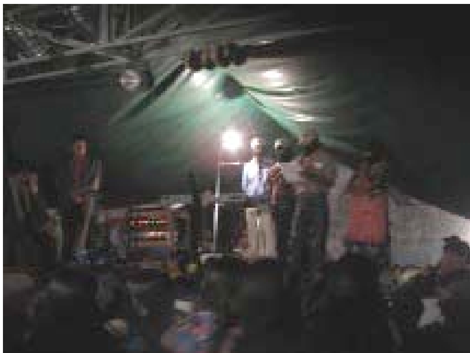
Discurso de la Junta de Buen Gobierno . Festejos por la Conmemoración de la fundación del EZLN. Caracol de La Garrucha 17 de noviembre de 2006.

En esas fechas y financiadas por la Junta de Buen Gobierno se realizan diversas actividades: de madrugada se canta el himno zapatista mientras son izadas la bandera de México y del EZLN por parte de las autoridades, a lo largo del día se llevan a cabo una comida, el baile, el torneo de básquetbol, y el torneo de ajedrez, en la noche, las propias autoridades dan discursos y entregan premios a los ganadores de los torneos.