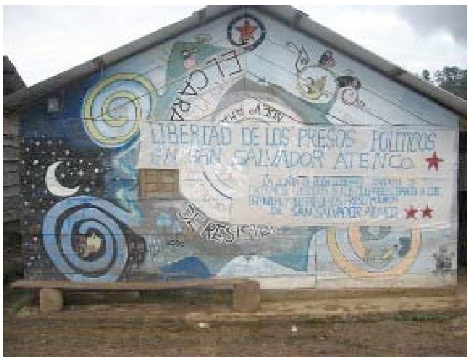
Edificio de la Junta de Buen Gobierno.

Es sede de la Junta de Buen Gobierno Zona Selva Tzeltal “Camino del Futuro” y de los cuatro concejos autónomos.