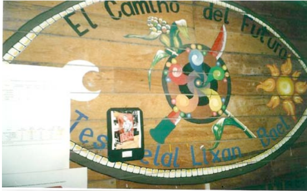
“EL Camino del Futuro”. Mural en el Interior de la Junta de Buen Gobierno. Caracol de La Garrucha, Chiapas. Diciembre 2006

Solamente en la instancia comunitaria y en los Concejos Autónomos pueden realizarse juicios y establecerse sentencias; la Juntas de Buen Gobierno no tiene entre sus responsabilidades la impartición de justicia.