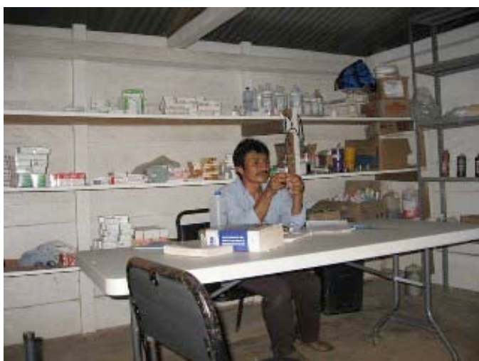
Microcentro y promotor de salud del pueblo.

El promotor de salud, por ejemplo, debe asistir con regularidad a la clínica del Caracol para recibir la capacitación necesaria. También participa en campañas de salud y vacunación en comunidades que carecen de promotor o microcentro de salud.