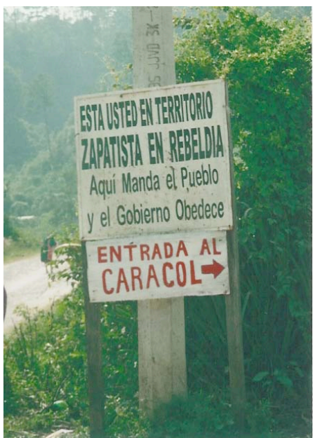
Entrada al Caracol III. A un costado de La Brecha. La Garrucha, Chiapas. Diciembre 2006

Los pobladores de la Vieja Garrucha, como fue el caso de diversas comunidades, se movieron con el objetivo de establecerse en un sitio de mejor acceso; lo hicieron a un costado de la Brecha, el camino de tercería que comunica a la ciudad de Ocosingo con la mayor parte de las comunidades de esa cañada, fundando así la Nueva Garrucha o La Garrucha, como se le conoce popularmente.