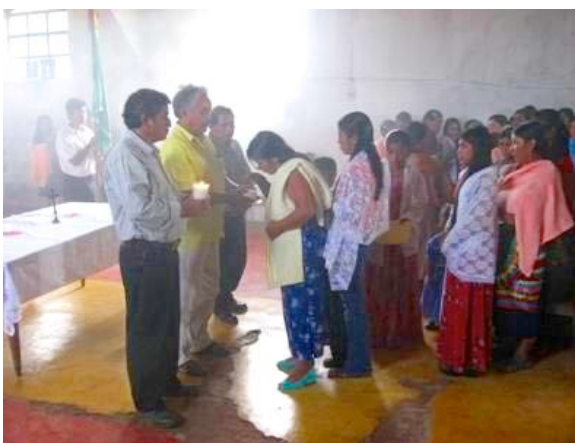
Principales de la comunidad en el rezo conmemorativo del 12 de diciembre.