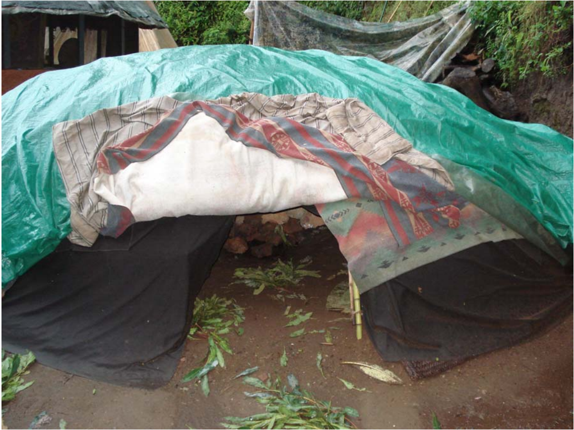
Inipi construido con varas de carrizo y cubierto con lonas y cobijas, localizado en “la puerta” Amatlán, Mor.