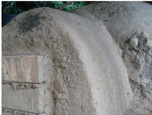
Tronera de un temazcal tradicional en Amatlán