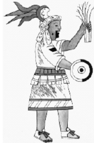
Temazcaltoci, la patrona de los baños de temazcal. (Rojas, 2002:13)

representación de los principios de la dualidad universal que recuerda al ying-yang oriental, lo cual apoya una hipótesis que cree que Temazcaltoci no es sino una manifestación de Omecíhuatl, mujer de la dualidad, pareja de Ometecuhtli.