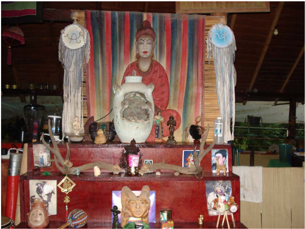
Altar en "La puerta" Amatlán de Quetzalcóatl