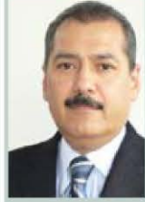
PRESIDENTE Manlio Fabio Beltrones Rivera PRI