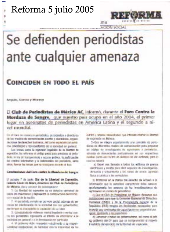
Reforma 5 julio 2005