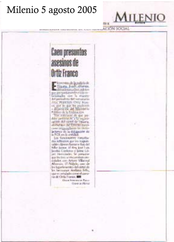
Milenio 5 agosto 2005