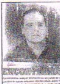
El Prof. AFI y el Ejército buscan al periodista.

Una vez se obtuvieron resultados negativos en la Procuraduría General de la República (PROFGR) por la búsqueda del periodista reportero que fue asesinado el pasado 12 de febrero en un momento en el que se encontraba entrevistando a dos presos. Las autoridades de la Secretaría de Gobernación, a través de la Procuraduría General de la República, han iniciado una investigación para determinar si se trata de un crimen relacionado con el tráfico de drogas. Según reportó el periódico "El Universal", la reportera había estado entrevistando a dos presos, uno de ellos, un comandante de un grupo de narcotraficantes, cuando fue atacada por picahielos que entraron al penal. Los autores del crimen fueron identificados por la policía y se les atribuye la responsabilidad del asesinato. La reportera había estado entrevistando a dos presos, uno de ellos, un comandante de un grupo de narcotraficantes, cuando fue atacada por picahielos que entraron al penal.