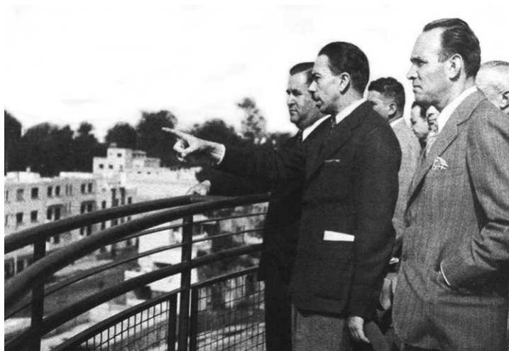
Manuel Ávila Camacho, Gustavo Baz y Salvador Zubirán en 1941, publicada en Doctor Salvador Zubirán . 50 años de vida profesional.

E n l o s últimos años de la década de 1940, el entonces rector, doctor Salvador Zubirán (el rectorado fue de marzo de 1946 a junio de 1948), comisionó un grupo