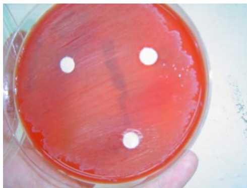
Fig. 5 Cultivo bacteriano en gelosa sangre y sensidisos embebidos en Microcyn 60.

Una vez efectuado este procedimiento, se llevaron las cajas a una estufa de cultivo a una temperatura de 37° C por 24 horas al término de este tiempo se midió el tamaño de los halos de inhibición de cada uno de los sensidisos, con una regla y se anotaron en la bitácora, con estos datos se efectuaron los datos estadísticos de Anova al .05.