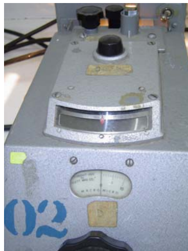
Fig. 2 Nefelómetro, mide la concentración por densidad óptica.

Preparación bacteriana a la escala de McFarland al 0.5: