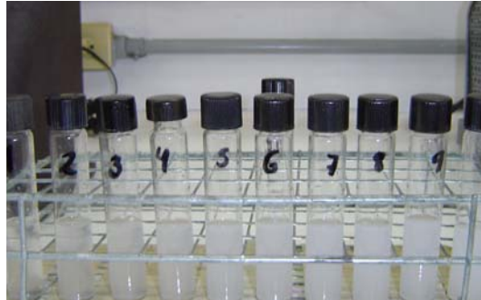
Fig. 1 Tubos preparados a la escala Macfarland.

Las lecturas obtenidas del nefelómetro se convierten a unidades Klett y su formula es la siguiente: 1 \text{ unidad Klett es igual a } \frac{*DO}{=.002}=1 \text{ Klett} cuadro 2 (anexos).