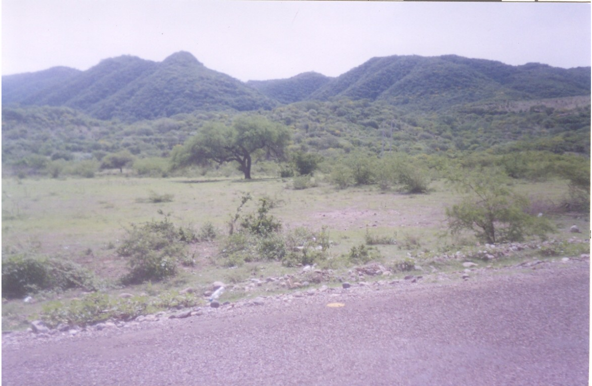
Figura No. 1. Paisaje típico de la zona mixteca

En Oaxaca, La Mixteca ocupa 189 municipios de los distritos de Silacayoapan, Huajuapán, Juxtlahuaca, Coixtlahuaca, Nochixtlán, Teposcolula, Tlaxiaco, Putla y Jamiltepec; y 14 municipios más que pertenecen ocho a distritos de Cuicatlán, dos a los de Zaachila, uno a Sola de Vega, dos a ETLA y uno a Juquila.