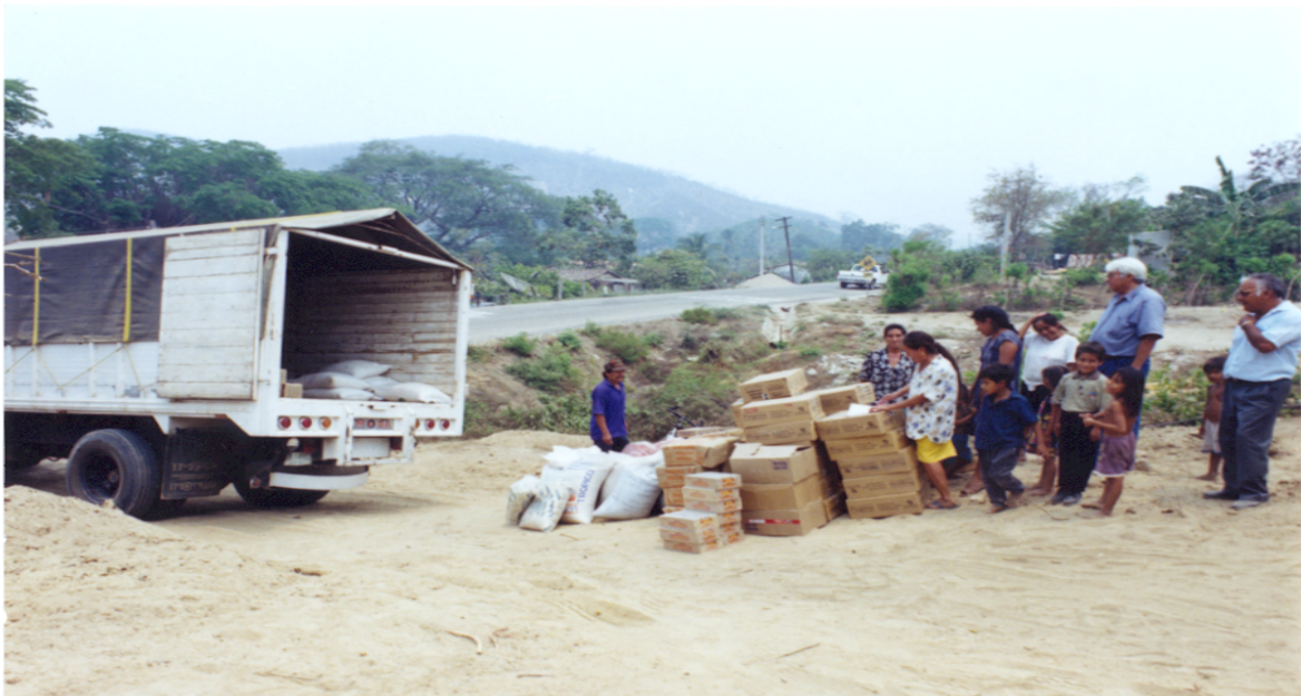
Figura No. 3. Transporte de los alimentos hasta la población correspondiente.