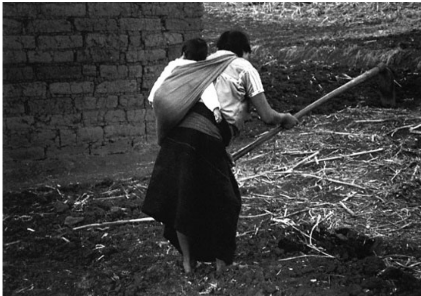
Figura No. 2. Condiciones socioeconómicas de la región de estudio.

Otras dos carreteras importantes que permitieron disminuir el grado de aislamiento y aprovechar los recursos naturales de esas zonas son los tramos: Ciudad de Tlaxiaco-Santiago Yosondúa, con proyección a la carretera Oaxaca de Juárez-Puerto Escondido, vía Sola de Vega y Huajuapán de León-Mariscala de Juárez, con proyección hacia el circuito Santiago Tamazola, Yucuyachi, Silacayoapan.