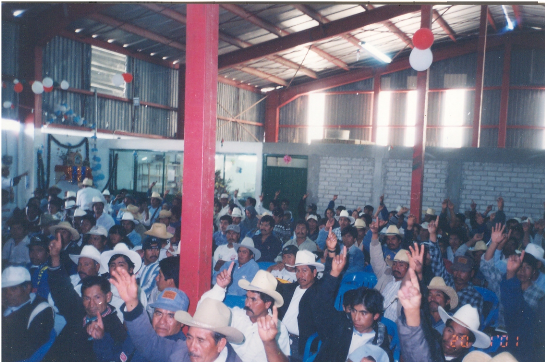
Fig. 8. Asamblea de Consejo Comunitario de Abasto que cuenta con representación Jurídica.

Es la reunión de todos los socios (presidentes de los comités) de las comunidades que son atendidas por un almacén rural, encargados de tiendas, autoridades municipales, demás integrantes de los comités, trabajadores comunitarios y personal DICONSA que labora en el almacén y funcionarios de DICONSA de la Unidad Operativa o Sucursal.