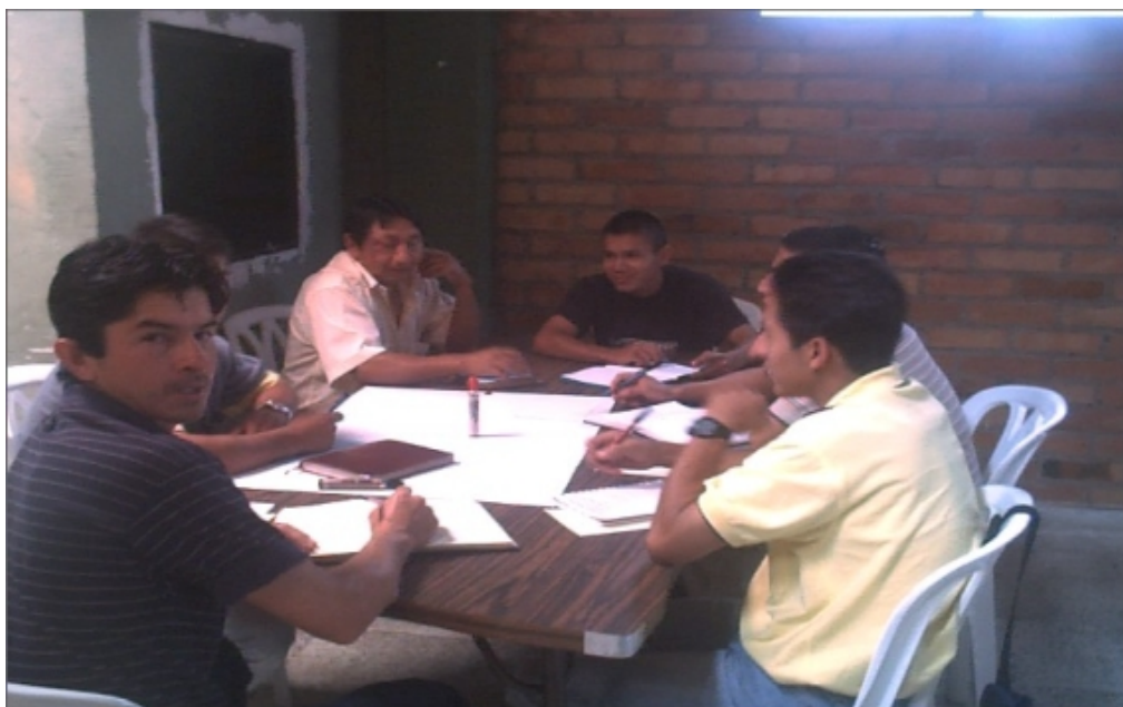
Fig. 7. Comité Rural de Abasto es un grupo de personas elegidas democráticamente.

Sus funciones y responsabilidades son las siguientes: