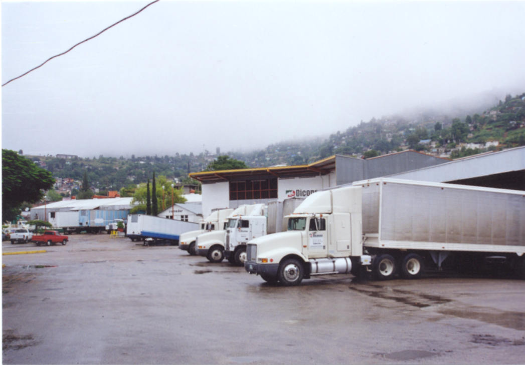
Figura No. 4 Infraestructura de Diconsa.