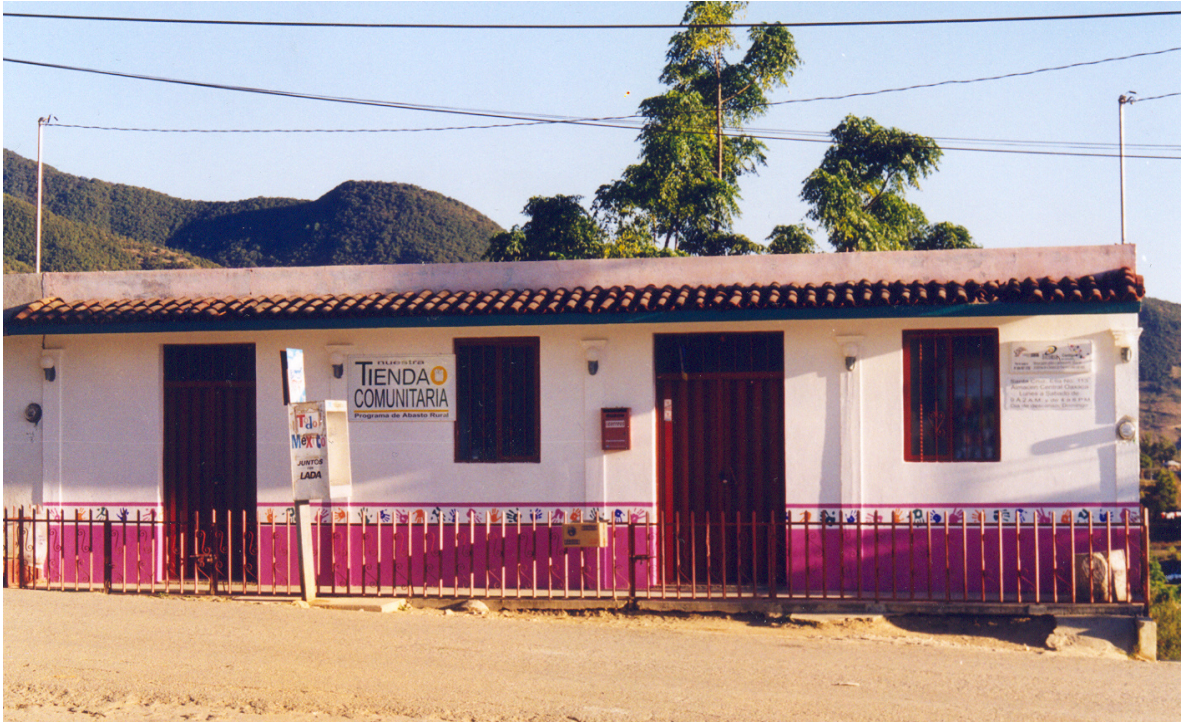
Fig. No. 5. Tienda Comunitaria.

4.3.2.3. El Personal de Diconsa que labora en el Almacén Rural, realiza supervisiones para que se tenga en orden el acomodo de mercancías, los preciadores y lamina de básicos con el precio oficial, practica auditorias para verificar la existencia del capital de trabajo y promueve la participación comunitaria a través de asambleas comunitarias, reuniones con consumidores y con las autoridades del lugar, entre otras varias actividades.