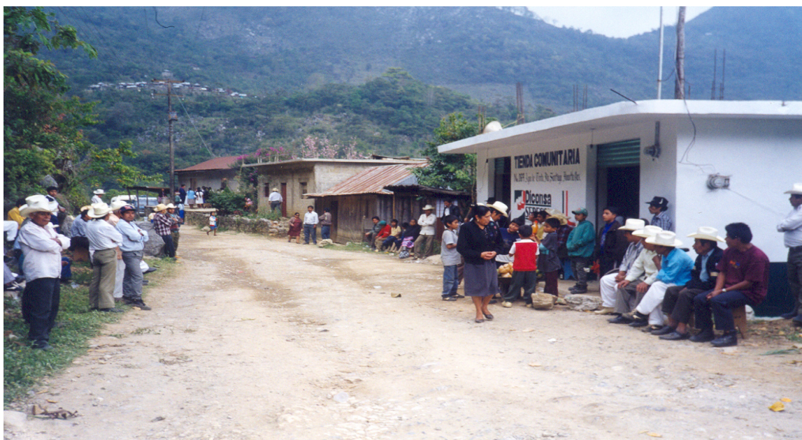
Fig. 6. Personas que constituyen la Asamblea Comunitaria que es el máximo órgano de decisión en la comunidad con relación al Programa de Abasto Rural.

a) Asamblea Comunitaria.- Se define como la reunión de personas mayores de edad de la comunidad donde funciona una tienda rural, en donde se analiza, evalúa y toman decisiones en torno a la operación del Programa Rural de abasto y constituye el órgano máximo de decisión de la comunidad con relación al Programa Rural.