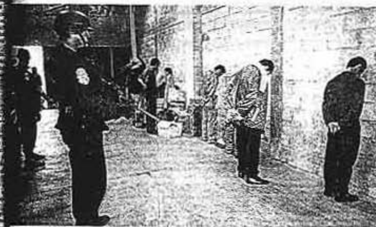
METRALLETA en mano, policías vigilan a detenidos en una bottega de Tepito