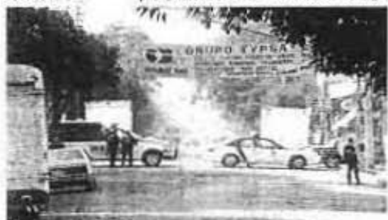
ELEMENTOS DE diversas corporaciones policíacas mantuvieron ayer prácticamente sitiado Tepito, ante el temor de que vandálicos volvieran a ocasionar destrozos y robo a transportistas y ataques a establecimientos comerciales, como ocurrió la noche del jueves.