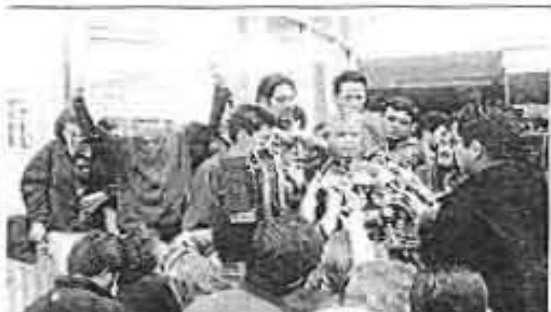
FAMILIARES DE los custodios del penal federal de máxima seguridad de Puente Grande, detenidos por la fuga del narco traficante Joaquín Guzmán Loera, de mandatos prescriben de los vándalos vándalos de la CDHDF para que éstos se desistieran de sus demandas.

Señala a que la Presidencia de Derechos Humanos del Estado Federal (CDHDF) niega haber solicitado un trato con "delicadeza" a los detenidos de Tepito.