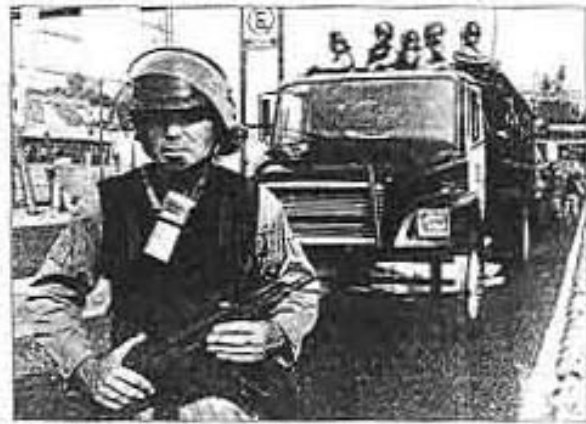
Patrulla de un vehículo con elementos de la Policía Federal Preventiva por la zona de Tepic, ayer