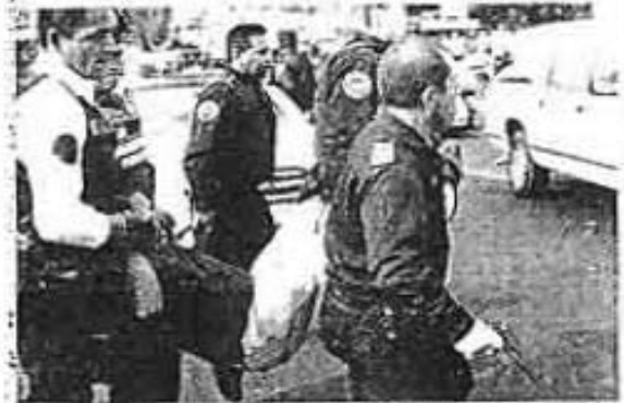
PERSONAL DEL cuerpo de granaderos trasladan a un detenido, ayer en la colonia Morelos, a quien responsabilizan de ocasionar cuantiosos daños materiales a vehículos particulares y públicos.