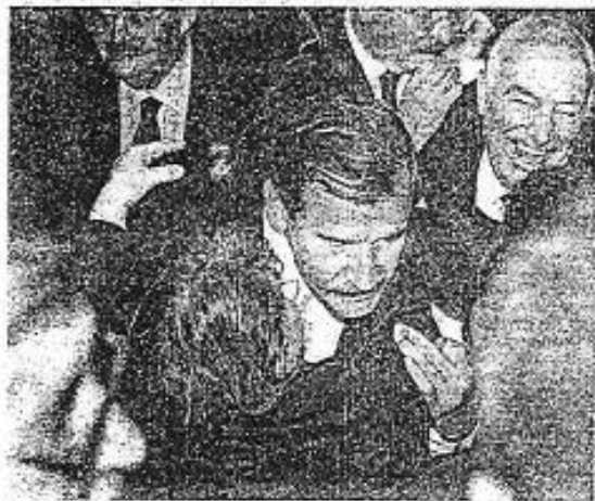
Participación del presidente electo Vicente Fox en el congreso sobre discapacitados, efectuado ayer.

con Discapacidad Intelectual, y en el cual se dijo "satisfecho" por la decisión de los diputados, que aprobaron en comisiones la creación de la nueva secretaría. Asimismo, confirmó que durante su sexenio contará con el apoyo de siete coordinaciones especiales que despojarán desde Los Pinos y que se convertirán en