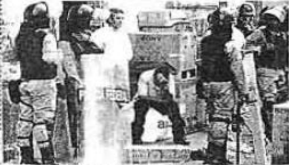
ASISTENTES de la Policía Federal Preventiva custodian parte de la mercancía que ayer fue decomisada en la Plaza Meave, donde se clausuraron 20 bodegas repletas de aparatos electrónicos y electrodomésticos y otros artículos presumiblemente de contrabando.