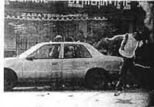
EL VEHICULO que se aprecia en la gráfica de Emilio Razo, fue volcado varios sujetos que ayer pusieron en apuro a ese vecindario.