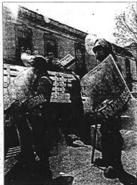
Efectivos de la Policía Federal Preventiva durante el operativo en la Plaza Meave

■ La inspección duró cuatro horas; saldo blanco, reportó el titular de Seguridad Pública capitalino