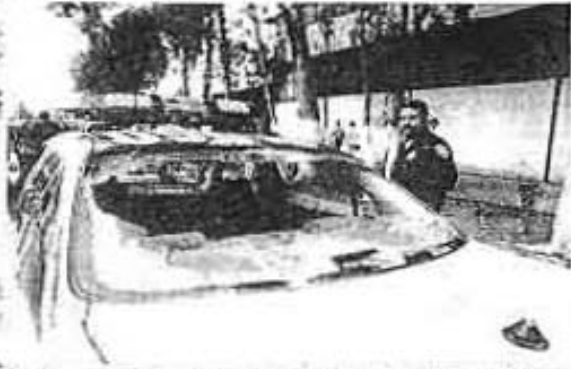
POR LO MENOS 35 vehículos, entre ellos esta patrulla, fueron dañados por los vandales que arremetieron, en Tepito, contra conductores y transportistas.