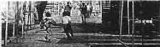
PEQUEÑOS DEL barrio de Tepic, ante la inactividad registrada en la población zona comercial, se dieron al lujo de jugar sin temor a sufrir algún accidente, ya que la zona fue cerrada al tránsito vehicular (Foto de Emilio Ruz).