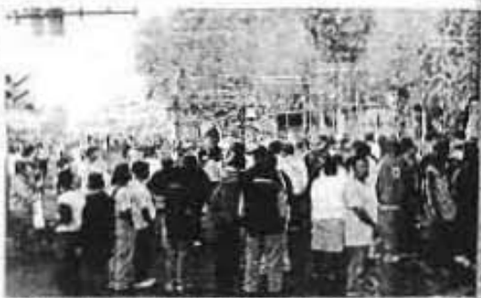
COMERCIALES ORGANIZADOS de Tepito se reunieron, ayer en la mañana, en el congreso del barrio para exigir al GDF, PGJDF y SSP mayores garantías de seguridad para desempeñar normalmente sus actividades.

"Vamos a sacar a los vendedores puros de Tepito y recuperar nuestra dignidad y prestigio. No somos delincuentes ni viciosos, sino personas de trabajo que luchamos