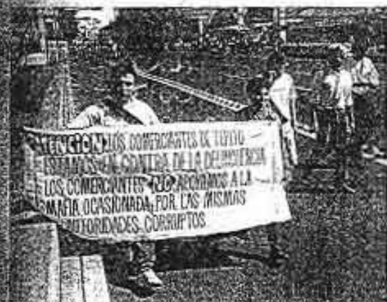
Los comerciantes de Tepito se manifestaron ayer contra los acciones policíacas.

En la mañana del jueves, los contingentes de la zona de Tepito, para discutir que la intervención de la policía que hay en la zona.