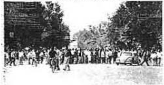
LAS PRINCIPALES calles de Tapitú fueron cerradas al tránsito vehicular luego de que decenas de jóvenes, incógnitos que los inspectores realizaron a las bodegas de la zona, agredieron a autoridades y lesionaron todo tipo de vehículos.