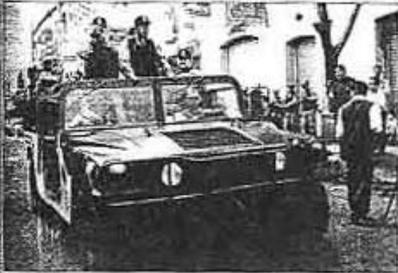
Operativo efectuado ayer por la Policía Federal Preventiva en busca de mercancía ilegal en un mercado y bodega de las alabardas de Plaza Morelos

Mencionó que a otros detenidos se les precisó un crimen vehicular que resultó positivo por momento de captura, además que algunas víctimas los han reconocido. En tanto el jefe de gobierno del DF, Andrés Manuel López Obrador, mencionó a la Secretaría de Hacienda que en lugar de hacer operativos en Tepic le envía a las fronteras y limpia de corrupción las aduanas.