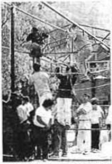
APoyados por los compañeros de actividades, miembros organizados de Tepic restauraron los locales, los que fueron semidestruidos por vándalos la noche del jueves.