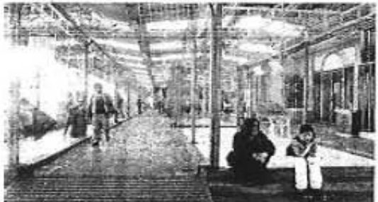
FRUSTRADOSAMENTE DOS empleadas de este local esperaron a que los dueños mismo reanudasen sus actividades; los localeros suspendieron "indefinidamente" sus labores, en demanda de ser escuchados por autoridades del GDF.