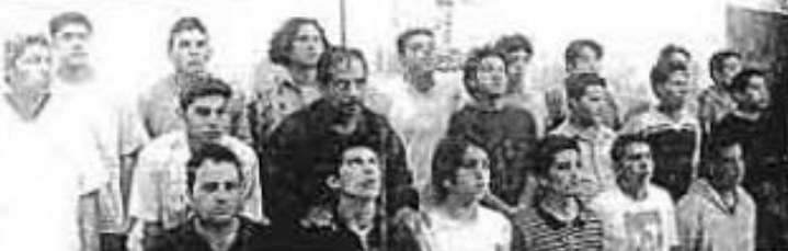
LA PROCURADURIA General de Justicia del Distrito Federal, presentó a parte del grupo de vándalos que aprehendieron a conductores de vehículos en la zona de Tepito, luego del operativo "antifurto", y quienes les fueron consignadas seis cargas de robo y daño en propiedad ajena.