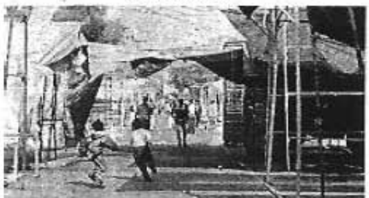
VECINOS DEL barrio de Tepito, ante la inactividad registrada en la población comercial, se dieron al lujo de jugar sin temor a sufrir algún accidente, ya que la zona fue cerrada al tránsito vehicular.