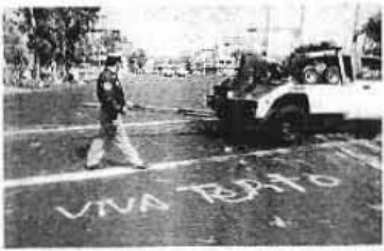
LA MAYORÍA de las vías de acceso a la zona comercial de Tapito fueron bloqueadas por personal de la SSP y de la PJDF para resguardar la zona, donde la tranquilidad volvió, relativamente, la tarde de ayer.

Gazal destacó que los principales botequeros de la zona de Tapito que se localizan en los calles de: Días de Lodo, González Ortega, Florida, Caridad, Arce y Tenochtitlan, Barrios de los Cuates, Tlaxiotes, Elvira, Padilla y otras áreas adonde, "no las ha tocado la policía", insistió.