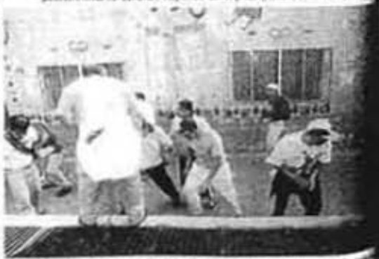
EN ESTA gráfica se evidencia la violencia urbana, luego actores, según se muestra en fotos anteriores.