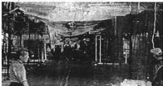
LOS VECINOS del barrio caminaban por las calles de Tepito, donde unos 10 mil comerciantes suspendieron sus actividades ante la inseguridad que reina en la zona, la que ha sido "invasada por delinquentes de otras delegaciones totalmente a los tepiteños, gente honesta y trabajadora" (Foto de Emilio Razo).