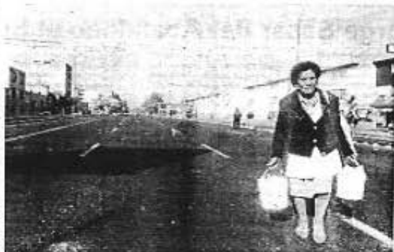
SOLITARIAS AMANECIERON las calles de la colonia Morelos; sólo contadas mujeres, como se aprecia en la gráfica de Emilio Razo, salieron de sus casas para comprar alimentos; el transporte también se suspendió.