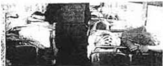
DE ESTA forma fueron llevados a la VII agencia 20 detenidos por los hechos vandálicos en Tapitú, donde personal policiaco y hacendario clausuraron varias bodegas donde se ocultaba contrabando.