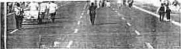
ANTE LA FALTA de transportes en Tepic decenas de habitantes tuvieron que recorrer largas distancias para abordar camiónes, microbuses o taxis que los lleva a escuelas, oficinas y a diversos lugares; la inseguridad en el barrio quedó paralizada.