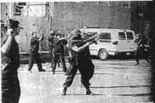
LOS POLICIAS buscaron sus armas y apuntaron, pero nunca dispararon; posteriormente salieron fugando de Tepito.