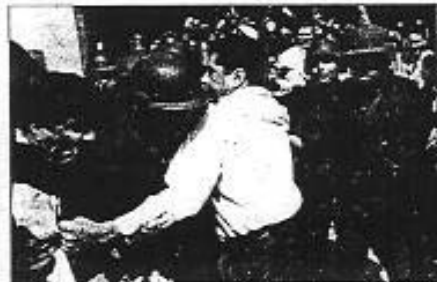
Algunos comerciantes de Tepito se opusieron a la revisión de su mercancía por parte de personal de Aduanas

Por la tarde, el secretario de Seguridad Pública federal, Alejandro Gertz Manero, entrevistado después de una reunión que sostuvo con el jefe de Gobierno del Distrito Federal, Andrés Manuel López Obrador, consideró que hubo saldo blanco en el operativo realizado ayer en Tepito, y añadió que elementos de la PFP intervenirán “cuantas veces lo soliciten” las autoridades hacendarias para combatir el contrabando, ya sea en esta ciudad o en otra entidad del país.