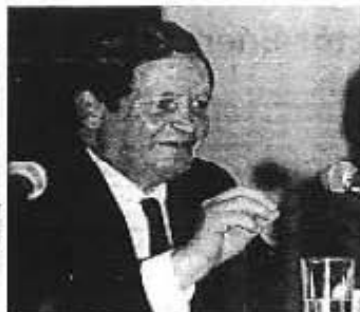
EL PROCURADOR capitalino, Samuel del Villar, en conferencia de prensa, dio a conocer los pormenores de los operativos en Tepito, los que calificó de positivos ya que permitieron garantizar la seguridad y derechos de comerciantes, transeúntes y vecinos.