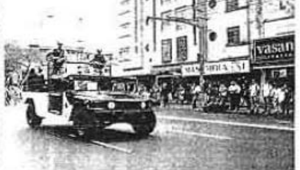
AL EFECTO de evitar hechos violentos en la zona, personal de la FFP patrulló por varias horas las inmediaciones de Plaza Meave, donde se arrojó a 20 combatientes que se presume ingresaron legalmente al país aparatos electrónicos.