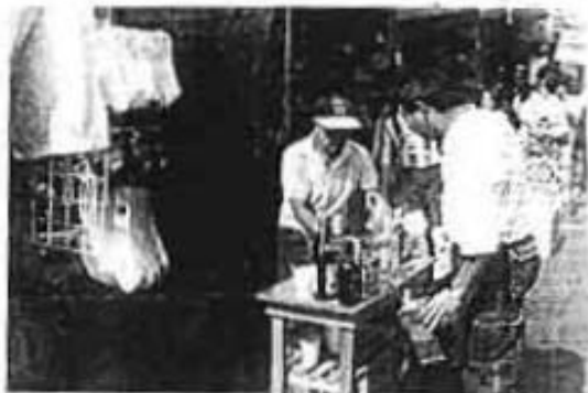
MAYORÍA EN Tepic destilan, empaquetan y comercializan bebidas alcohólicas adulteradas, trabajando de manera impune.