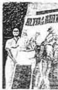
ALTO A la música de fondo México frente a la embajada de GUSTAVO HOD