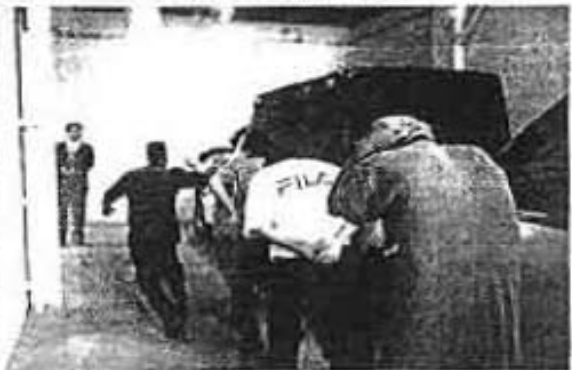
ESCOLTADOS POR personal de la SSP varían jóvenes y ambulantes de Tapitú fueron llevados a la VII agencia donde rindieron declaración por los actos vandálicos en calles de esa zona.

A EFECTO de evitar hechos violentos en la zona, personal de la PFP patrulló por varias horas las inmediaciones de Plaza Masax, donde se arrestó a 10 comerciantes que se presume ingresaron ilegalmente al país aparatos electrónicos.