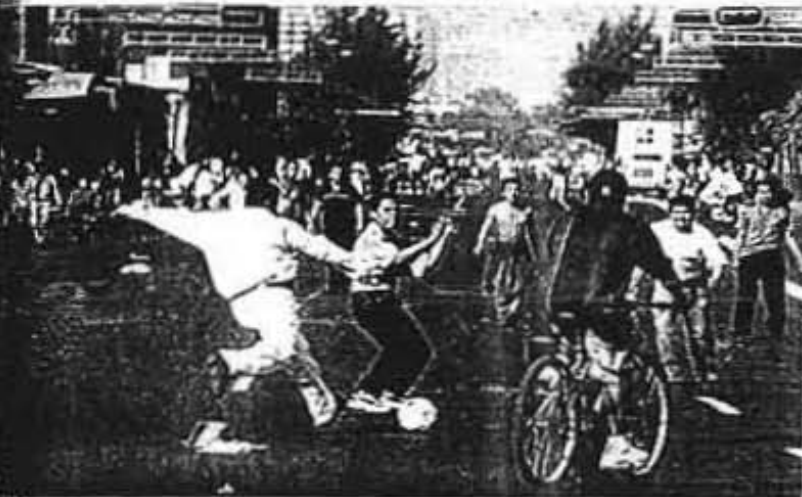
En Tepito la tensión después del enfrentamiento de policías y vendedores. Las calles vacías fueron interrumpidas como campos de fútbol por jóvenes y niños.