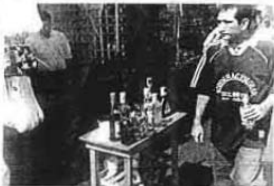
EN FORMA abierta en las calles del barrio de Tepic se siguen vendiendo bebidas alcohólicas adulteradas, que representan un alto riesgo para la salud.

Además, el día que se realizó el operativo se detuvo a tres personas que se dedicaban a la venta de bebidas alcohólicas en el municipio.