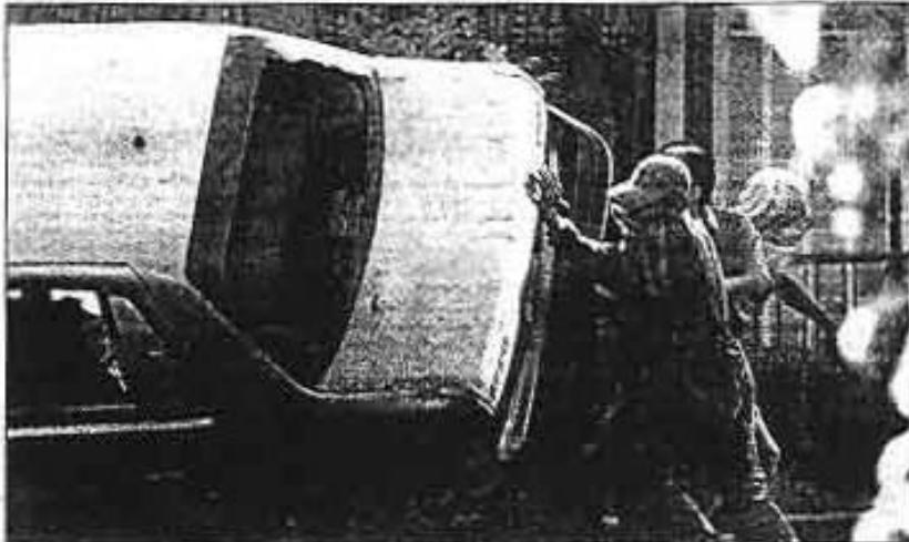
Comerciantes del barrio de Tepic destruyen una bomba luego de que agentes de la Policía Judicial ingresaron, mediante un operativo, a esa zona para desactivar mercancía de procedencia extranjera.

17:40 Retirada de los policías policíacos e ingreso de policía preventiva, granaderos y grías de la SSP para rescatar los vehículos dañados.