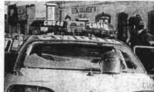
ESTA PATRULLA de la Policía Preventiva sufrió el embate de los vándalos y ayer se apoderaron de este tipo de Tepito y agredieron a la policía (hacer clic para ver foto de E. Razo)

Por su parte, Hugo Vera Reyes, subprocurador capitalino, en conferencia de prensa, aseguró que se actuó con estricto ape-