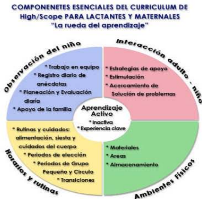
Fig. 1. Rueda del Aprendizaje

Cuando los niños tienen acceso al aprendizaje activo, concepto que sintetiza el tipo de experiencias que se quiere ofrecer, también acceden a un conjunto de experiencias clave para el desarrollo de la representación creativa, el lenguaje y la alfabetización inicial, la iniciativa y las relaciones sociales, el movimiento y la música, la clasificación, seriación y número, y las relaciones espacio temporales. El aprendizaje activo y las experiencias a las que da lugar constituyen la parte medular de la aproximación High Scope