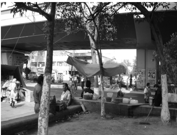
Alrededores del metro Canal del Norte

En el área de red social y salud comunitaria, EDNICA trabaja dentro de la