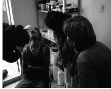
Niño de la calle en el consultorio medico de EDNICA

Cuando un niño de la calle se accidenta y ya son las cinco de la tarde, en un día que no hay actividad y no puede entrar al centro, el niño puede tocar y si ahí se le puede atender se hace, si no el educador lo debe acompañar al centro de salud, siempre hay alguien en el centro dispuesto a ayudar a los niños que lo requieran.