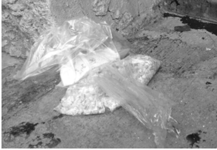
Bolsa de comida

- Voy con ellos allá con una señora que arregla zapatos o vende zapatos, pero nosotros le tenemos que llevar el huevo o el jamón o que con todo respeto la longaniza pa que nos haga y de ahí tenemos que comer pero como sólo somos tres nada más, no nos comemos todo.