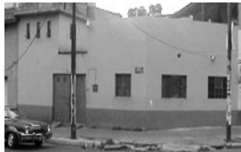
Centro Matlapa Morelos

Mientras hacemos el recorrido por la casa de EDNICA en la colonia Morelos, una casa sencilla, limpia con un ambiente de escuela y agradable para permanecer ahí, Roman Días platica que en la Colonia Morelos empezaron a trabajar literalmente en