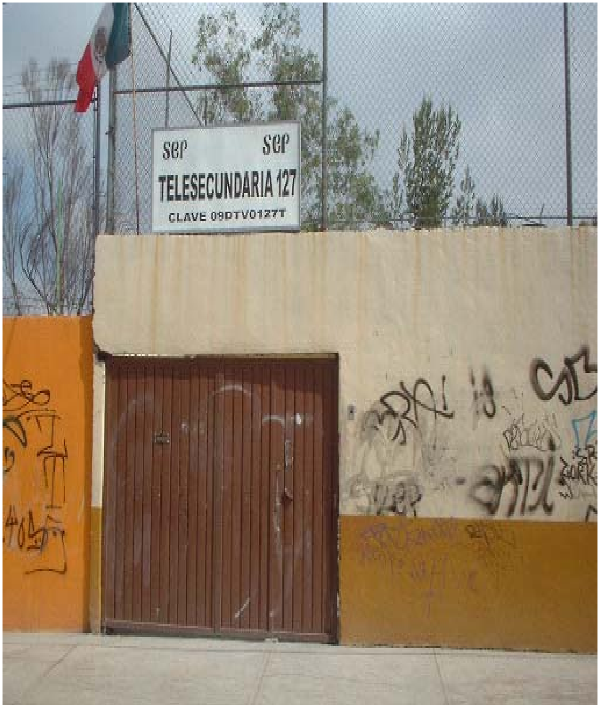
Fotografía de la fachada de la Telesecundaria 127