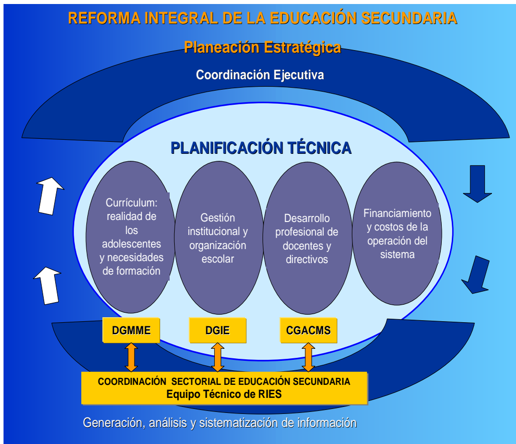
Planeación estratégica de la Reforma 12

Como en todos los proyectos que se realizan debe existir primero una planeación para ver qué se pretende, y de qué instancia dependerán los trabajos, el esquema siguiente nos indica a grandes rasgos que se pretende con la Reforma Integral de la Educación Secundaria.