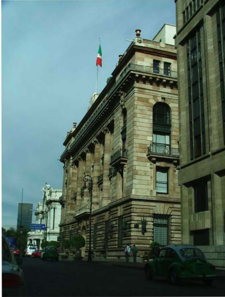
CINCO DE MAYO 2