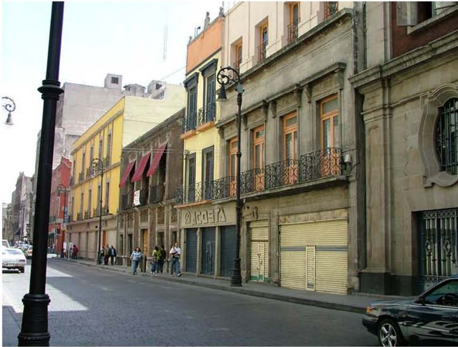
CASAS DE DEPORTE VENUSTIANO CARRANZA