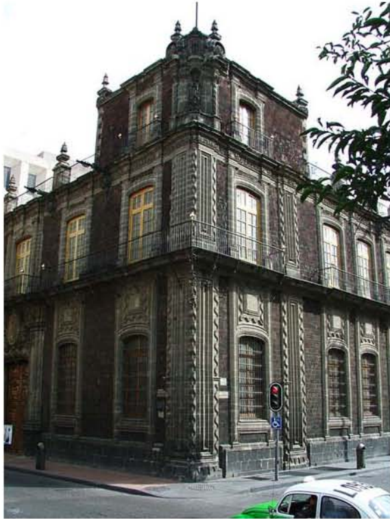
BANAMEX CASA CEDE VENUSTIANO CARRANZA E ISABEL LA CATOLICA