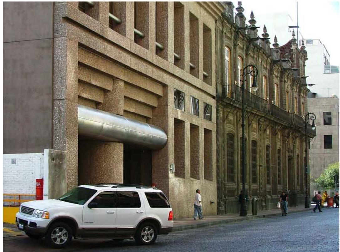
ISABEL LA CATOLICA