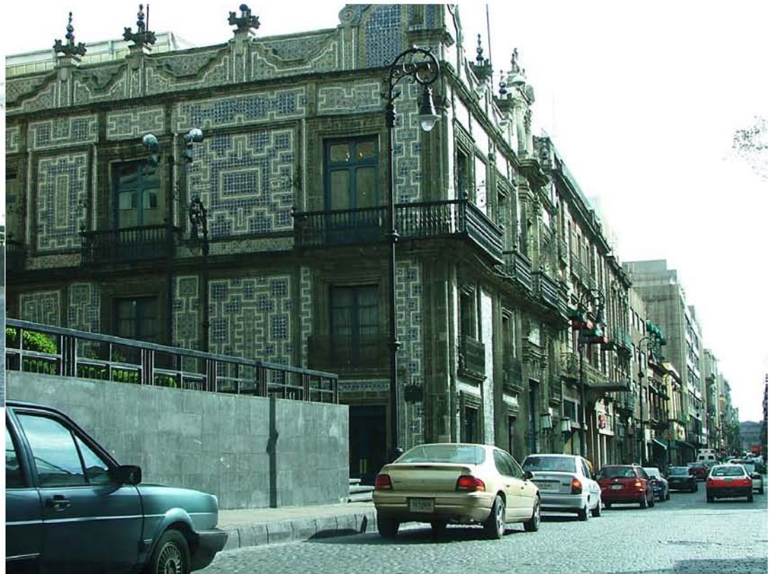
SANBORN'S CASA DE LOS AZULEJOS MADERO Y CALLEJON CONDESA