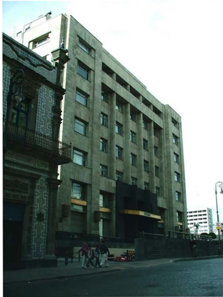
MADERO, EJE CENTRAL LÁZARO CARDENAS