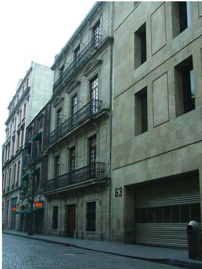
BANAMEX VENUSTIANO CARRANZA