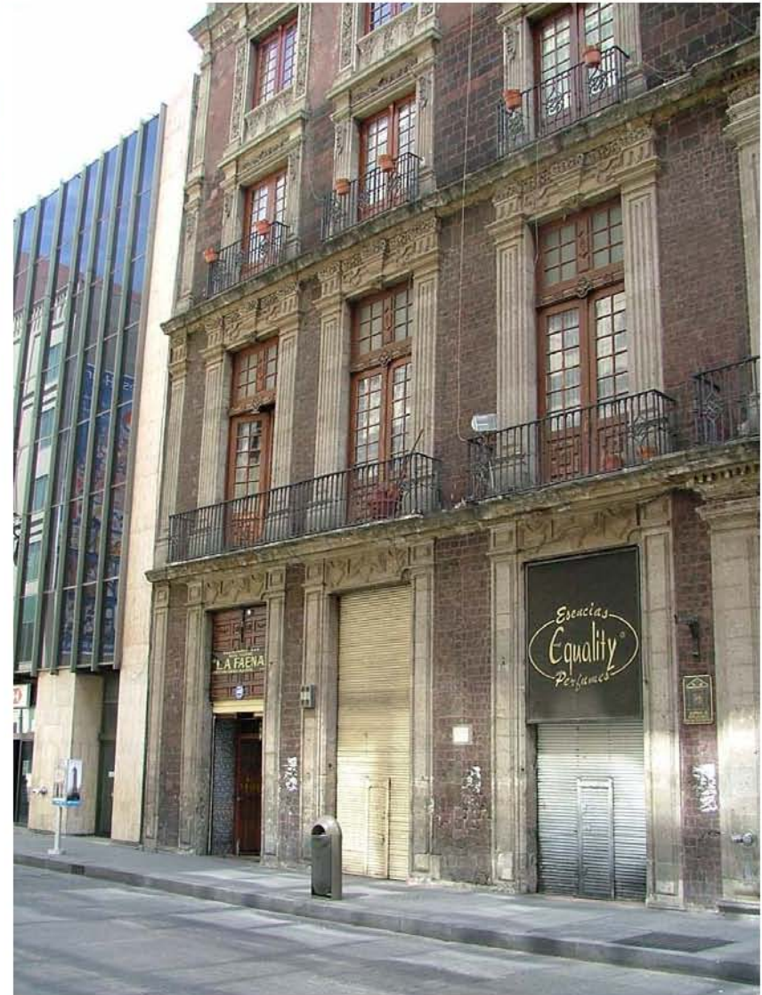
RESTAURANTE LA FAENA (CASA SEÑORIAL DEL SIGLO XVIII VENUSTIANO CARRANZA