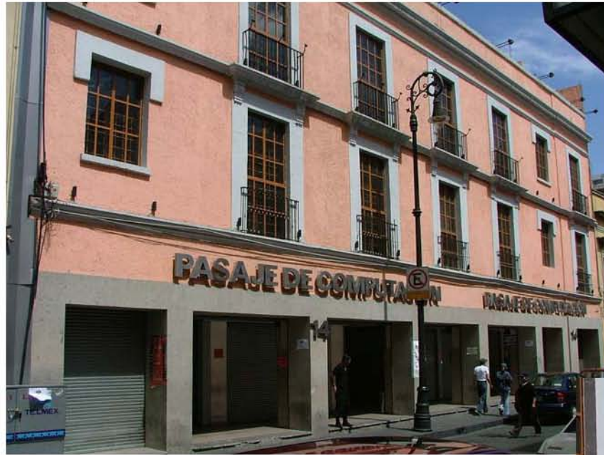
EDIFICIO NUEVO VENUSTIANO CARRANZA

GRUPO CIUDAD Y PATRIMONIO, S. A. Y GRUPO CIUDAD Y PATRIMONIO, A. C. ESQ. VENUSTIANO CARRANZA Y GANTE