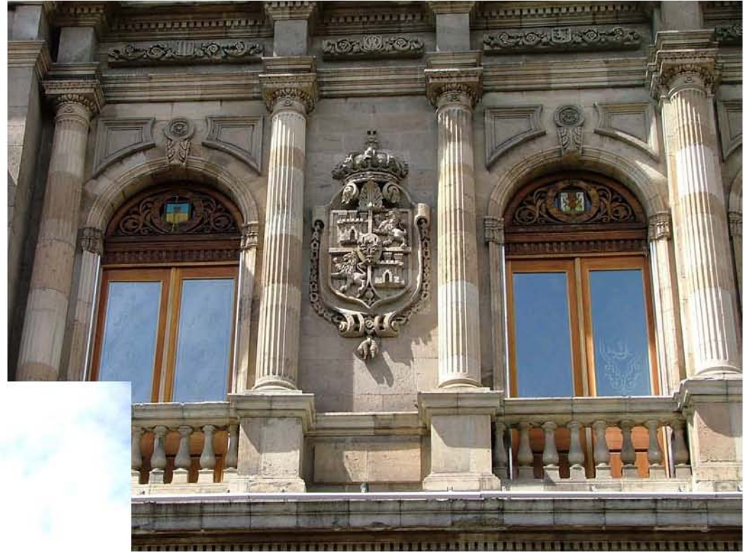
CASINO ESPAÑOL ISABEL LA CATOLICA