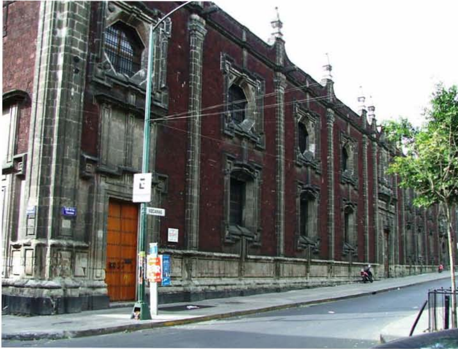
COLEGIO SAN IGNACIO DE LOYOLA (VIZCAÍNAS) CALLE DE MESONES