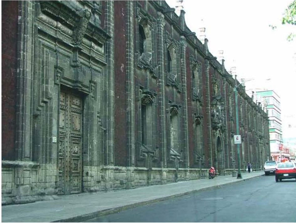
COLEGIO SAN IGNACIO DE LOYOLA (VIZCAÍNAS) CALLE DE MESONES