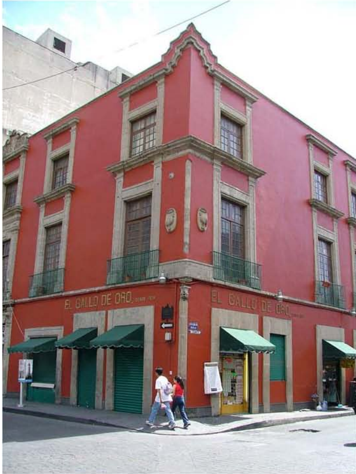
CANTINA EL GALLO DE ORO BOLIVAR Y VENUSTIANO CARRANZA