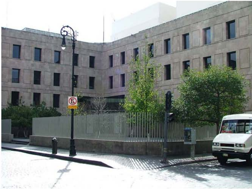
BANAMEX ( 1985-1986) EDIFICIO PLAZA DE LA BANCA VENUSTIANO CARRANZA E ISABEL LA CATÓLICA