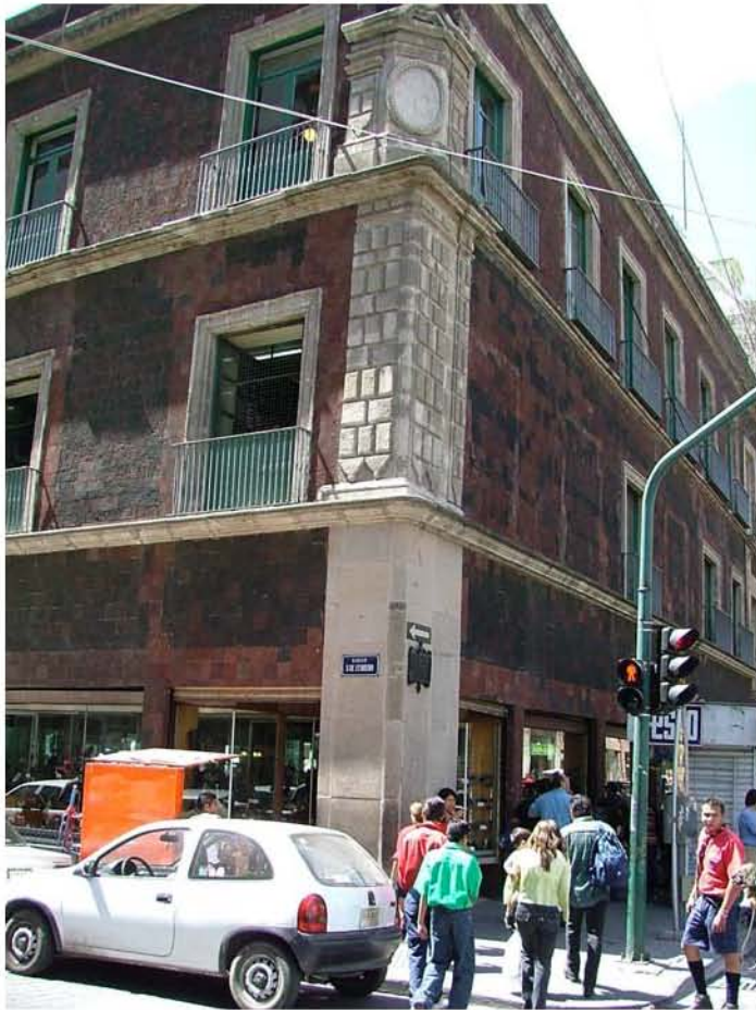
EL NUEVO MUNDO