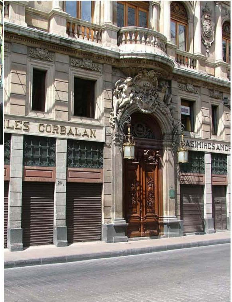
CASINO ESPAÑOL ISABEL LA CATOLICA