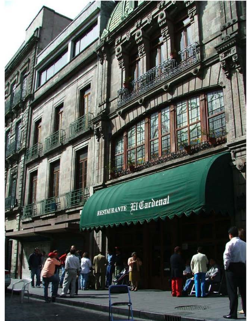
RESTAURANTE EL CARDENAL CALLE DE PALMA