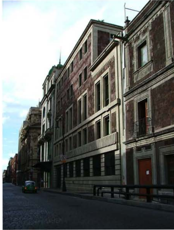
BANCO DE MEXICO BOLIVAR