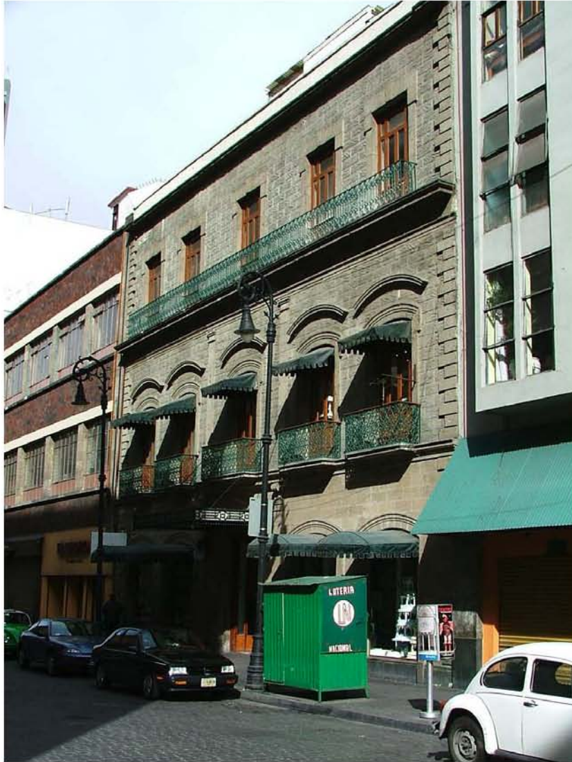
PASTELERIA "LA IDEAL" 16 DE SEPTIEMBRE