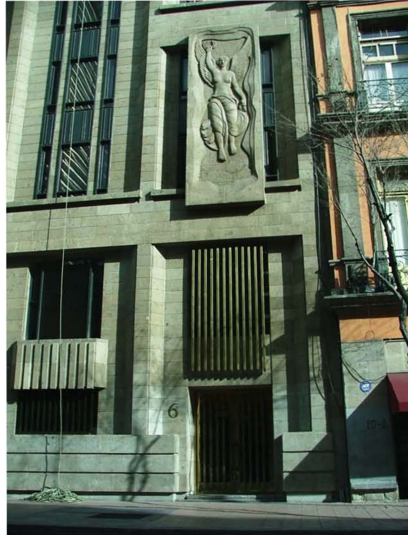
CINCO DE MAYO 6