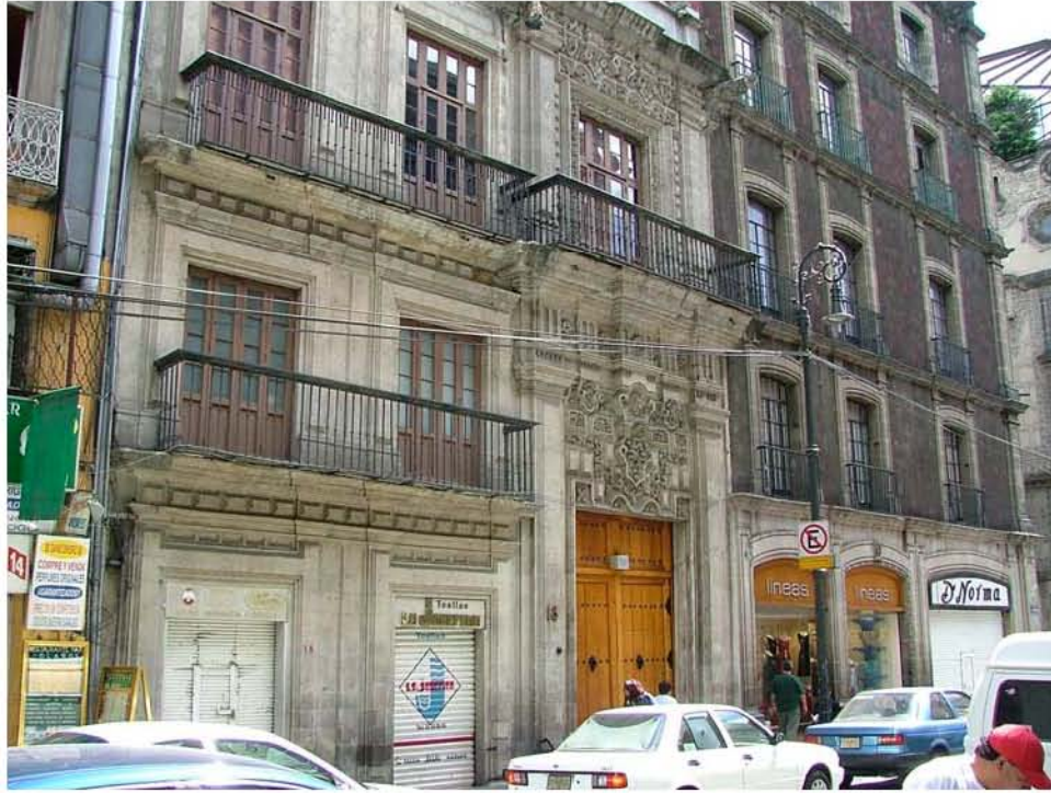
TOALLAS LA JOSEFINA CINCO DE FEBRERO