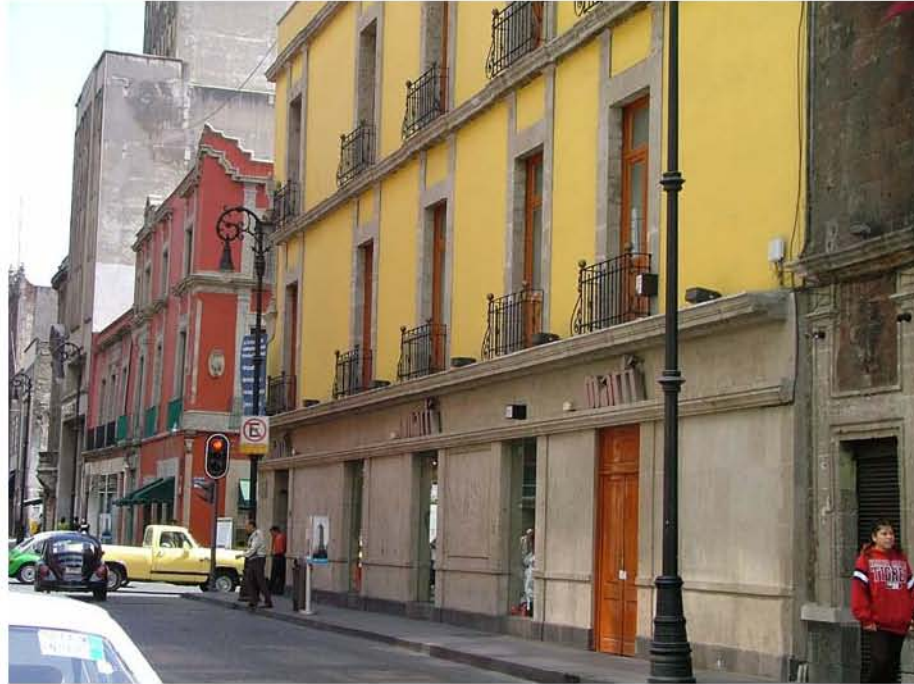
DEPORTES MARTI VENUSTIANO CARRANZA Y BOLIVAR