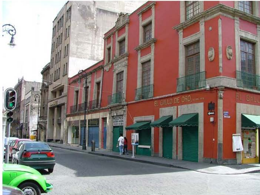
CANTINA EL GALLO DE ORO BOLIVAR Y VENUSTIANO CARRANZA