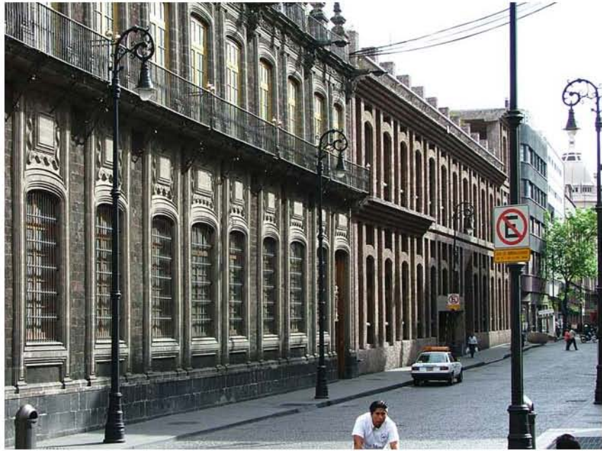
BANAMEX CASA CEDE VENUTIANO CARRANZA E ISABEL LA CATÓLICA