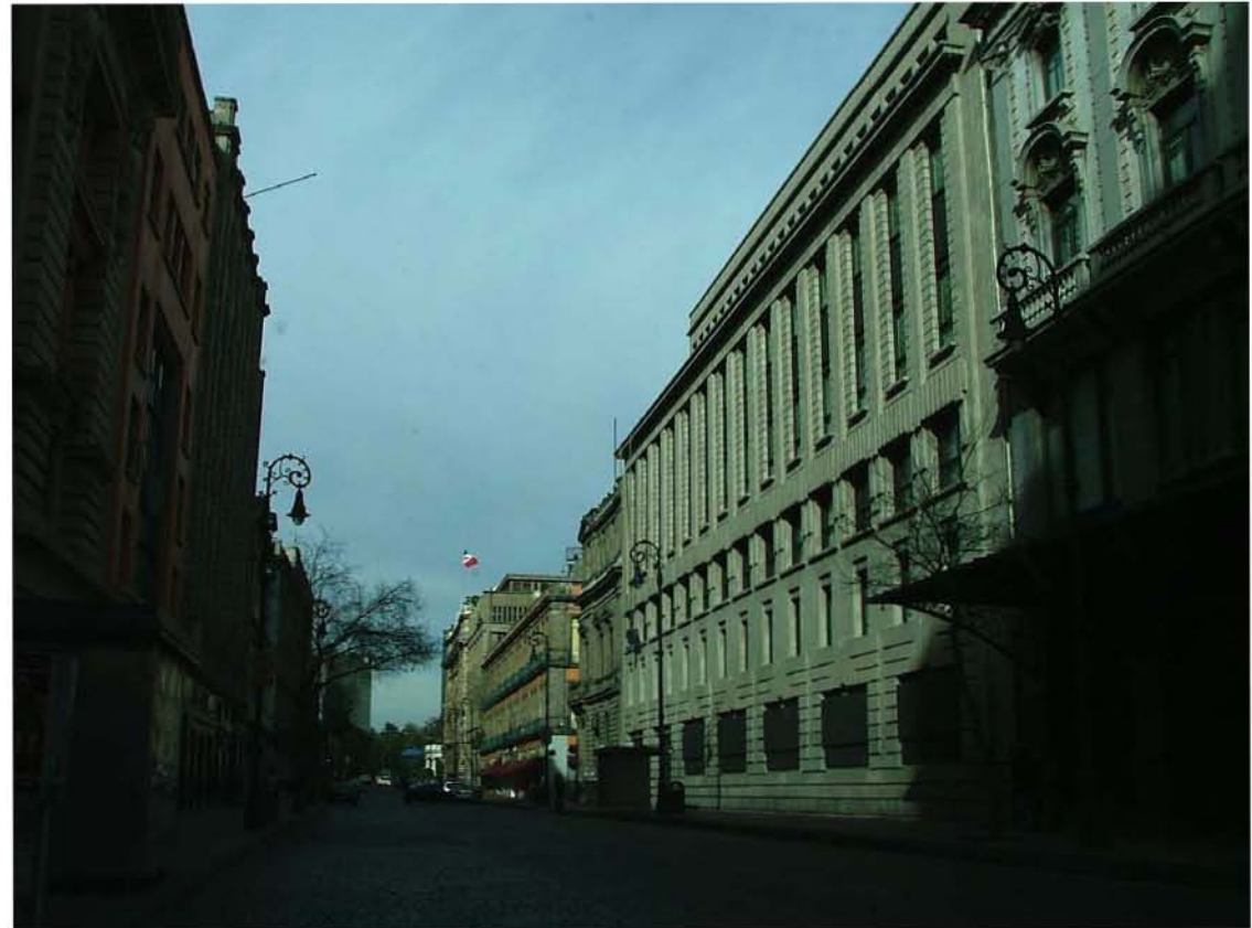
CINCO DE MAYO