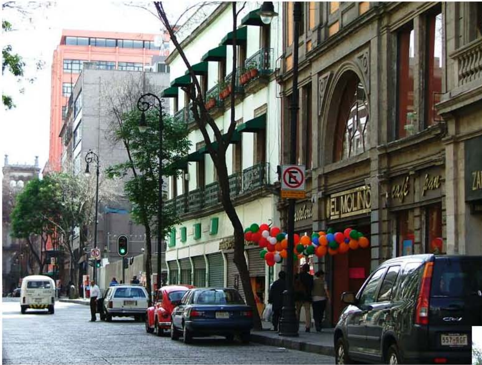
PASTELERIA EL MOLINO CALLE 16 DE SEPTIEMBRE