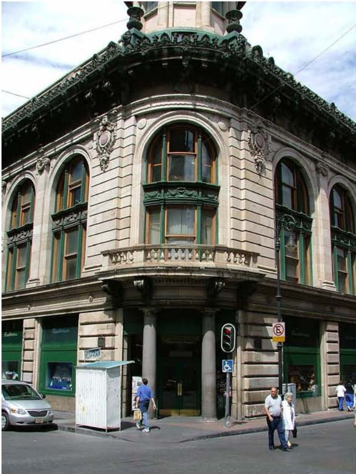
CASA BOKER 16 DE SEPTIEMBRE E ISABEL LA CATOLICA