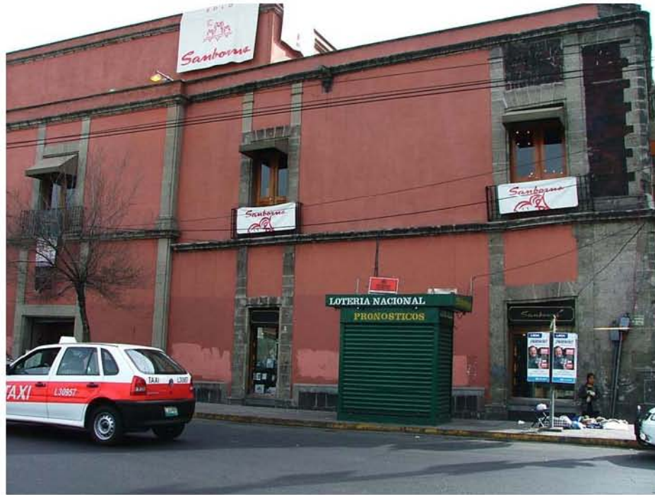
SANBORN'S EJE LAZARO CARDENAS Y TACUBA