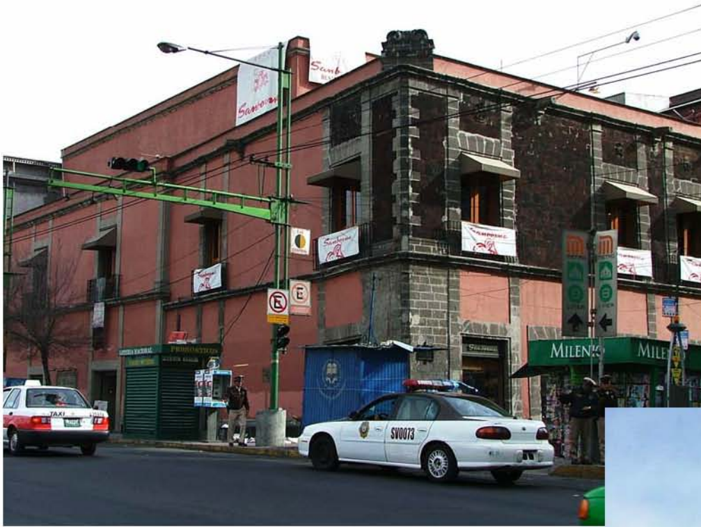
SANBORN'S EJE LAZARO CARDENAS Y TACUBA