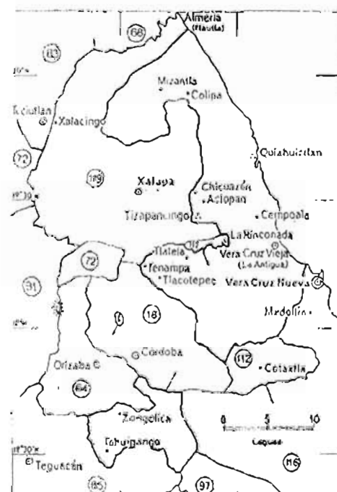
VERA CRUZ VIEJA

Mapas tomados de Gerhard, Peter. Geografía histórica de la Nueva España 1519-1821 , Traducción Stella Mastragelo, UNAM-IIIH, México, 1986, 493p (Mapas regionales de Piggott)