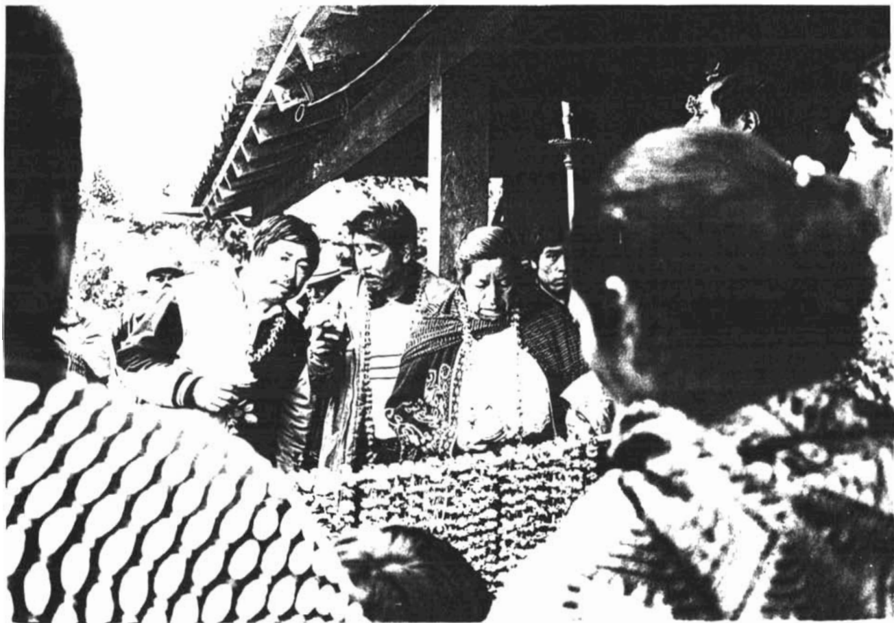
ENTREGA DE LA MAYORDOMIA DE NATIVIDAD, DICIEMBRE 2003