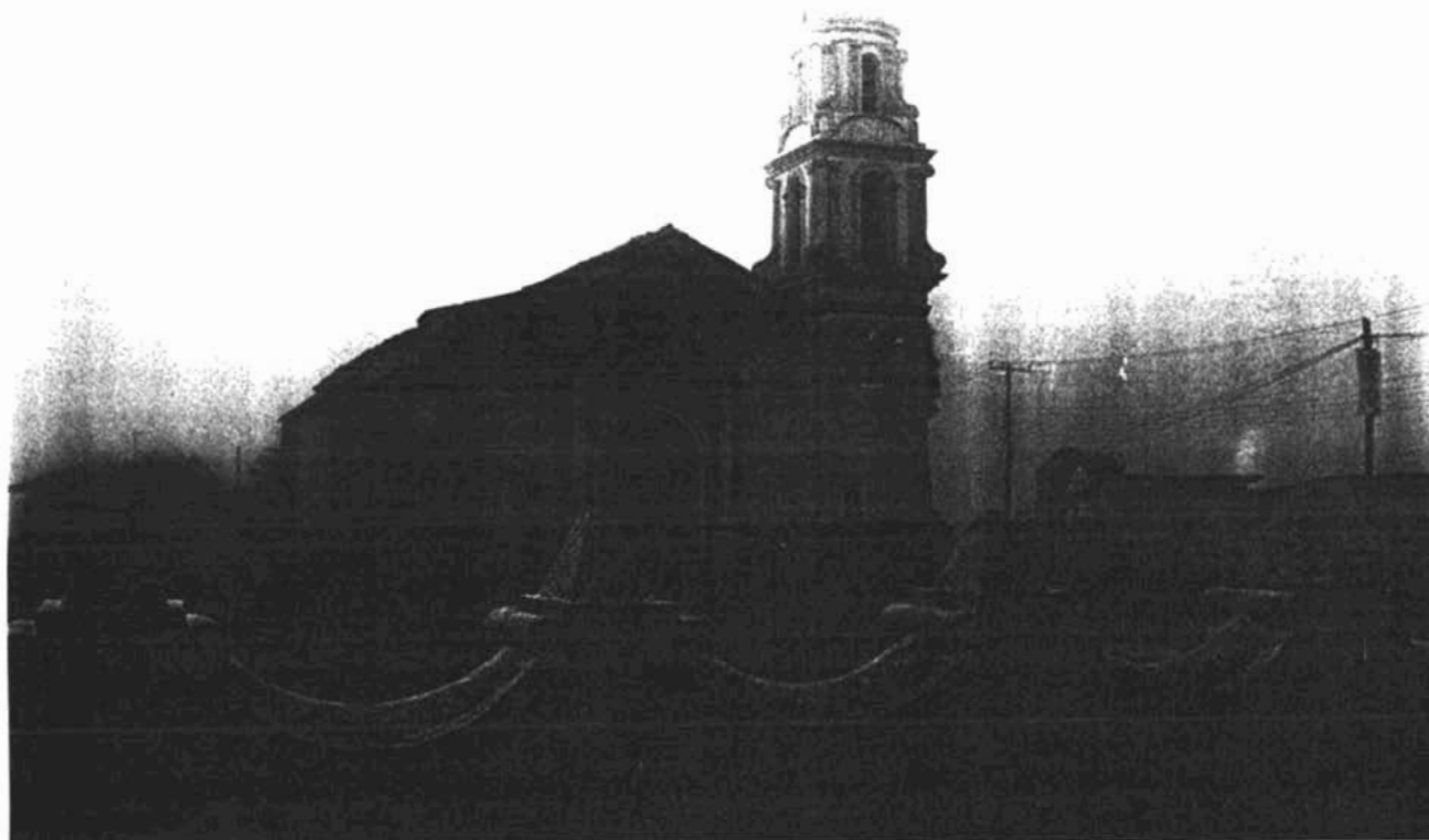
IGLESIA DE SANTA MARIA MAGDALENA DE TLAQUILPA, SIERRA ZONGOLICA