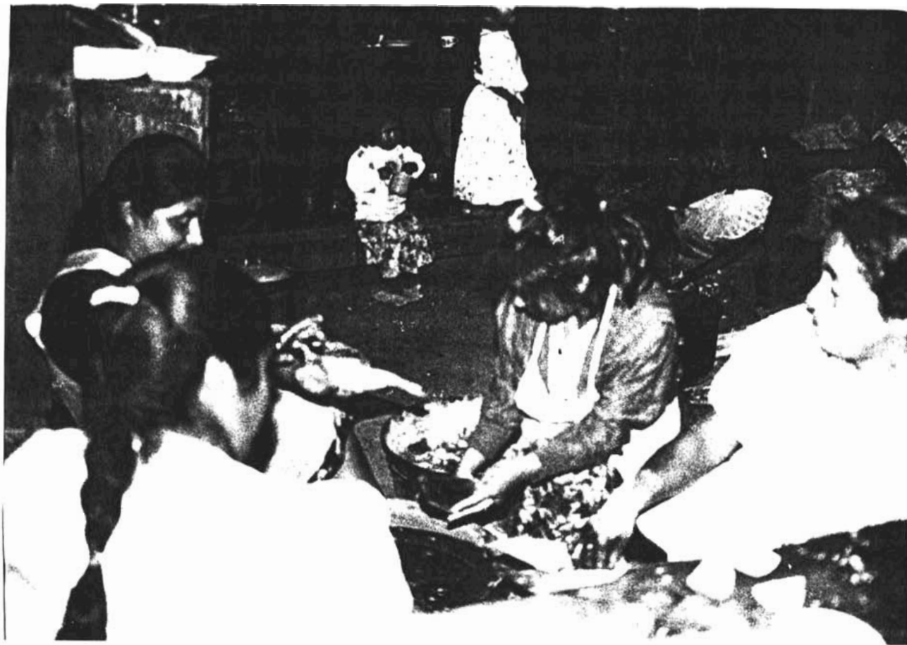
EN LA COCINA, PREPARANDO LOS ALIMENTOS PARA LA CELEBRACIÓN A LOS FIELES DIFUNTOS