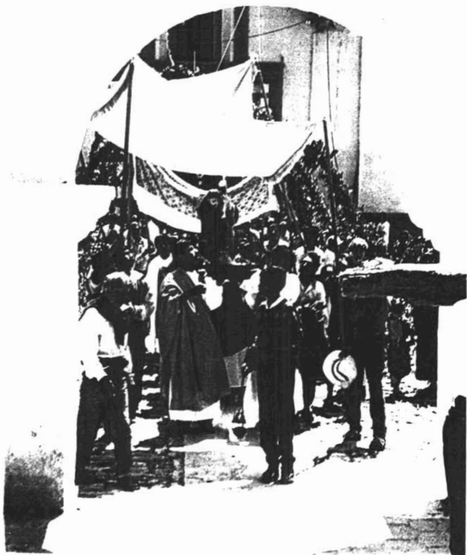
PROCESIÓN DE VIERNES SANTO, ABRIL 2002