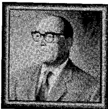
Dr. Ignacio Morones Prieto (del 26 de enero de 1966 al 30 de noviembre de 1970)

Nació en Linares Nuevo León, en el año de 1900. Médico Cirujano egresado de la Universidad Autónoma de San Luis Potosí y de La Sorbona, de París. En San Luis Potosí fue rector de la Universidad, Director de la Facultad de Medicina y del Hospital Escuela. Fue Gobernador de Nuevo León y Secretario de Salubridad y Asistencia. Como director del IMSS creó la Dirección General de Rehabilitación. En su período el IMSS cumplió 25 años de servicios. Abrió al público el Centro Vacacional Oaxtepec, con la finalidad de proporcionar descanso, esparcimiento y recuperación a los trabajadores. Instaló la Comisión Asesora de Empresarios y Trabajadores, con el fin de orientarlos en el conocimiento y manejo de la Ley del Seguro Social. Murió en el año de 1974.