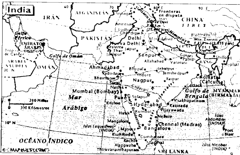
Ubicación geográfica de la India.