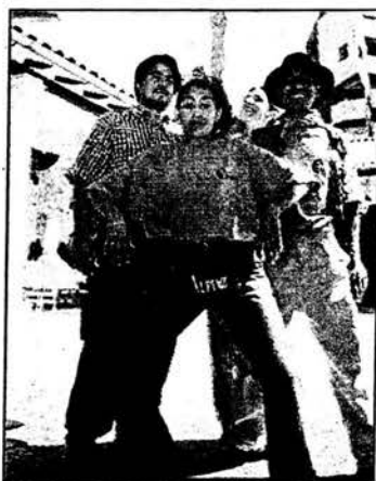
COMUNICAR, LA BUSQUEDA • Actores de "Cornisa 20" posan en la sede.