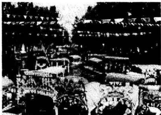
Las típicas trajineras de Xochimilco

visitantes nacionales y extranjeros cada fin de semana.