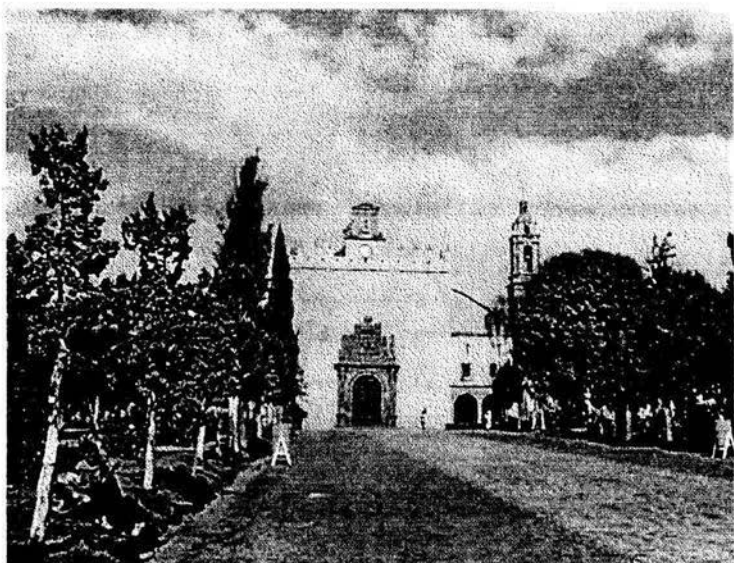
Iglesia de San Bernardino de Siena, resguardo del Niñoopa.

existía una fuerte relación entre religión y poder político.