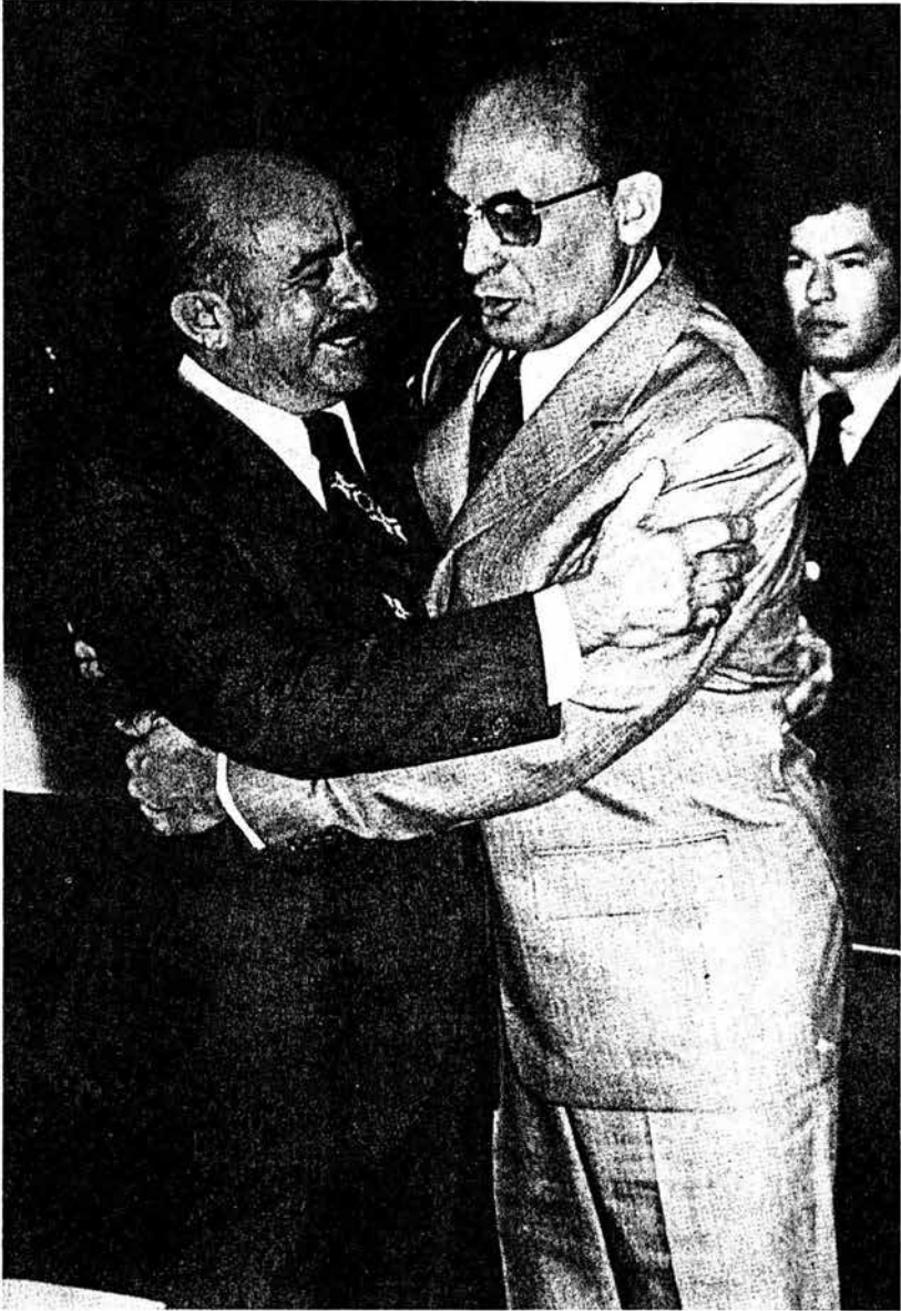
Napoleón Gómez Sada y Luis Echeverría Álvarez