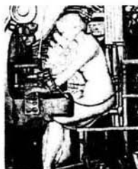
Detalle de la novela El crimen (1904) de Diego Rivera